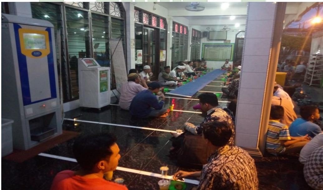
Foto kegiatan buka puasa sunah bersama di hari kamis di Masjid Al-falaah