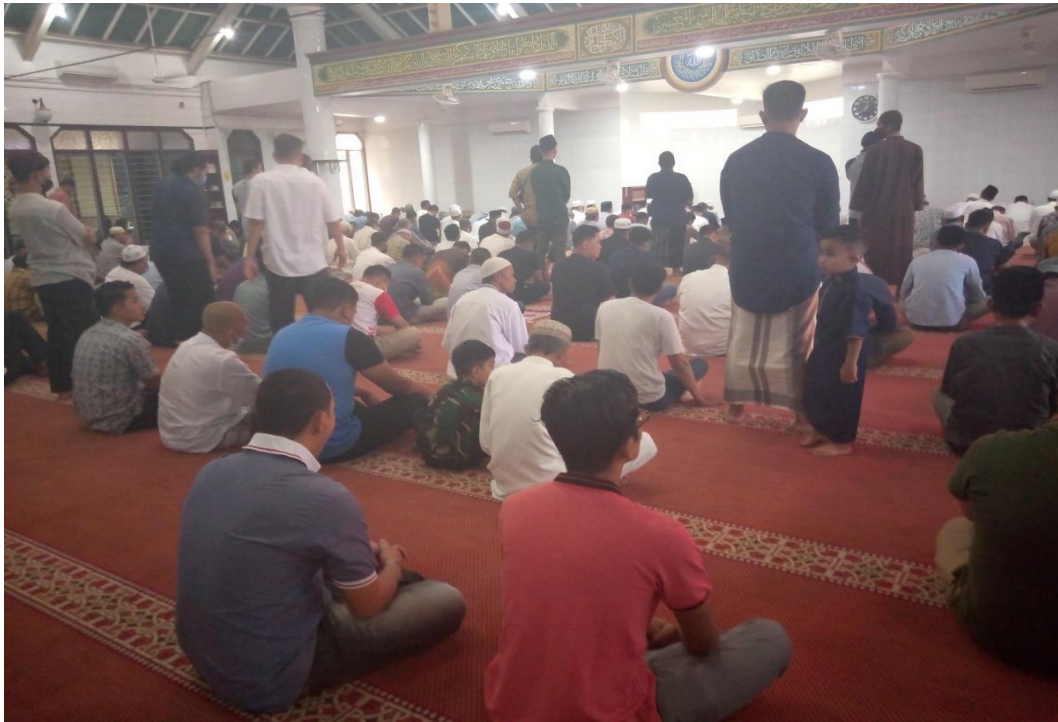
Kegiatan salat Jum'at di Masjid Al-falaah