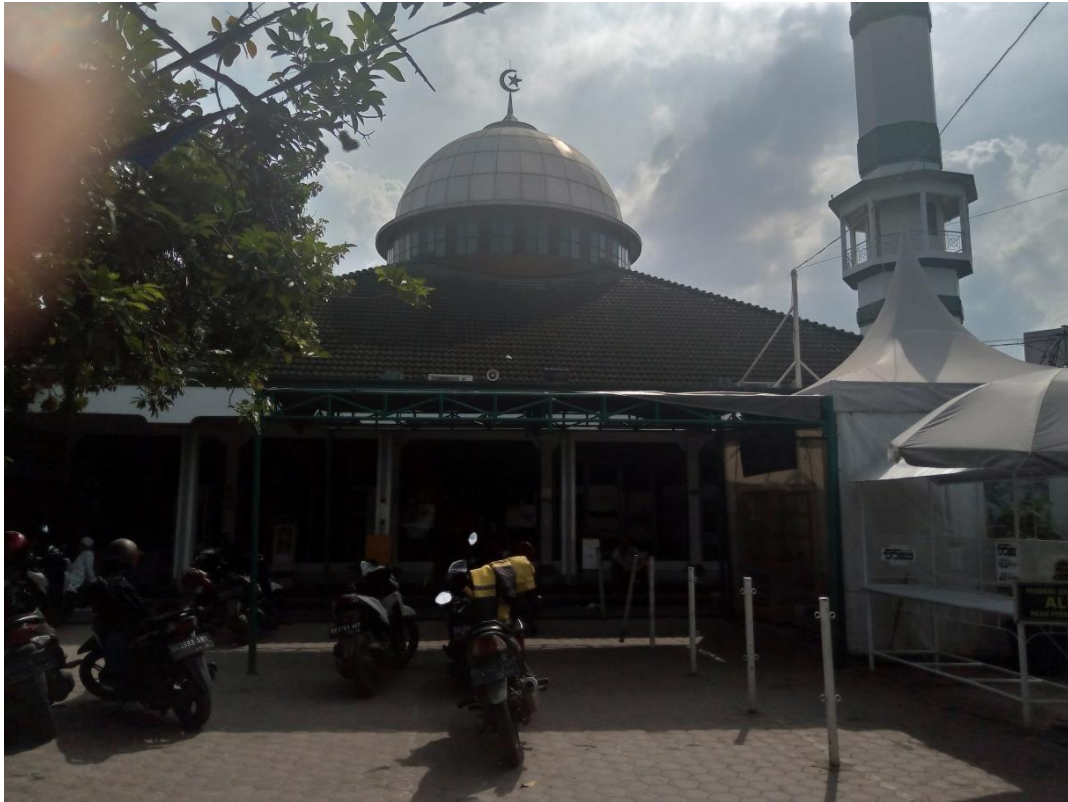
Foto Masjid Al-falaah