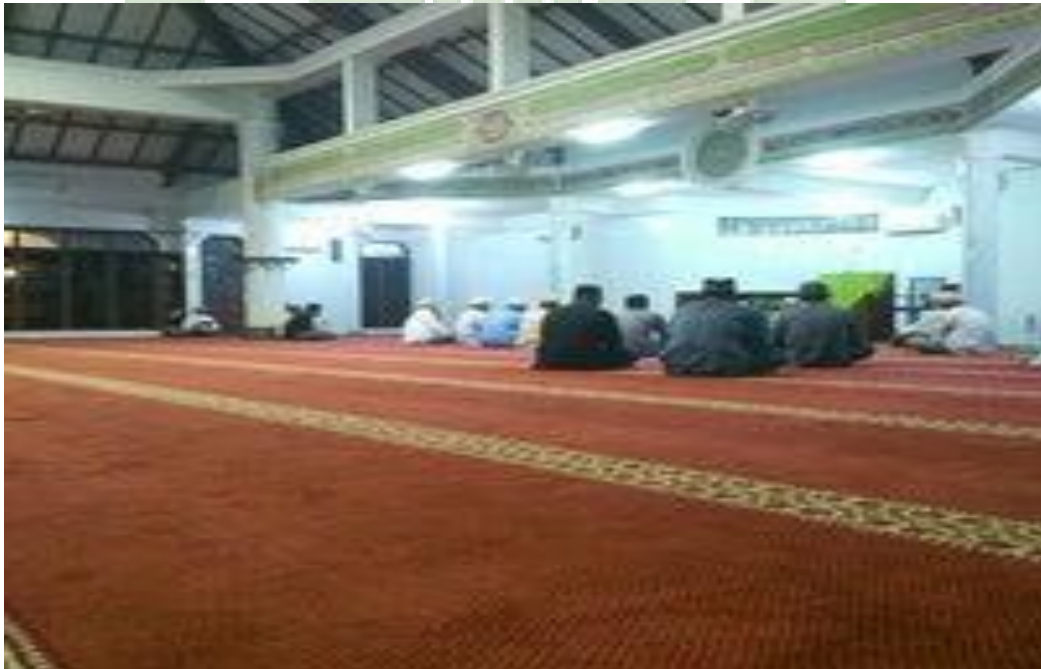
Kegiatan pengajian mingguan di Masjid Al-falaah