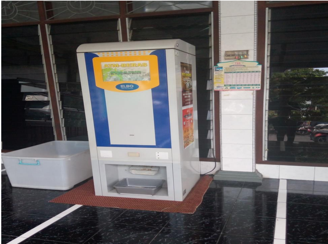
Mesin ATM Beras Masjid Al-falaah