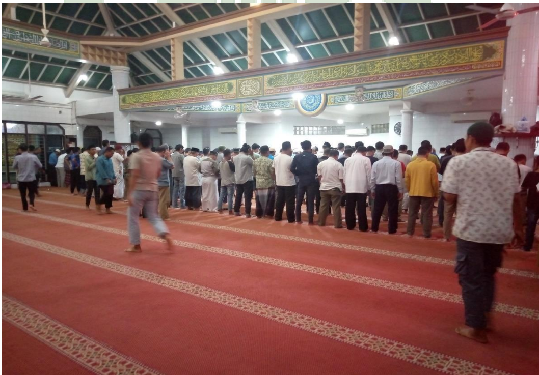
Kegiatan salat berjamaah pada waktu Maghrib