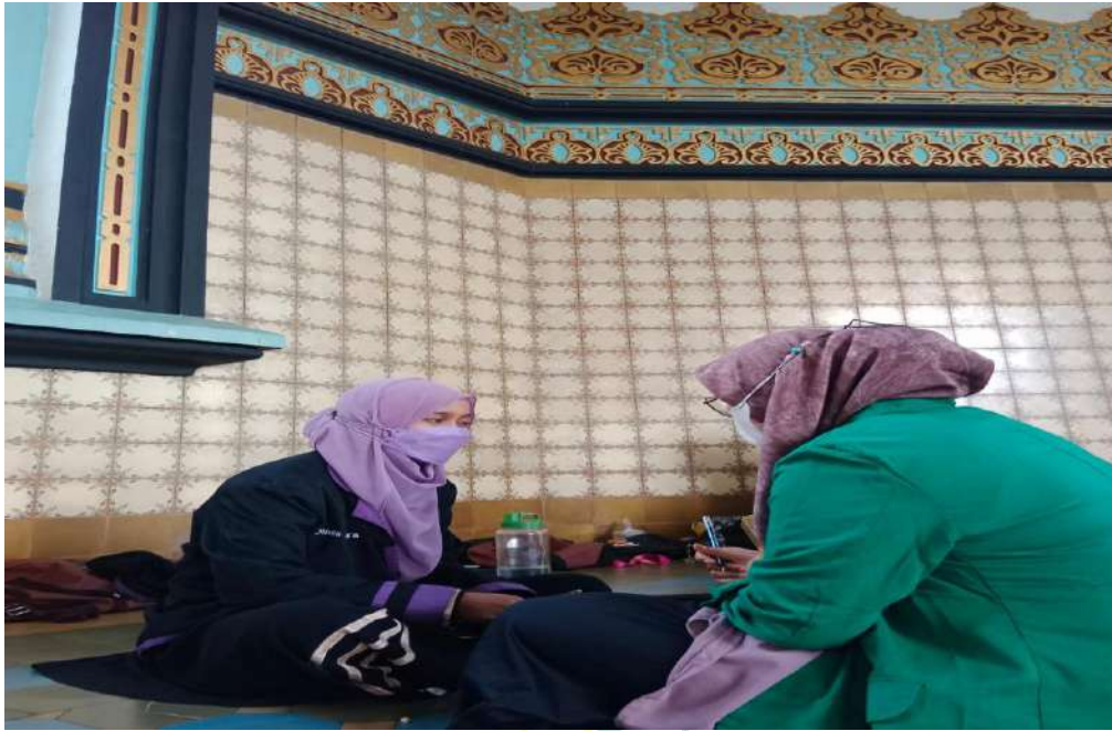
Gambar 3: Wawancara Bersama Ketua Umum MHM