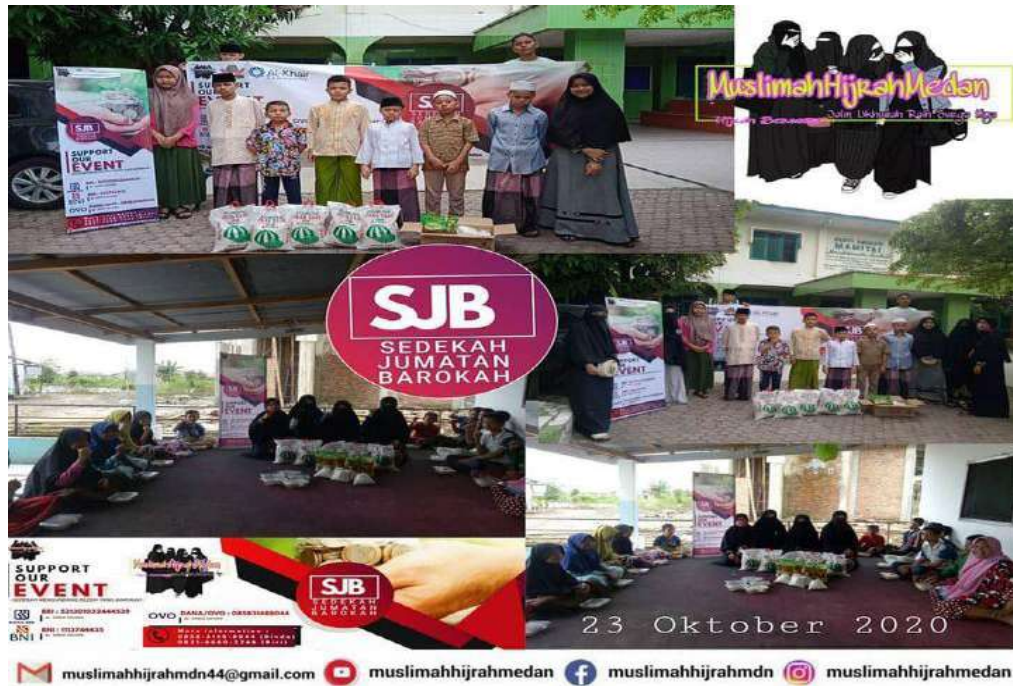
Gambar 11: Foto Kegiatan Sedekah Jumat Barokah