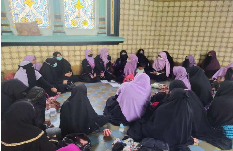
Gambar 7: Foto Meet And Great