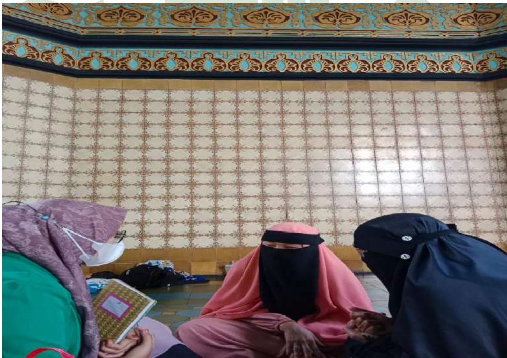
Gambar 8: Foto Bersama Anggota Dan Sekertaris MHM