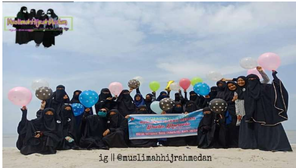
Gambar 5: Foto Kegiatan Rihlah Muslimah Hijrah Medan.