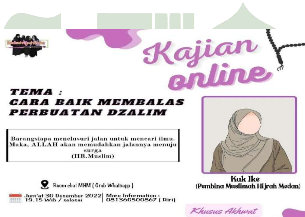
Gambar 12: Foto Poster Kegiatan Kajian Online MHM