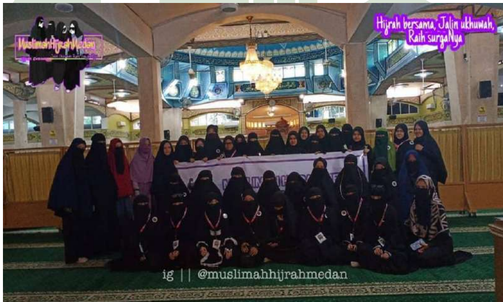
Gambar 4: Foto Seluruh Anggota Muslimah Hijrah Medan