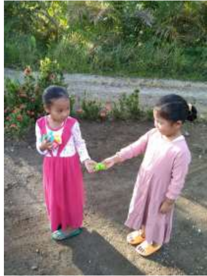
Sumber : Peneliti