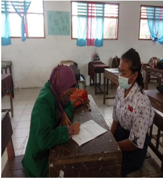
Gambar 8 Wawancara dengan Siswa