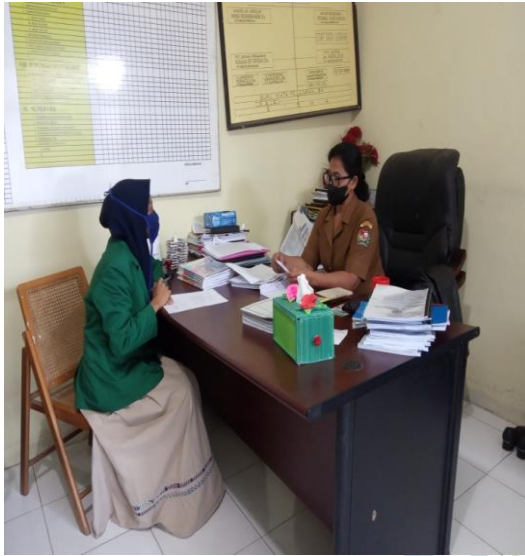
Gambar 4 Wawancara dengan Kepala Sekolah