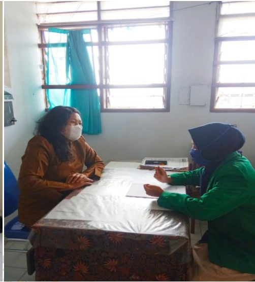
Gambar 5 Wawancara dengan Guru BK