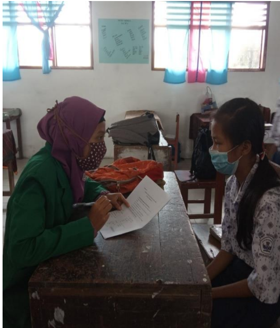
Gambar 12 Wawancara dengan Siswa