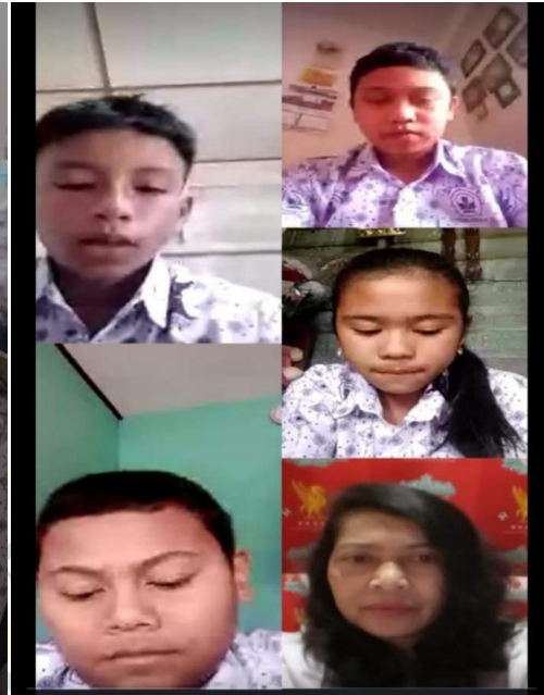
Gambar 13 Pelaksanaan Layanan Bimbingan Kelompok Secara Daring