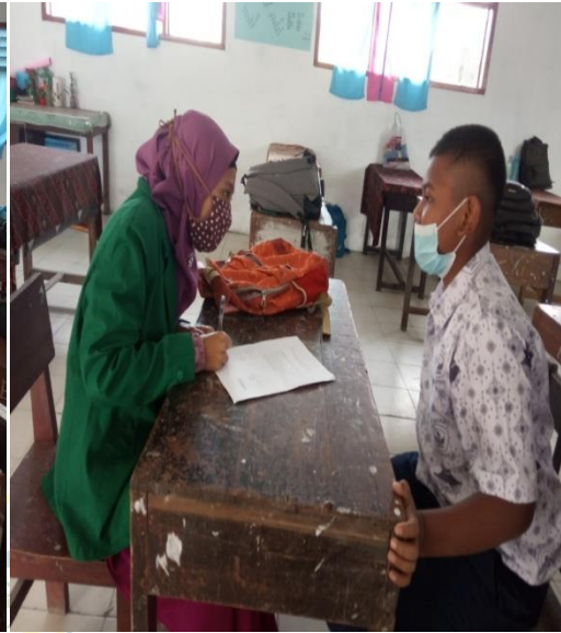
Gambar 9 Wawancara dengan Siswa