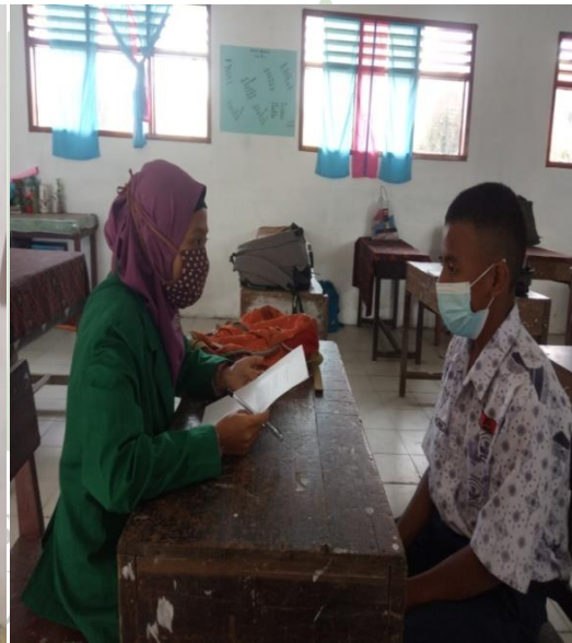
Gambar 7 Wawancara dengan Siswa