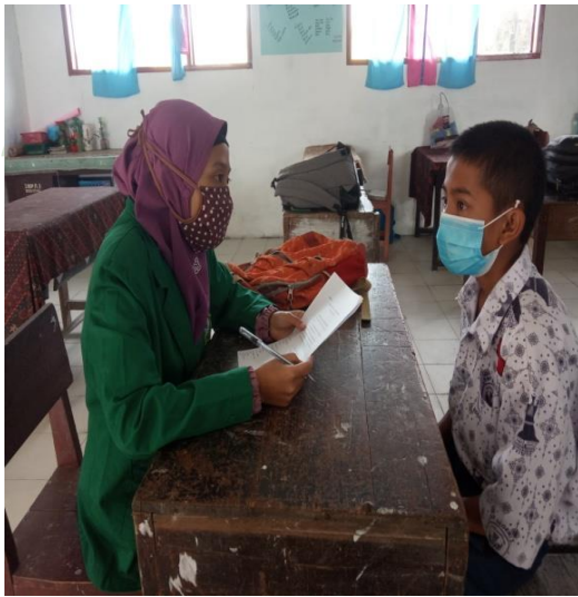
Gambar 10 Wawancara dengan Siswa