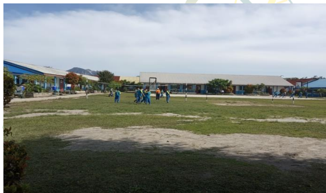
Gambar 2 Halaman SMP Negeri 3 Berastagi