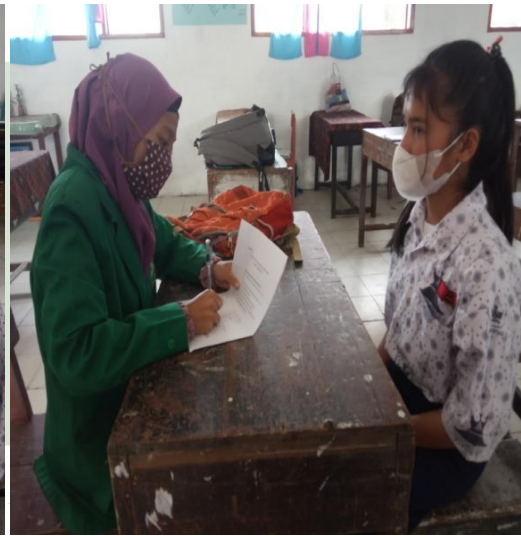
Gambar 11 Wawancara dengan Siswa