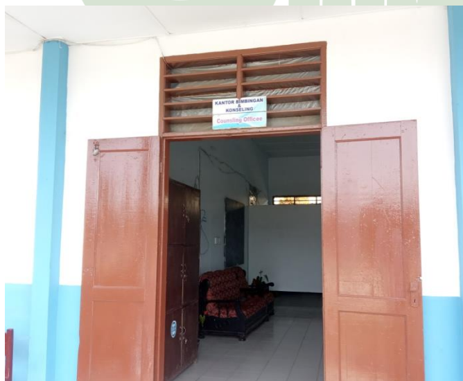
Gambar 3 Pintu Depan Ruangan Bimbingan dan Konseling