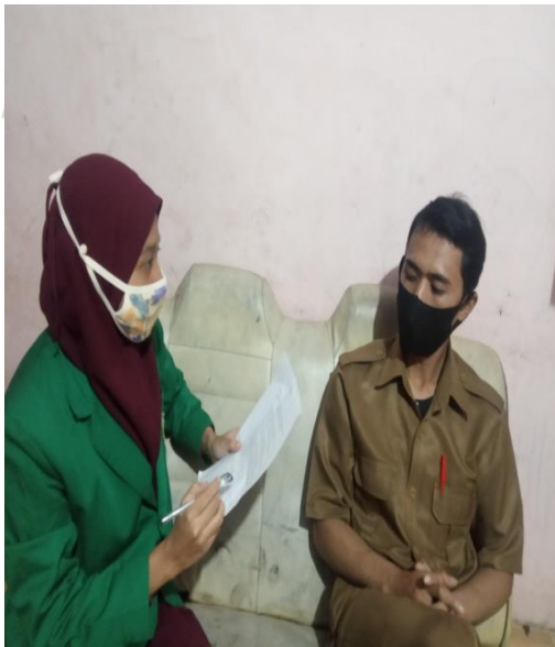
Gambar 6 Wawancara dengan Wali Kelas