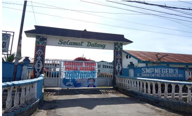
Gambar 1 Pintu gerbang depan SMP Negeri 3 Berastagi