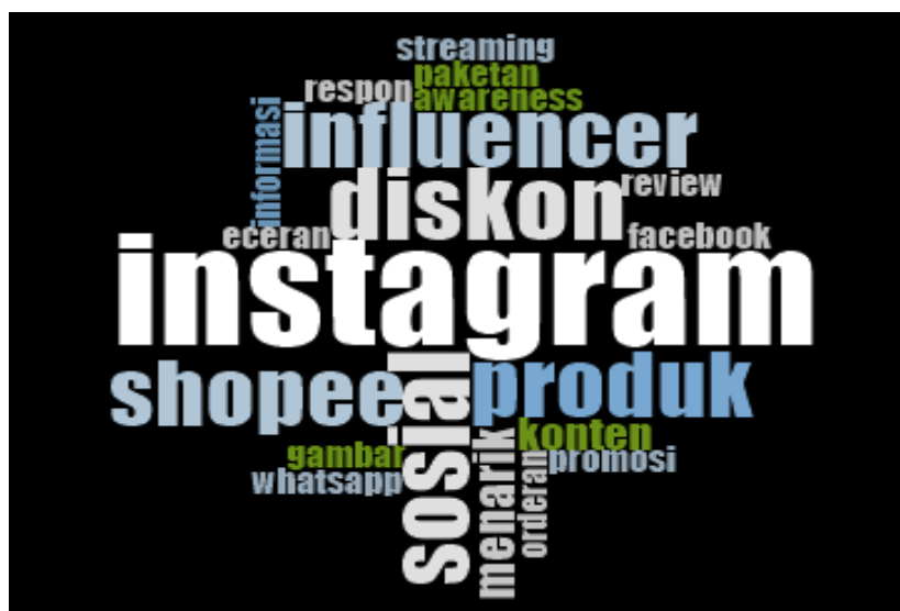
Gambar 1. Word Cloud

Dalam penelitian ini, memanfaatkan metode N.VIVO untuk mengurutkan kata-kata dengan menggunakan program Word Cloud paling sering muncul.