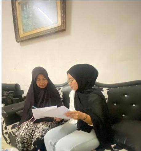
Mewawancarai dan pengisian kuesioner di jalan Seroja