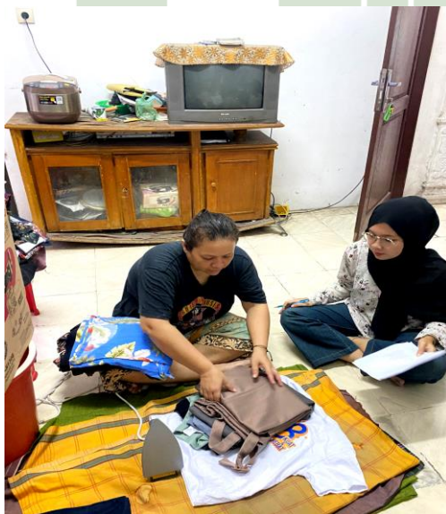
Pengisian kuesioner di jalan Amal