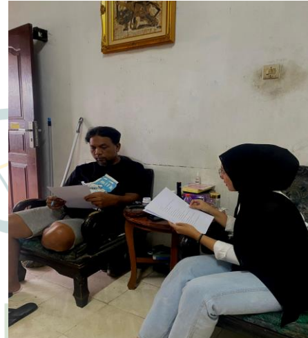
Mewawancarai dan pengisian kuesioner di jalan Asoka