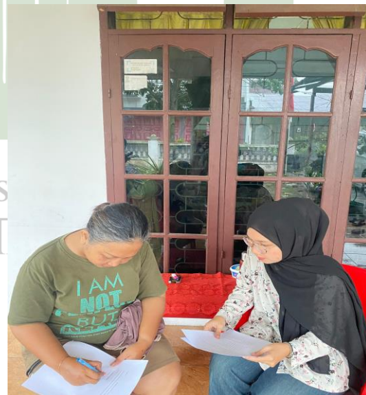
Pengisian kuesioner di jalan Sunggal