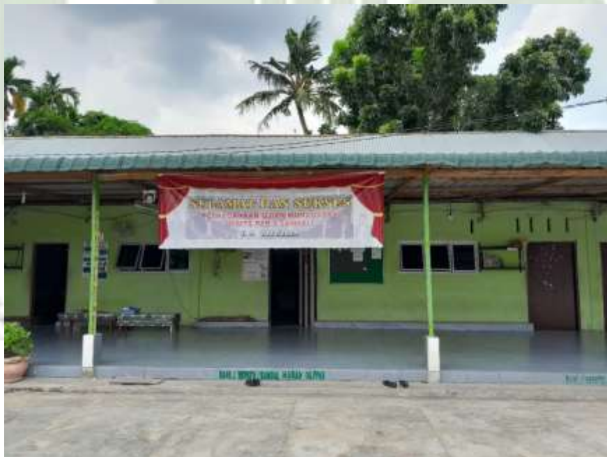
Keterangan: Halaman depan kelas / literasi MAS PAB 1 Sampali Tahun 2024