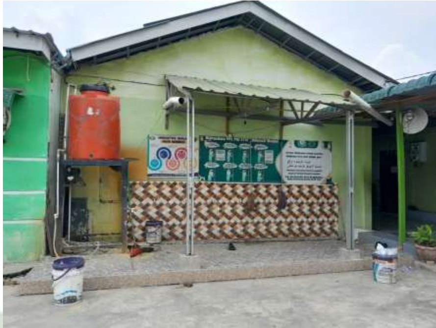
Keterangan: Tempat Wudhu' Siswa/Siswi MAS Pab 1 Sampali Tahun 2024

UNIVERSITAS ISLAM AWIYAH SUMATERA UTARA MEDAN