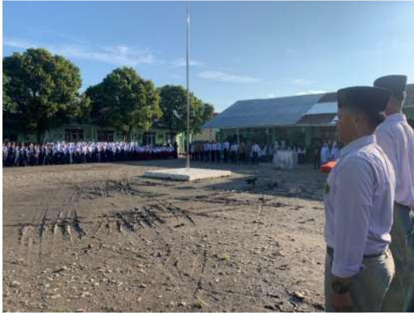
Keterangan : Lapangan upacara MAS PAB 1 Sampali Tahun 2024