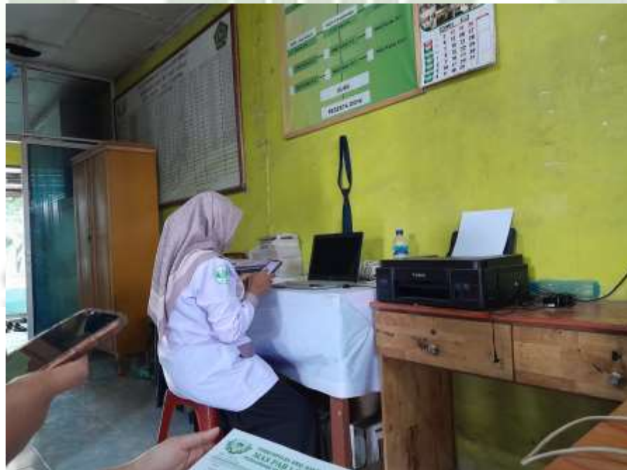
Keterangan : Ruang Kantor MAS PAB 1 Sampali Tahun 2024