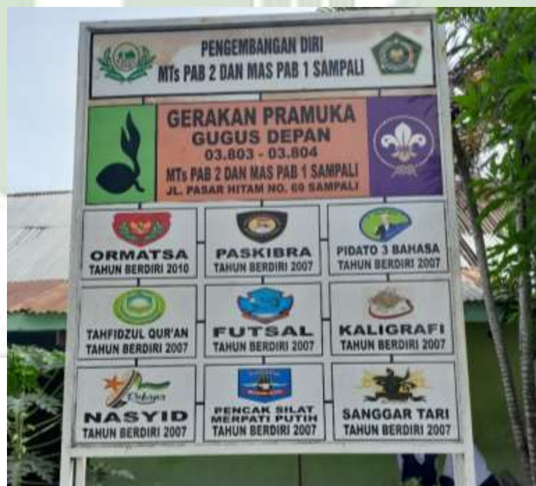
Keterangan: Plang MAS PAB 1 Sampali dan Plang Pengembangan Diri MAS PAB 1 Sampali