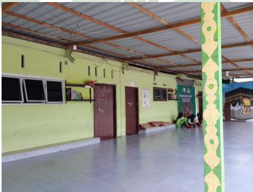
Keterangan: Halaman depan kelas / literasi MAS PAB 1 Sampali Tahun 2024