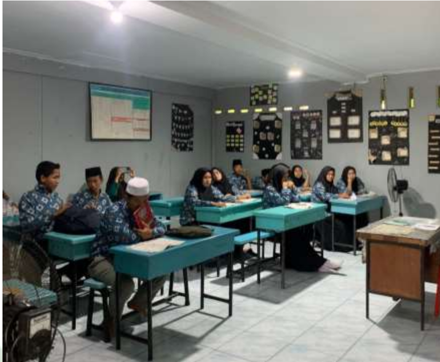
Keterangan: Ruang kelas MAS PAB 1 Sampali Tahun 2024