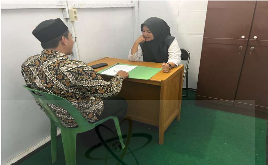
Gambar 7. Wawancara dengan Guru BK