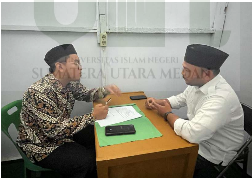
Gambar 6. Wawancara dengan Guru BK