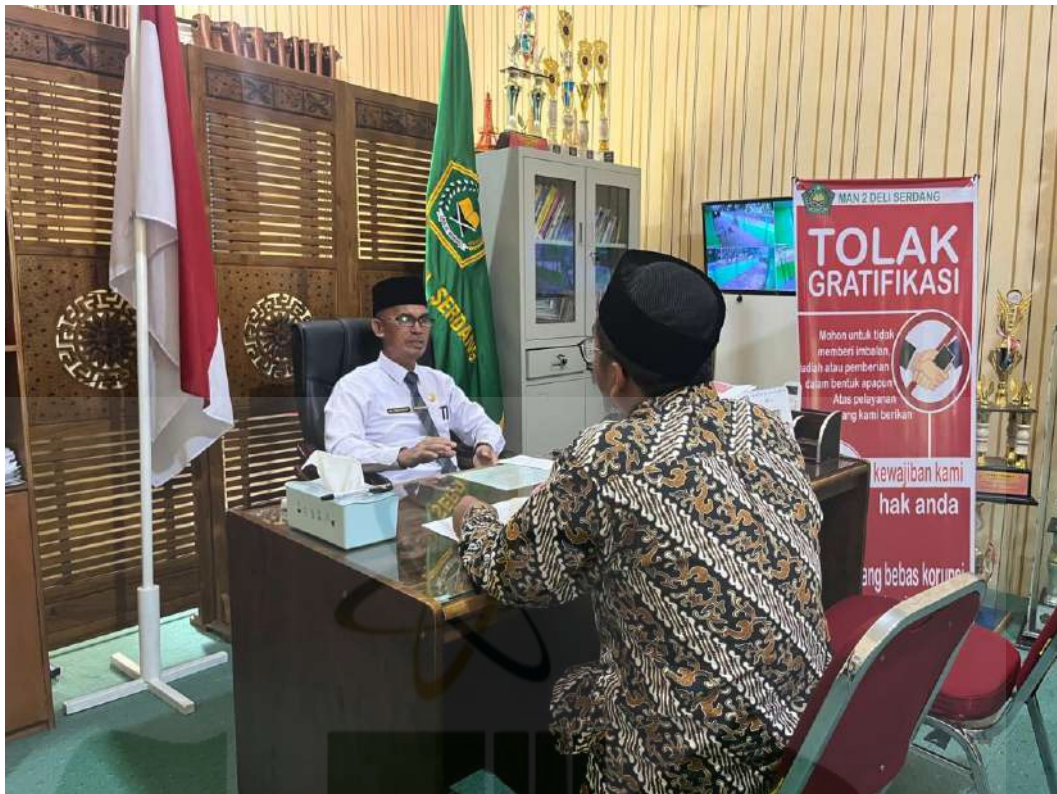
Gambar 11. Wawancara dengan Kepala Sekolah