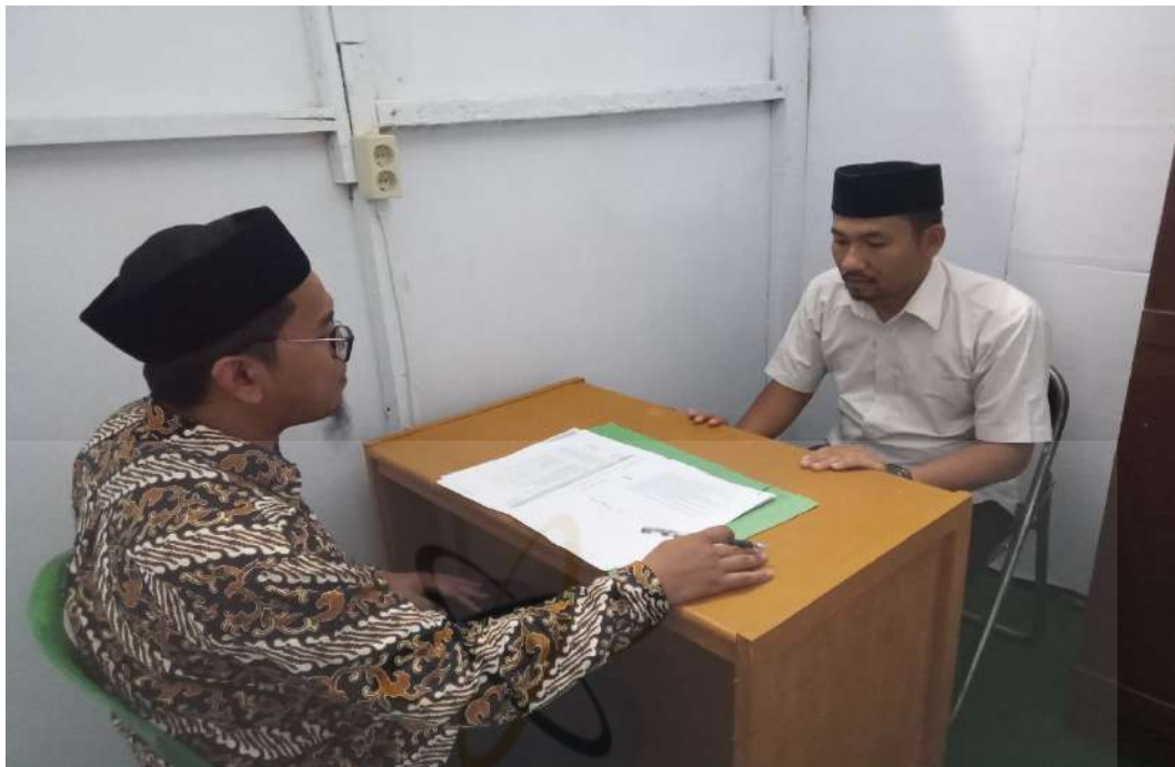
Gambar 9. Wawancara dengan Guru BK