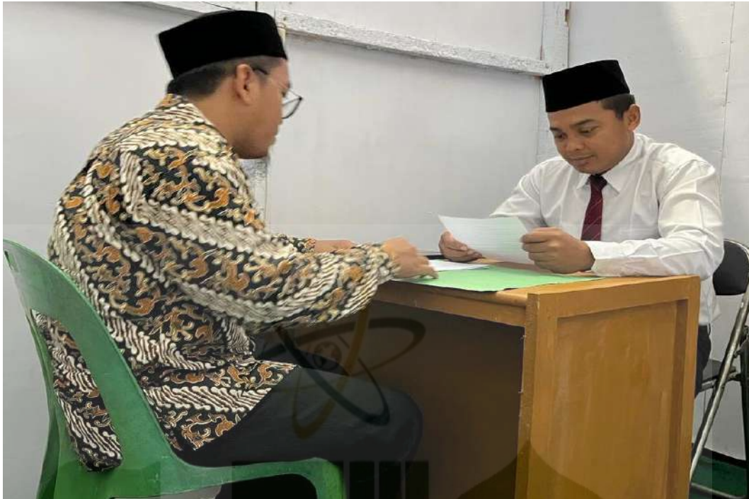
Gambar 5. Wawancara dengan Guru BK