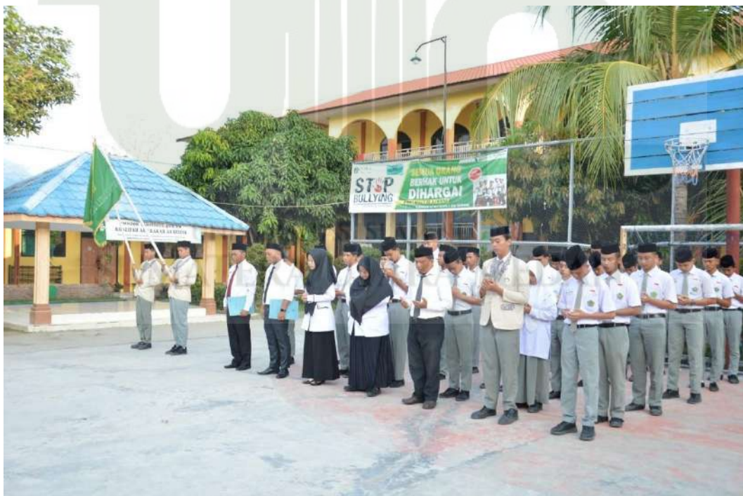
Gambar 4. Pelantikan Satgas Anti-Bullying