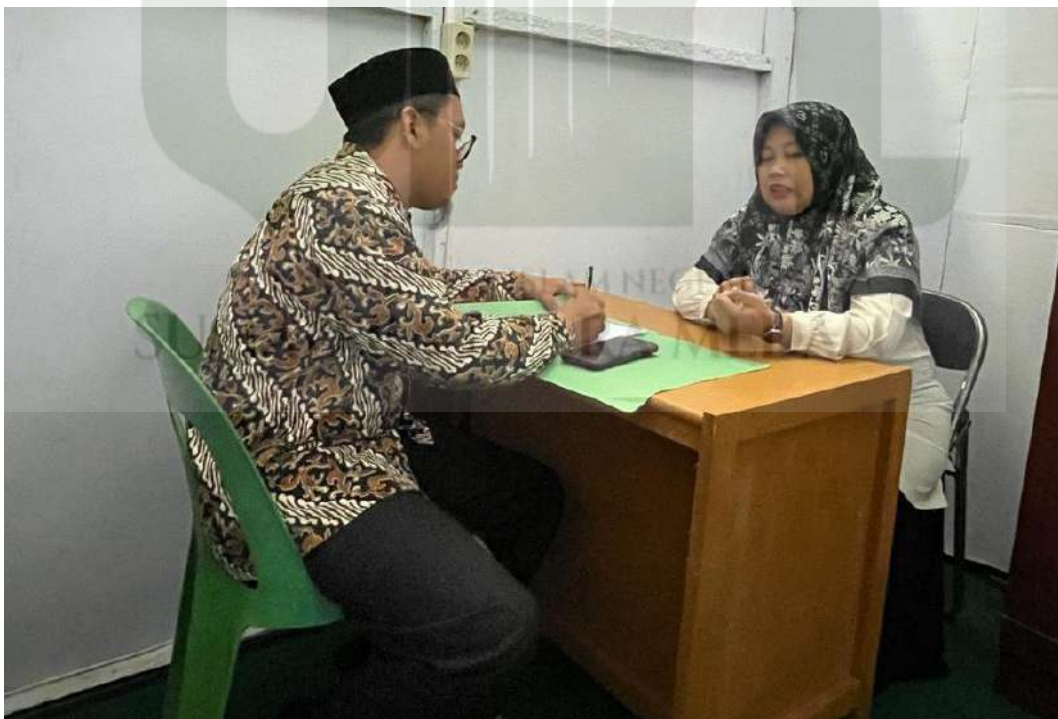
Gambar 8. Wawancara dengan Guru BK