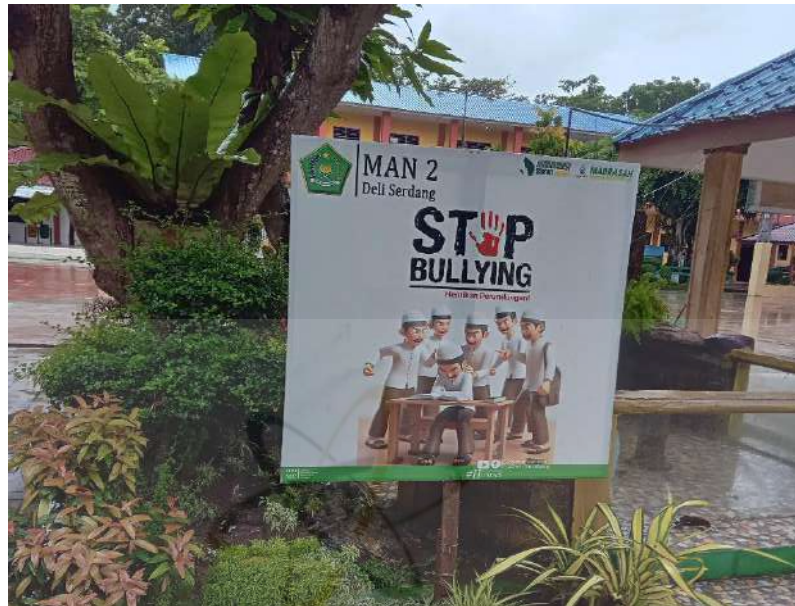
Gambar 3. Spanduk “STOP BULLYING”