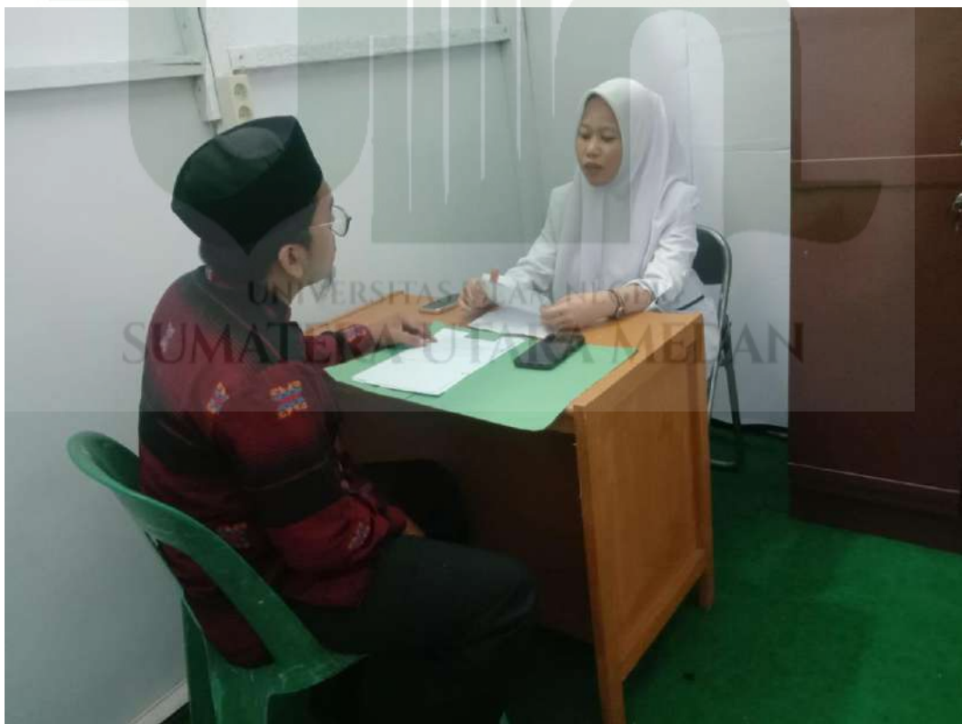
Gambar 10. Wawancara dengan Guru BK