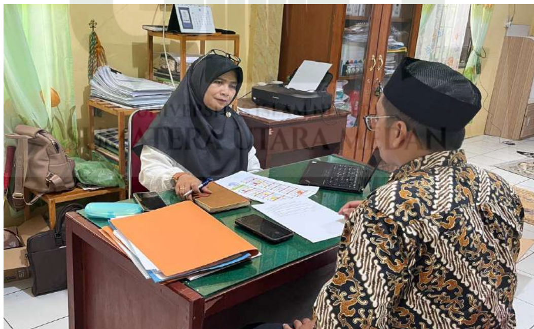
Gambar 12. Wawancara dengan Wakil Kepala Sekolah