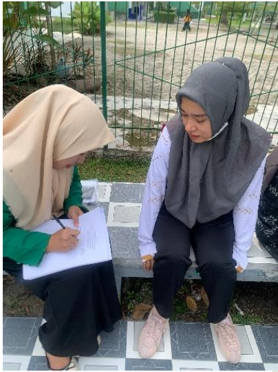
Gambar 6.3 Wawancara pada ibu mengenai pola asuh ibu