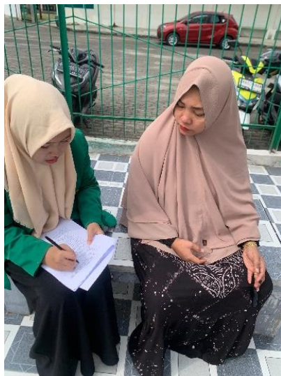
Gambar 6.4 Wawancara pada ibu mengenai perilaku picky eater