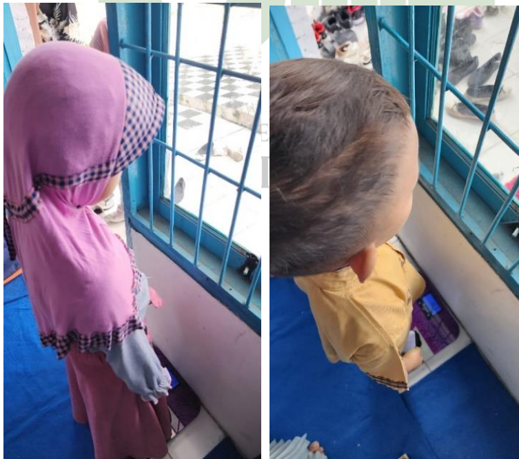
Gambar 6.2 Pengukuran Berat Badan Pada Anak Prasekolah