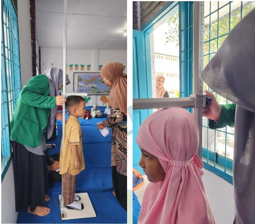
Gambar 6.1 Pengukuran Antropometri Tinggi Badan Pada Anak Prasekolah