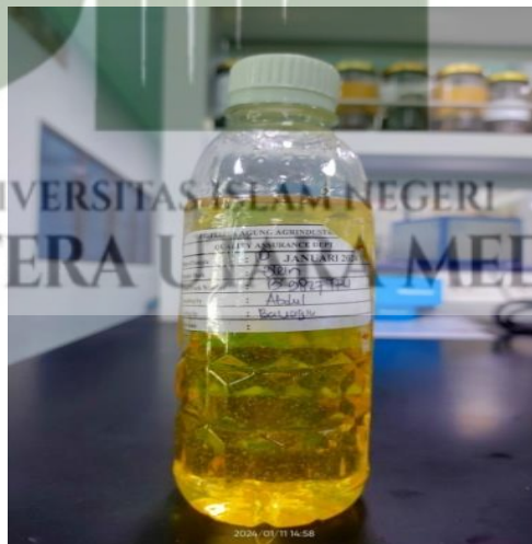
Contoh Minyak Makan