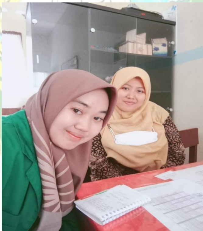
Wawancara bersama ibu minatti selaku nasabah bank sampah diskri