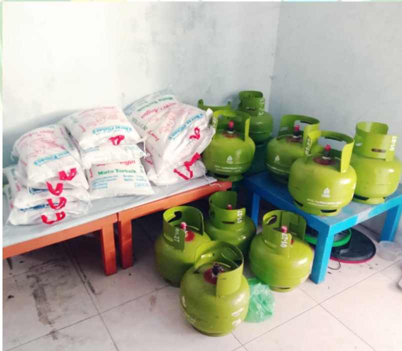
Program-program manfaat tabungan jadi sembako