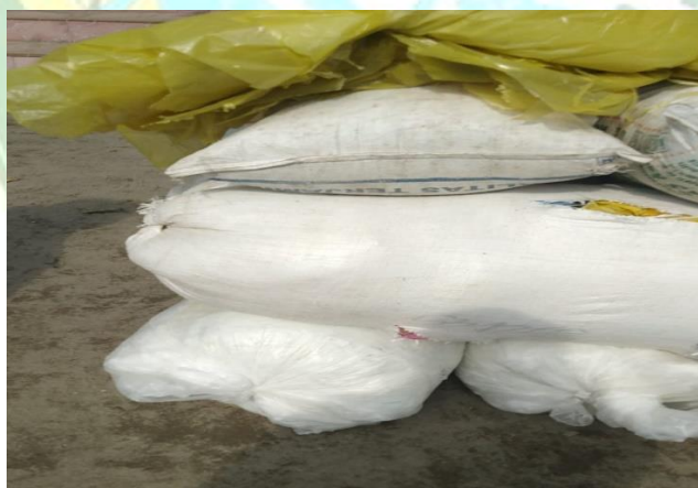
Sampah yang sudah dipilah dan yang akan disetorkan