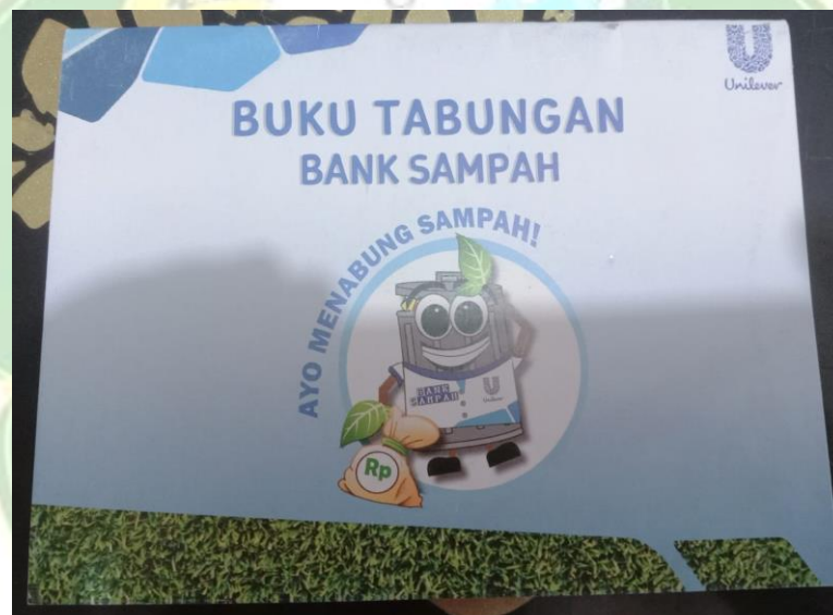
Tabungan Bank Sampah Diski Mandiri.