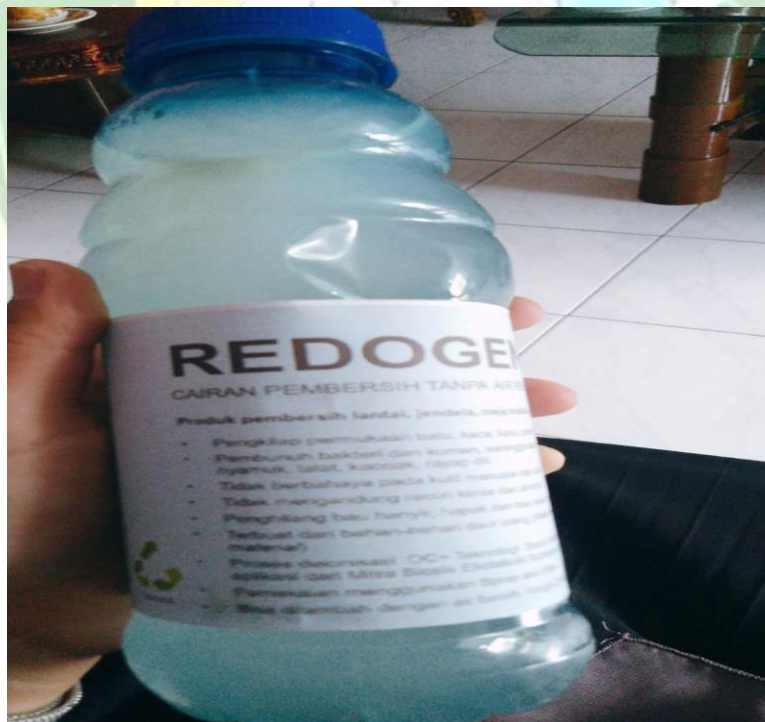
Redogen (cairan yang sudah di olah jadi handsaintaizer dan alat cairan lantai)