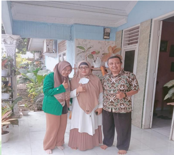
Wawancara bersama ketua dan direktur bank sampah diskri mandiri.