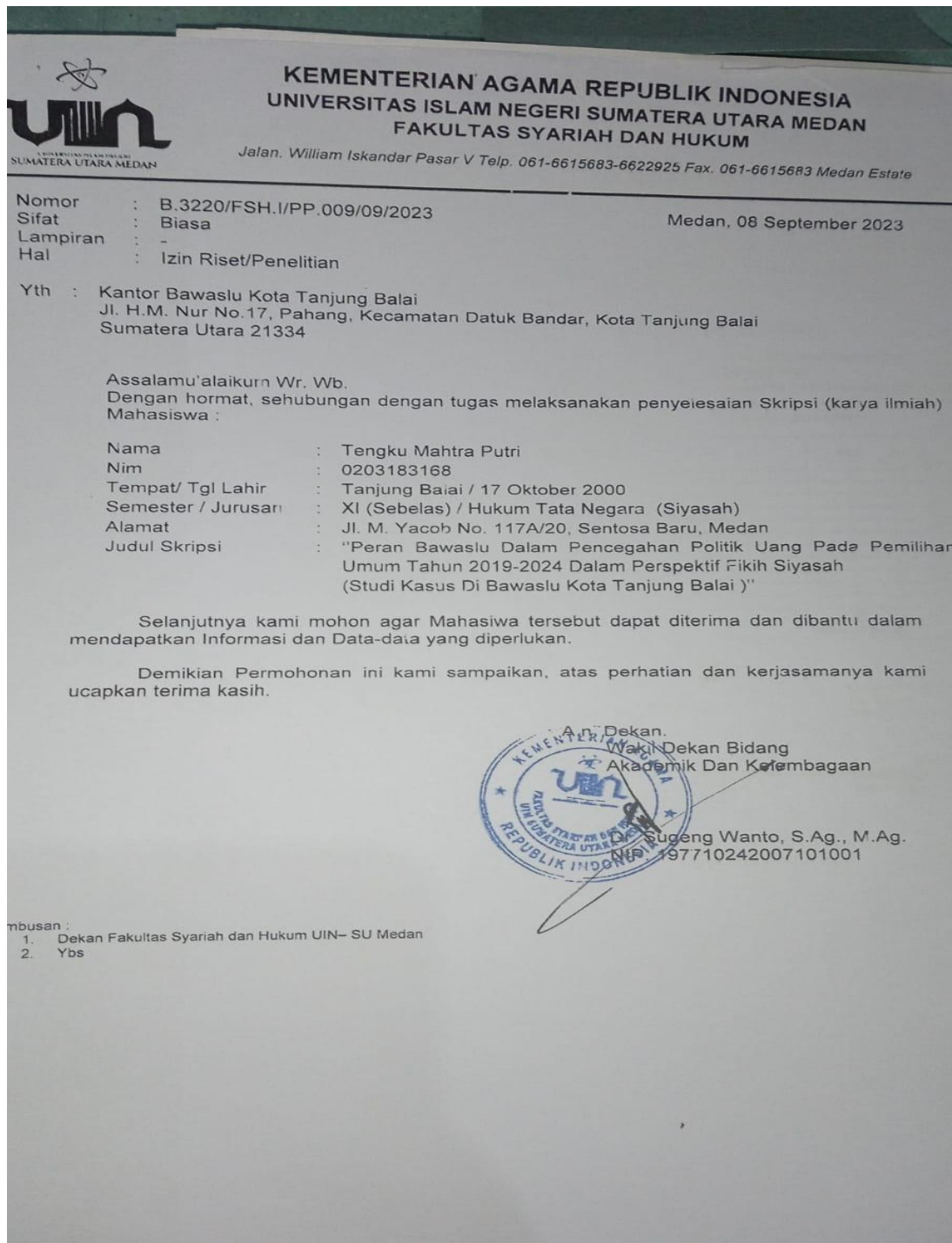
Gambar 1. Surat Izin Riset