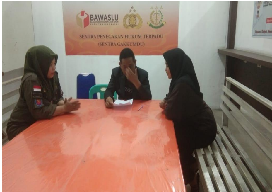
Gambar 3. Foto Wawancara Bersama Bawaslu Tanjung Balai