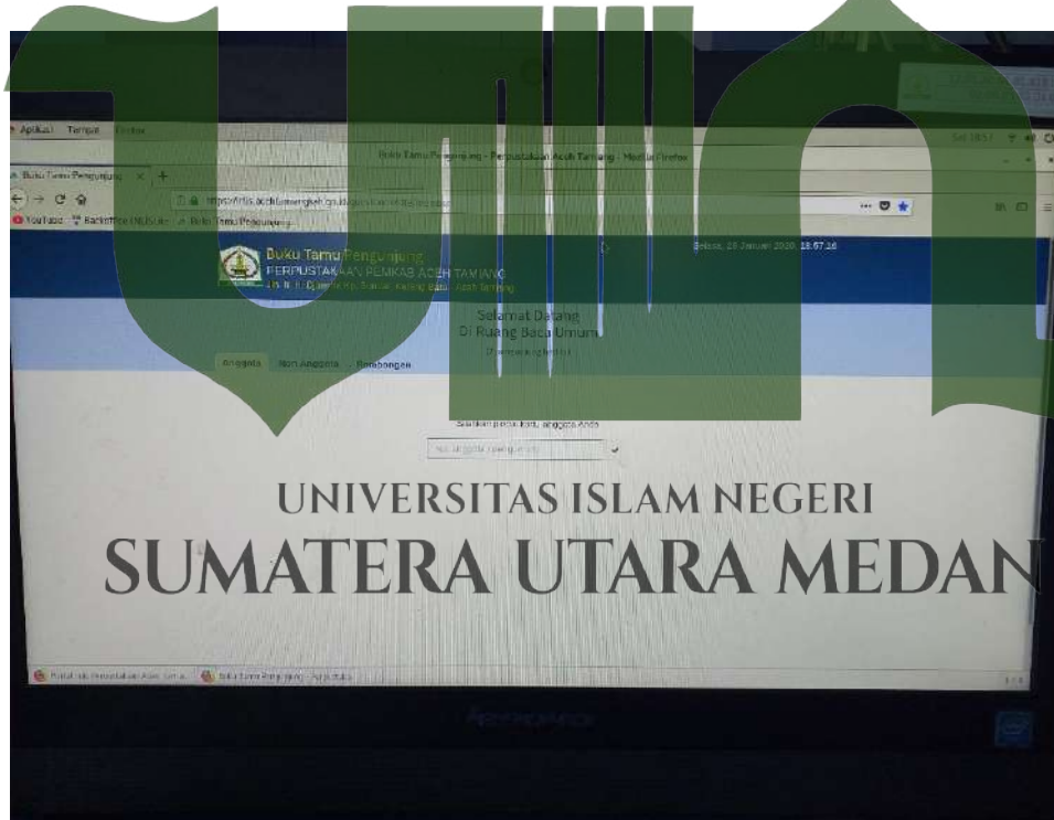
Gambar 2. Tampilan Bagian untuk Masuk ke Database INLISLite dengan Memasukkan Nomor Anggota/Pengunjung yang telah Terdaftar di Perpustakaan