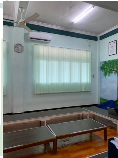
Gambar 4. Ruang Baca dan Ruang Belajar di Perpustakaan STIKES Asy- Syifa Kisaran