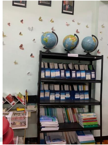
Gambar 2. Rak Koleksi Kumpulan Artikel dan Karya Ilmiah