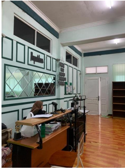
Gambar 5. Layanan Sirkulasi Di Perpustakaan STIKES Asy-Syifa Kisaran