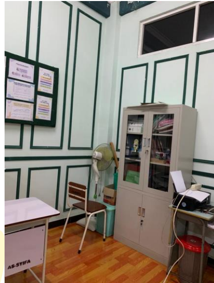
Gambar 6. Layanan Cetak