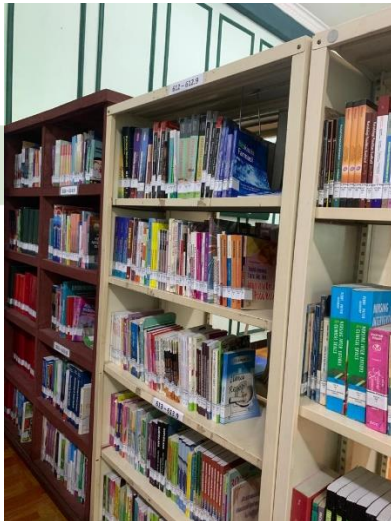
Gambar 3. Koleksi Bahan Pustaka yang Sering Dibutuhkan Pengguna