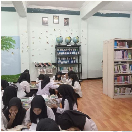
Gambar 1. Pelaksanaan Kegiatan Teacher Librarian