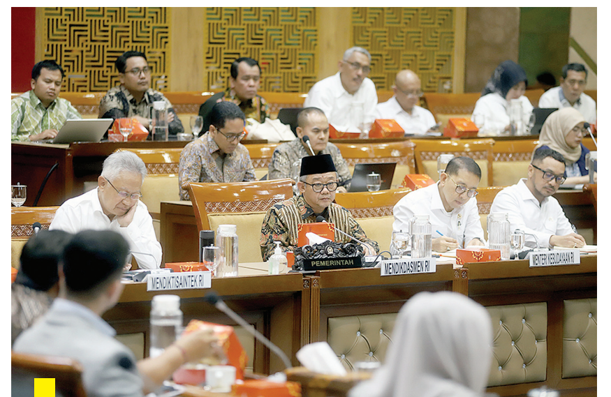
Menteri Pendidikan Dasar dan Menengah (Dikdasmen) Abdul Mu'ti memastikan bakal ada kenaikan gaji guru untuk meningkatkan kesejahterannya. Kenaikan gaji bukan hanya untuk guru yang telah berstatus sebagai aparatur sipil negara (ASN).