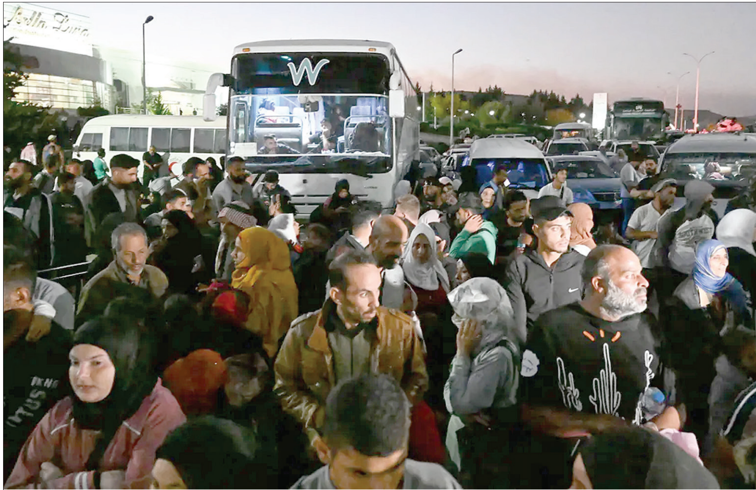
Gelombang pengungsi dari perbatasan Lebanon Selatan terus meningkat seiring eskalasi serangan militer Israel. Organisasi Internasional untuk Migrasi PBB (IOM) merilis data, ada sekitar 90.000 orang lebih mengungsi di Lebanon pasca serangan Israel yang disebut menarget Hizbullah. Menteri Luar Negeri Lebanon, Abdallah Bou Habib mengatakan pada Selasa (24/9/2024), jumlah pengungsi di Lebanon terus bertambah. Human Rights Watch memperingatkan pada Rabu 25 September 2024, eskalasi serangan Israel ke Lebanon telah menempatkan warga sipil dalam risiko besar.