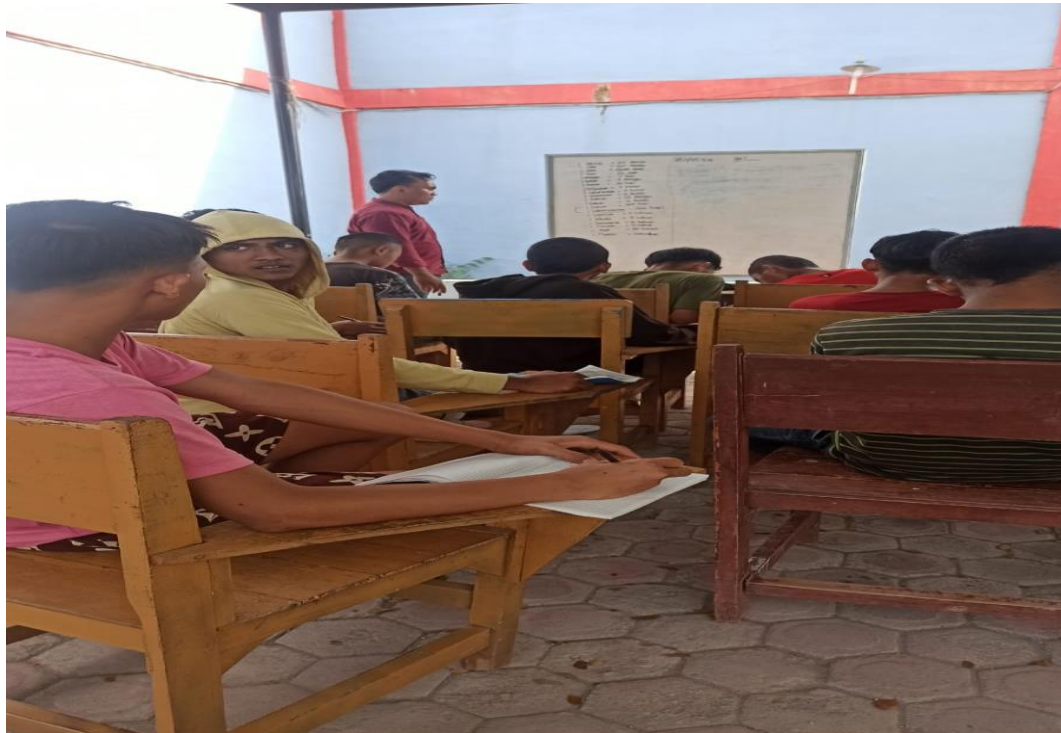
Gambar : Foto saat belajar teori life skill