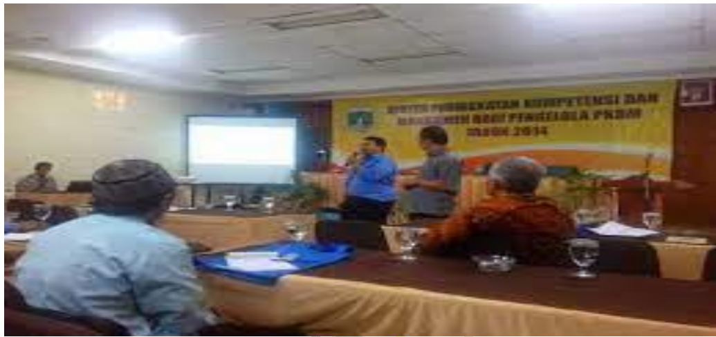
Gambar : Kunjungan Dinas Sosial Provinsi