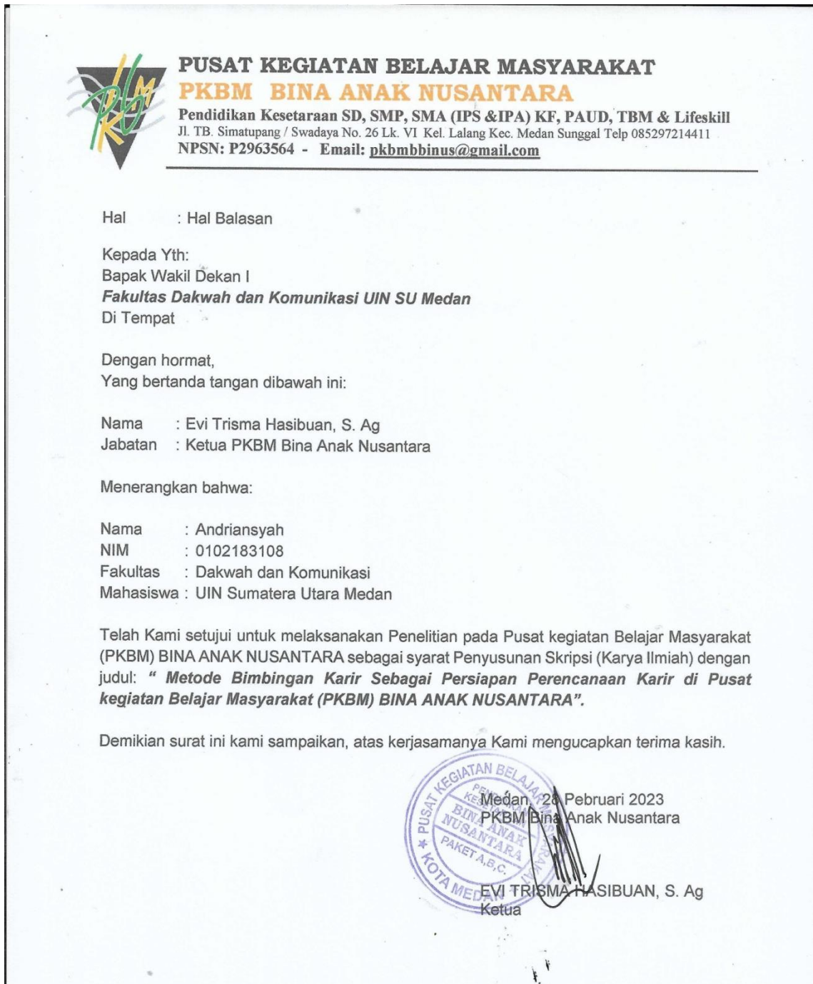
Gambar : Surat Izin Penelitian Dari PKBM