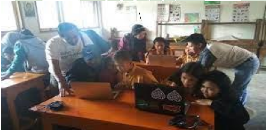
Gambar : Bimbingan Karir Bidang Komputer