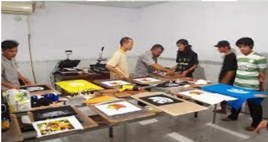
Gambar : Bimbingan Karir Sablon