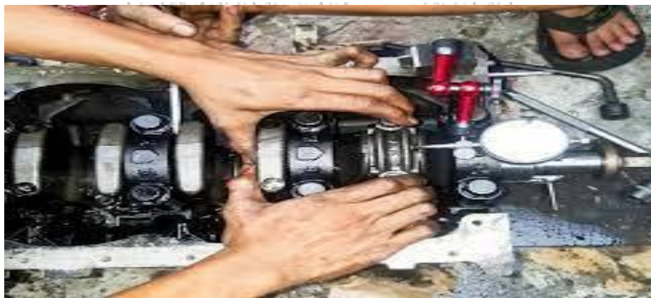
Gambar : Bimbingan Karir Mesin Diesel