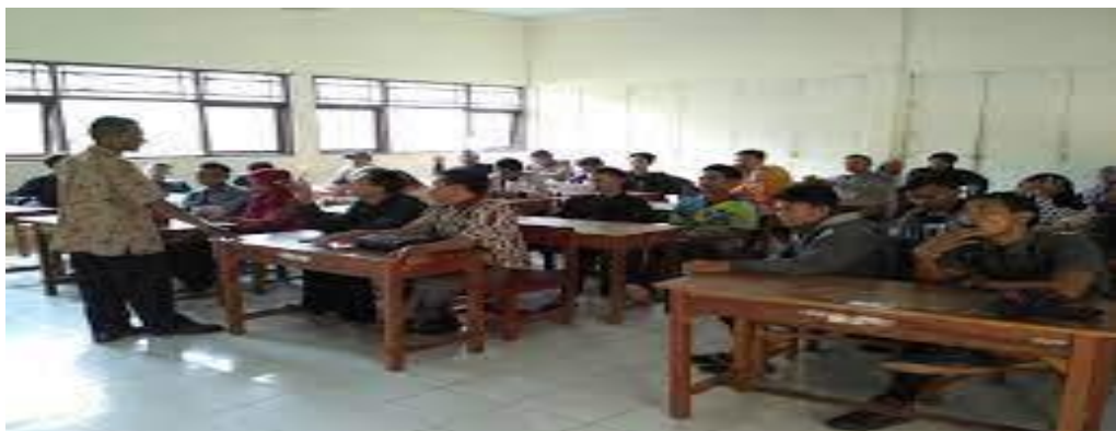
Gambar : Pelatihan Sablon dan cetak