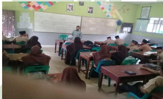
Ekstrakurikuler Tahsin Siswa Madrasah Aliyah Negeri Lima Puluh Batubara

UNIVERSITAS ISLAM NEGERI SUMATERA UTARA MEDAN