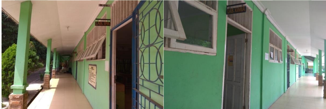
Laboratorium IPA Madrasah Aliyah Negeri Lima Puluh Batubara