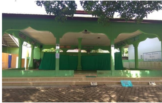
Musholla Madrasah Aliyah Negeri Lima Puluh Batubara