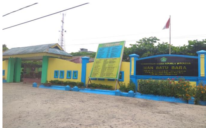
Halaman Depan Madrasah Aliyah Negeri Lima Puluh Batubara