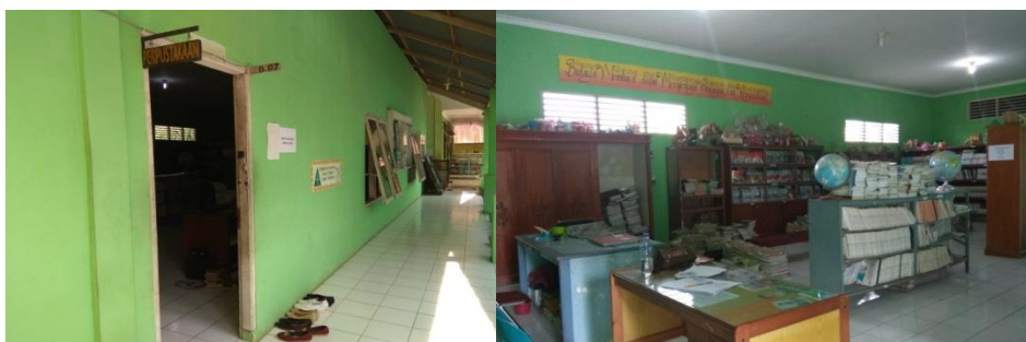
Perpustakaan Madrasah Aliyah Negeri Lima Puluh Batubara