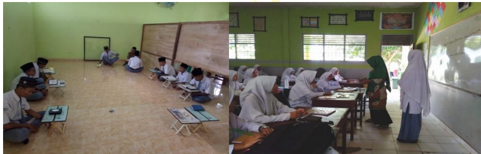
Ekstrakurikuler Tahfiz Putra/Putri Siswa Madrasah Aliyah Negeri Lima Puluh Batubara