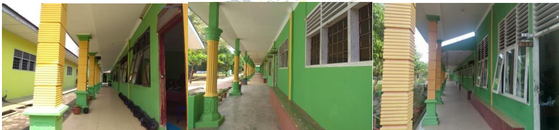
Kelas X, XI dan XII Madrasah Aliyah Negeri Lima Puluh Batubara