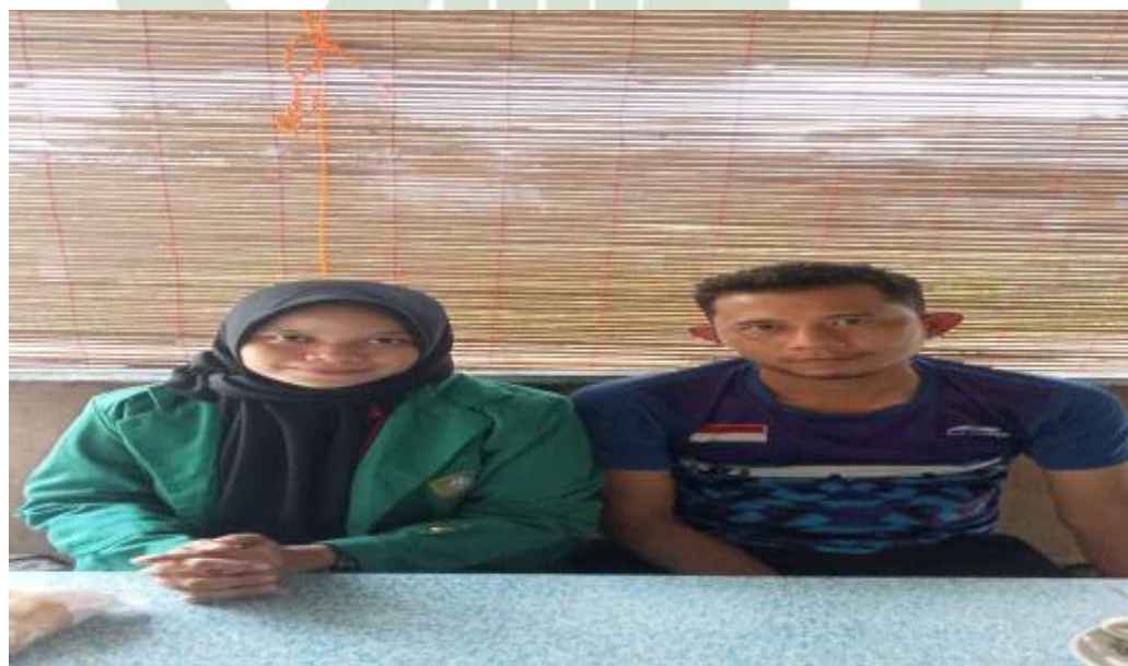
Gambar 5. Setelah Wawancara dengan Atlet Cabang Olahraga Tenis Meja