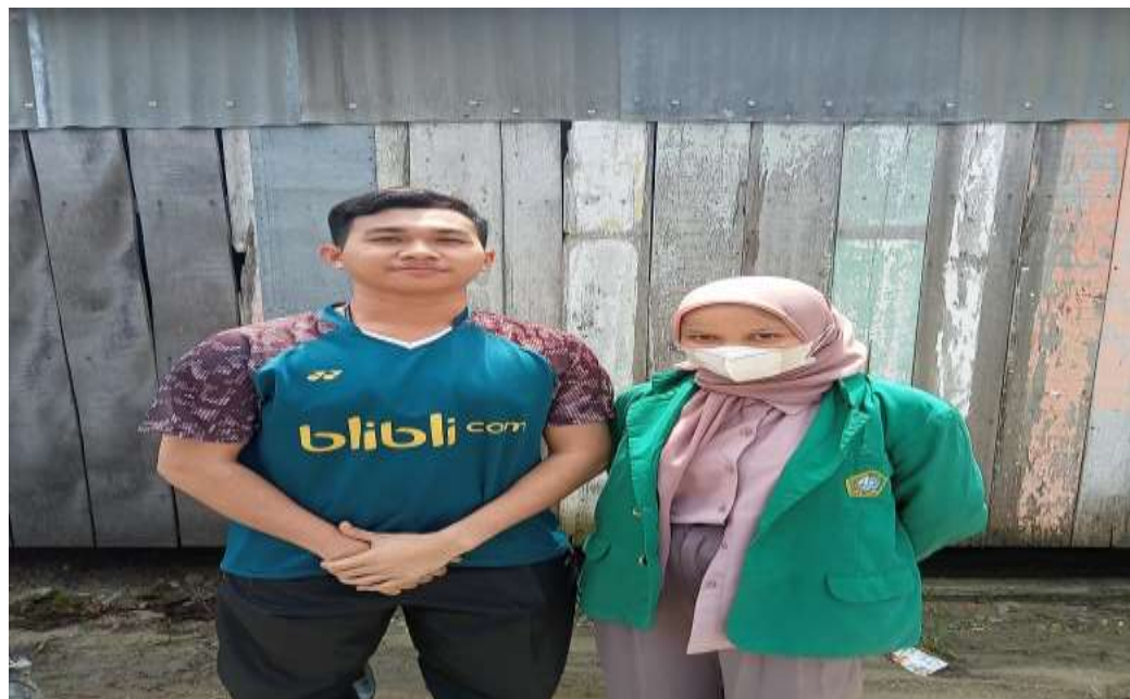
Gambar 6. Setelah Wawancara dengan Atlet Cabang Olahraga Bulu Tangkis