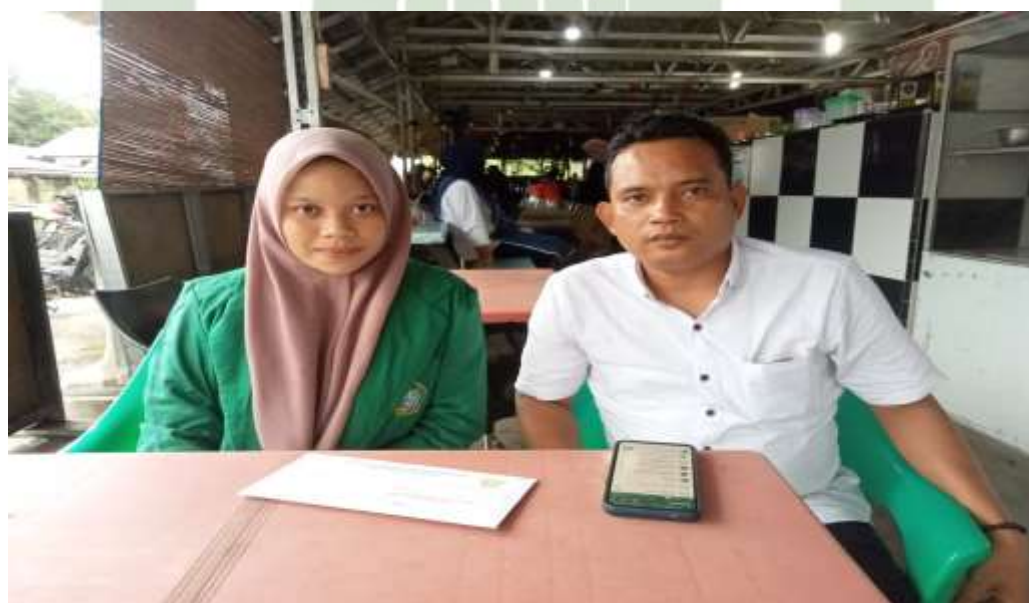
Gambar 3. Setelah Wawancara dengan Sekretaris KONI Kabupaten Labuhanbatu Selatan