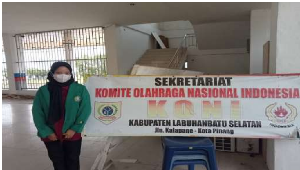
Gambar 2. KONI Kabupaten Labuhanbatu Selatan