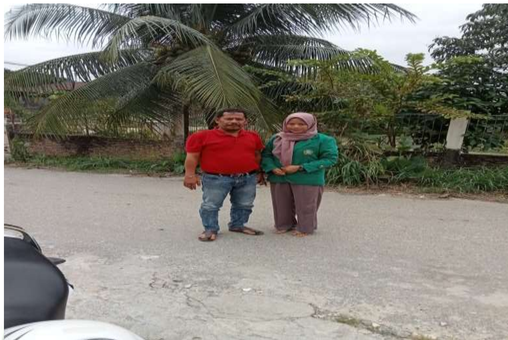
Gambar 4. Setelah Wawancara dengan Ketua PSSI Kabupaten Labuhanbatu Selatan