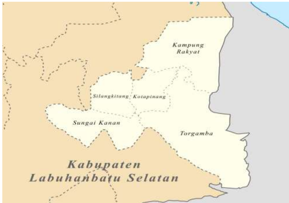
Gambar 1. Peta Kabupaten Labuhanbatu Selatan