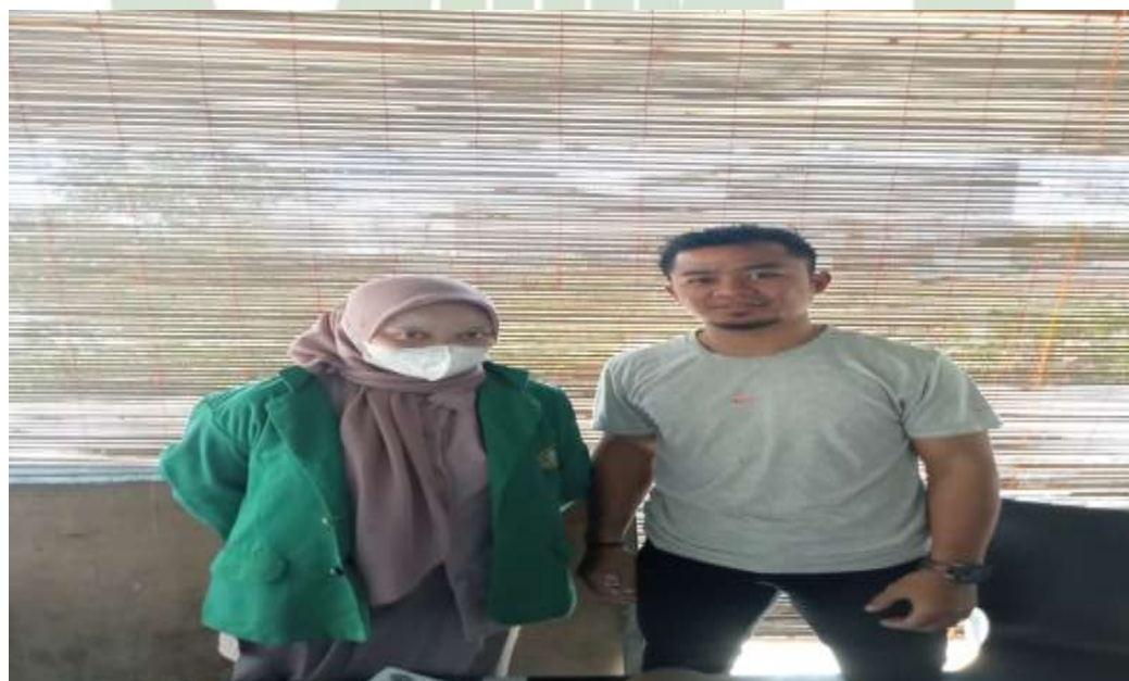
Gambar 7. Setelah Wawancara dengan Atlet Cabang Olahraga Tarung Derajat