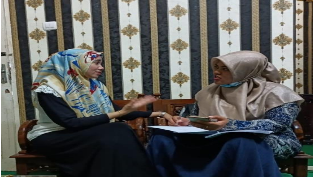
Gambar 5. Wawancara dengan Guru Bimbingan Konseling MTs Negeri 3 Langkat