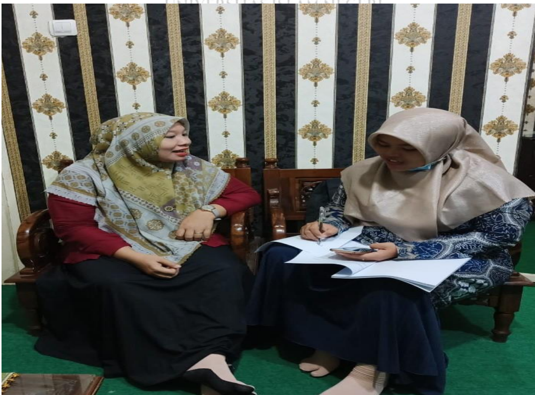
Gambar 4. Wawancara dengan Guru Bimbingan Konseling MTs Negeri 3 Langkat