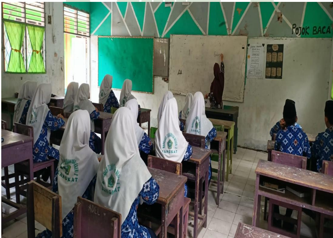
Gambar 7. Guru Bimbingan Konseling Memberikan Layanan Informasi secara Klasikal