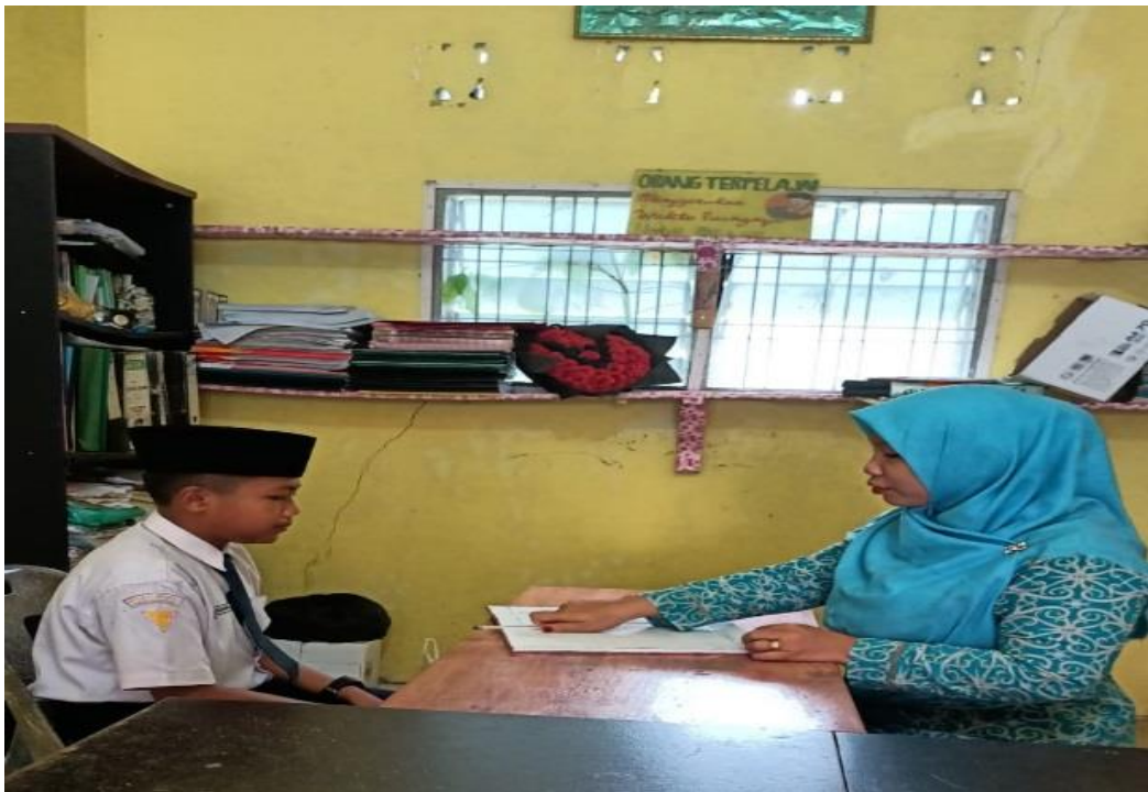
Gambar 11. Pemberian Layanan Bimbingan Konseling Secara Individu