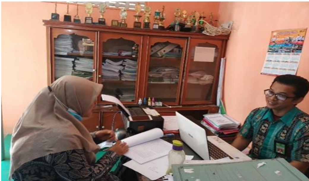
Gambar 2. Wawancara dengan Wakil Kepala Madrasah Tsanawiyah Negeri 3 Langkat