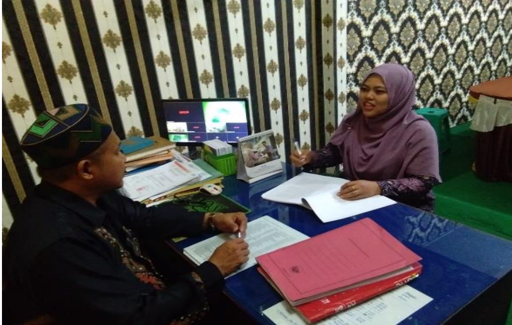
Gambar 1. Wawancara dengan Kepala Madrasah Tsanawiyah Negeri 3 Langkat