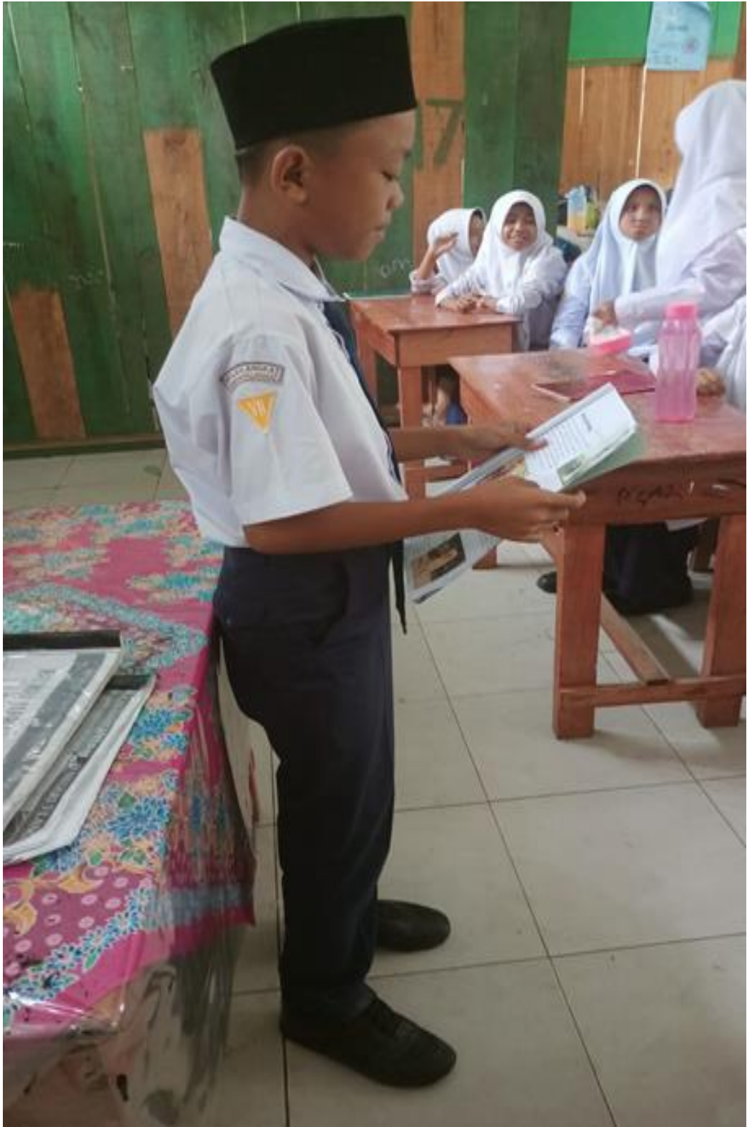
Gambar 10. Siswa sedang mempresentasikan tugas secara individu saat layanan informasi diberikan