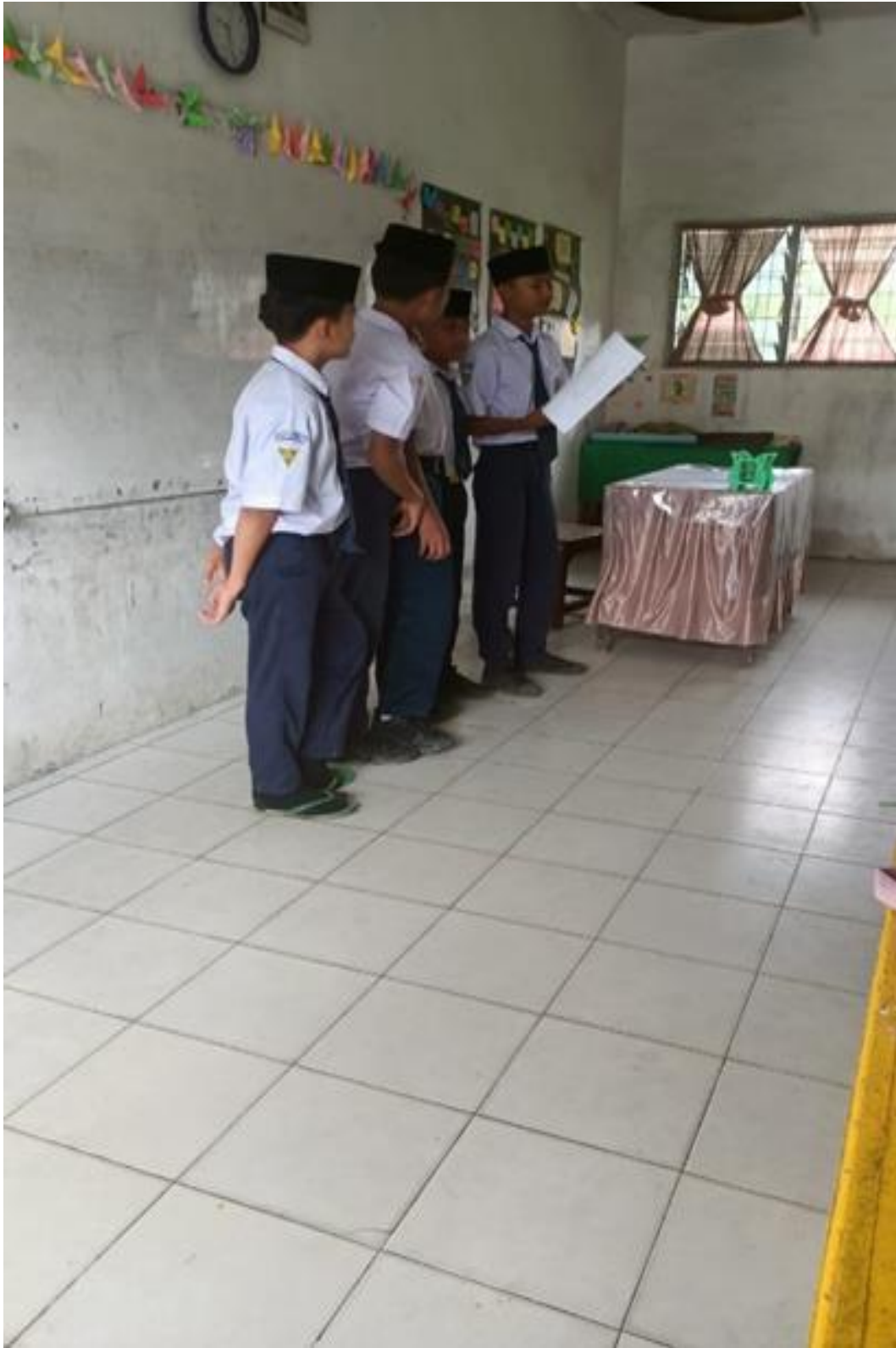
Gambar 9. Siswa Sedang Mempresentasikan Tugas Secara Kelompok Saat Layanan Klasikal Diberikan