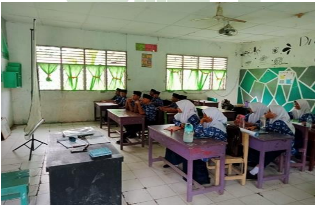
Gambar 8. Siswa Menonton Video Terkait Dengan Materi Yang Diberikan Guru BK