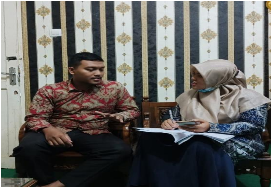
Gambar 3. Wawancara dengan Guru Bimbingan Konseling MTs Negeri 3 Langkat