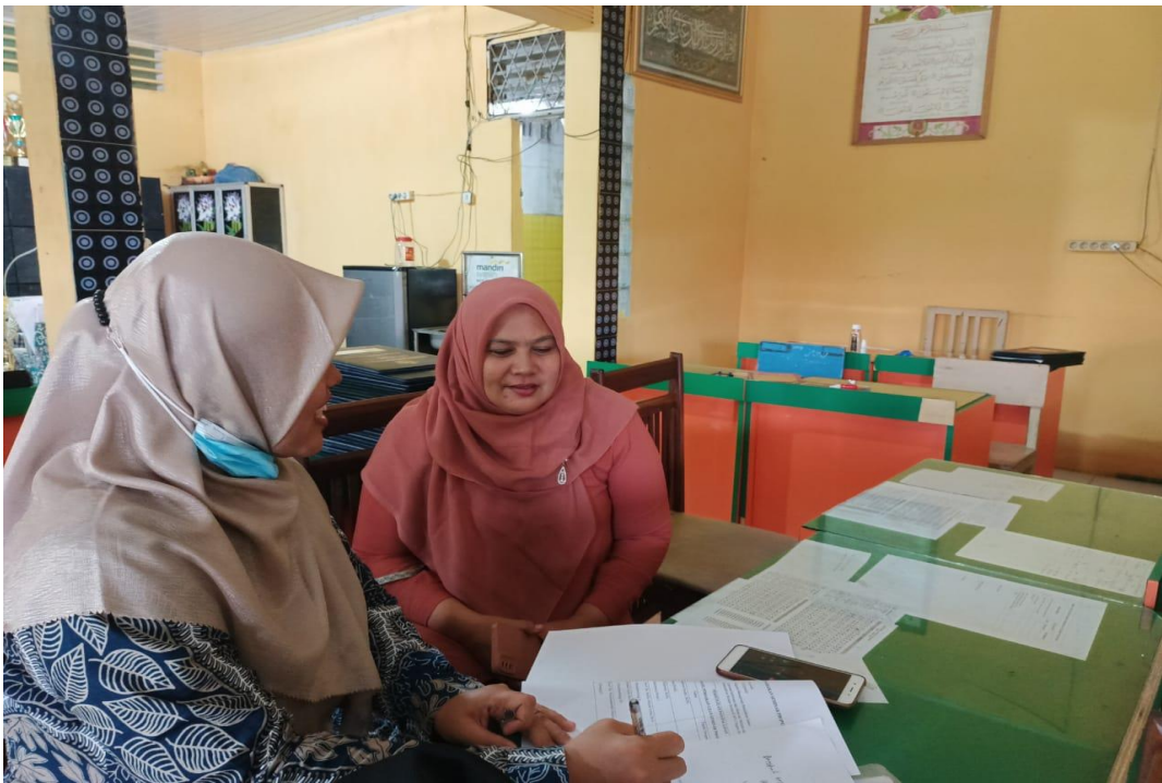
Gambar 6. Wawancara dengan Guru Bidang Studi Al-Quran Hadits MTs Negeri 3 Langkat