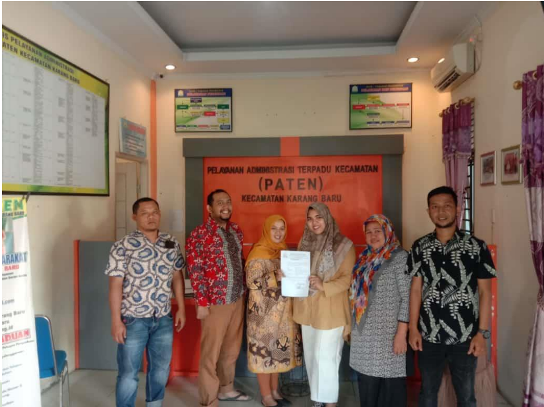
Tabel 2: Wawancara dengan Camat dan jajarannya

UNIVERSITAS ISLAM NEGERI SUMATERA UTARA MEDAN