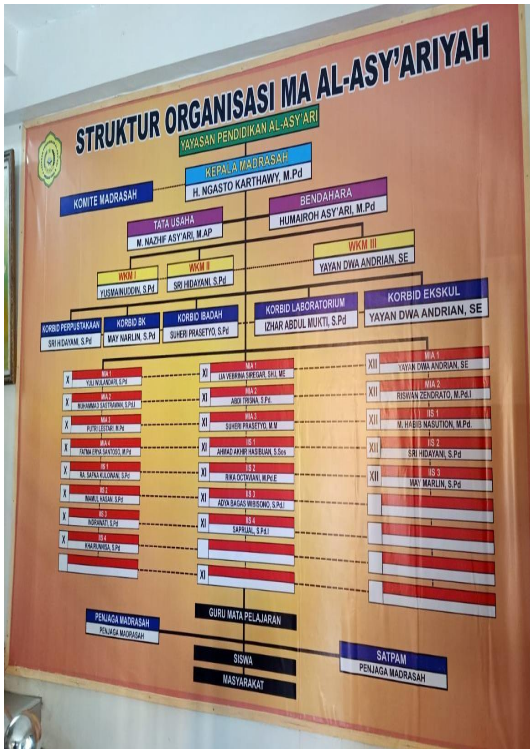
Gambar 4.2: Struktur Organisasi Perpustakaan MAS Al-Asy'ariyah Medan Krio