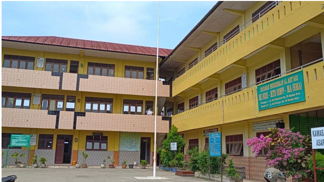
Gambar 4.1: Sejarah Singkat MAS Al-Asy'ariyah Medan Krio