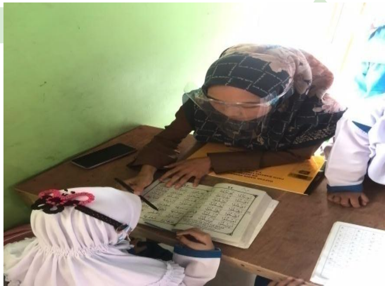
Anak sedang mengaji