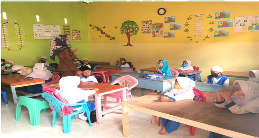
Anak berdoa sebelum belajar