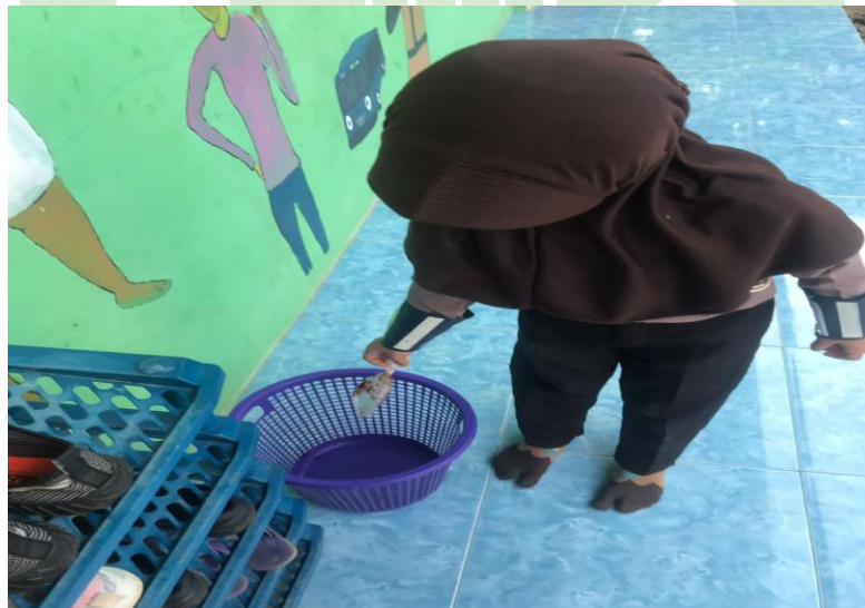
Anak sedang membuang sampah