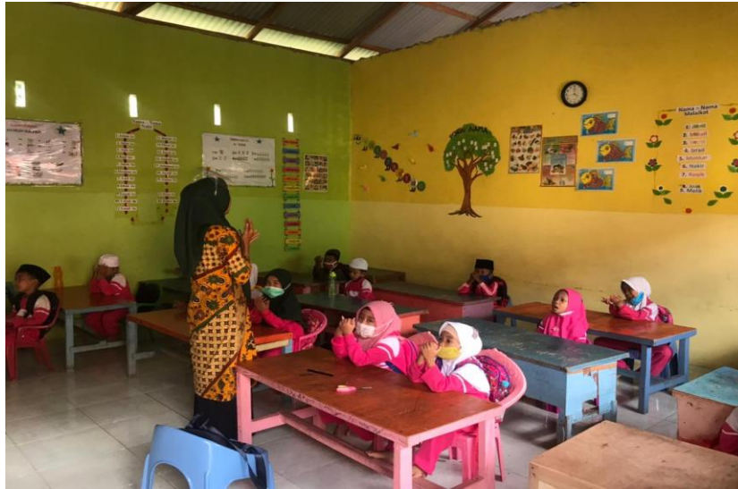
Anak berdoa saat mau pulang sekolah