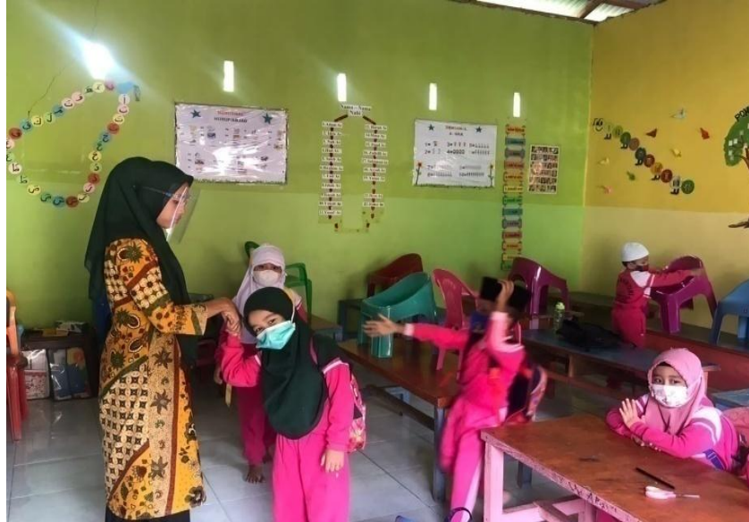
Anak bersalaman saat pulang sekolah