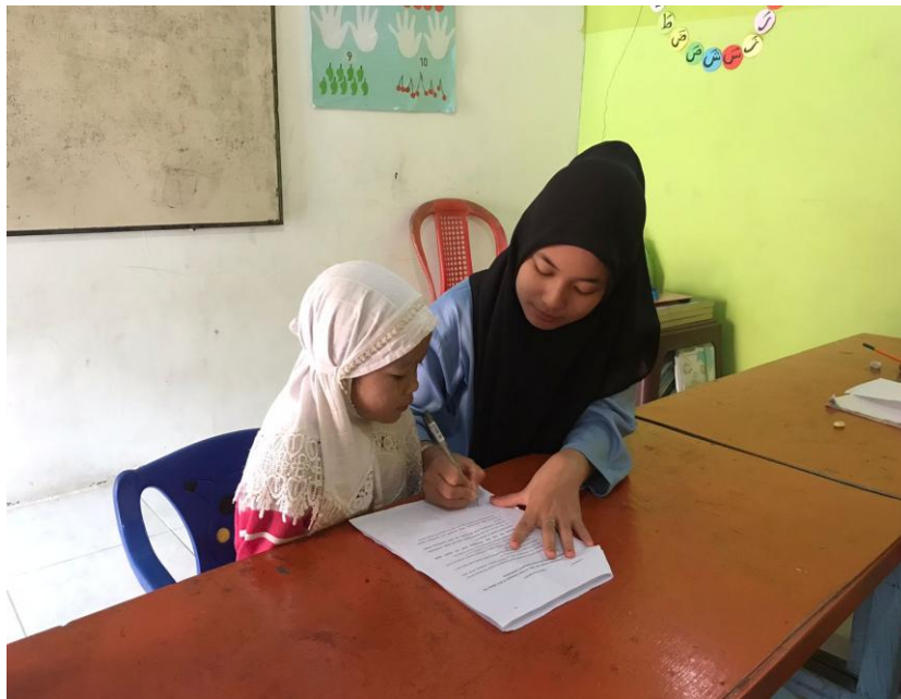
Mengajari anak membaca