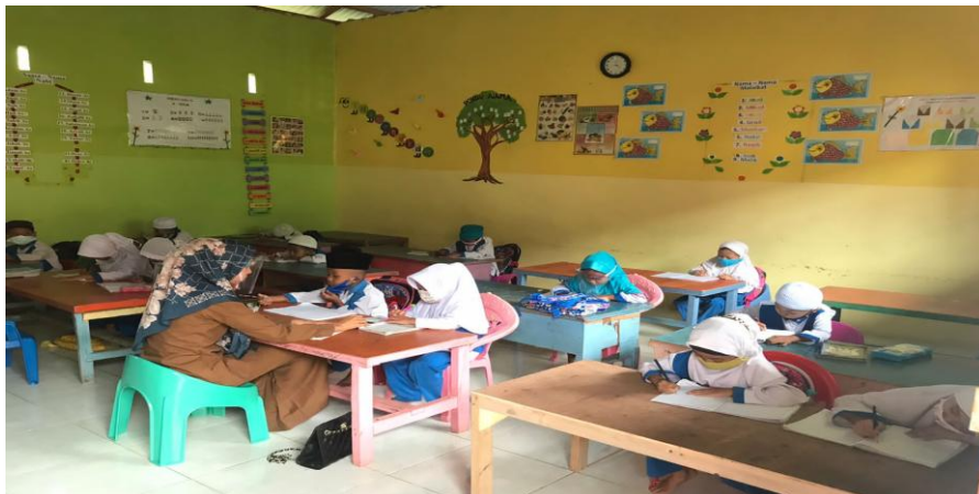
Anak sedang belajar