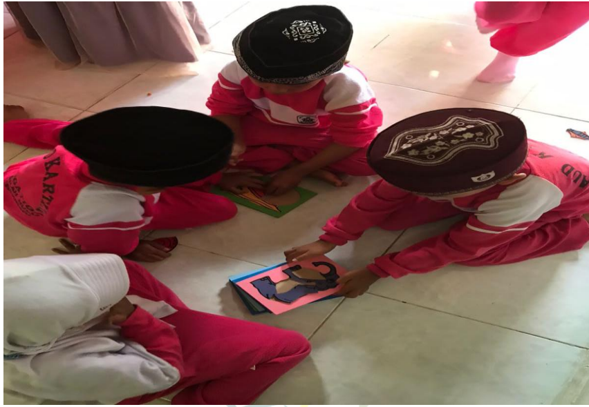
Anak sedang merapikan mainan