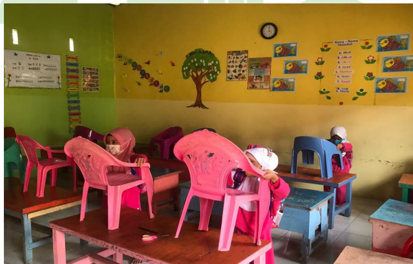
Anak mengangkat bangku saat pulang sekolah