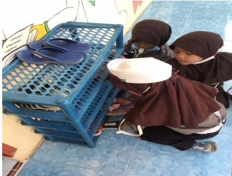
Anak sedang meletakkan sepatu di rak