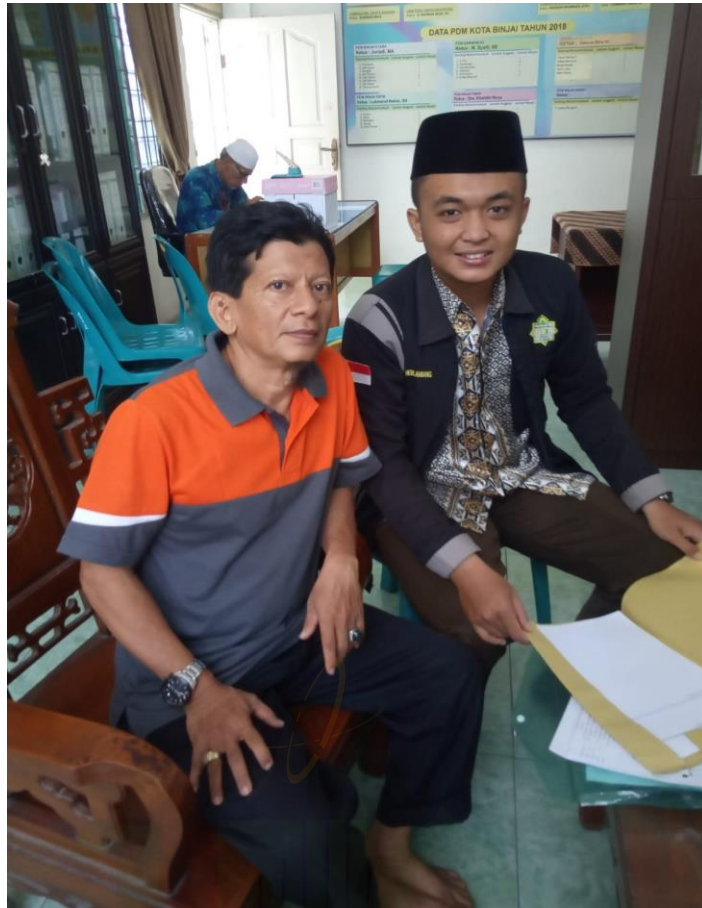
Gambar 6. Pertemuan Wawancara Bersama Jama'ah Muhammadiyah mengenai Strategi Dakwah Dalam Konsep Pembinaan Keluarga Sakinah