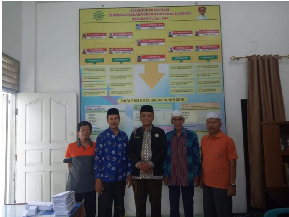
Gambar 2. Foto Bersama Pengurus Pimpinan Daerah Muhammadiyah Kota Binjai