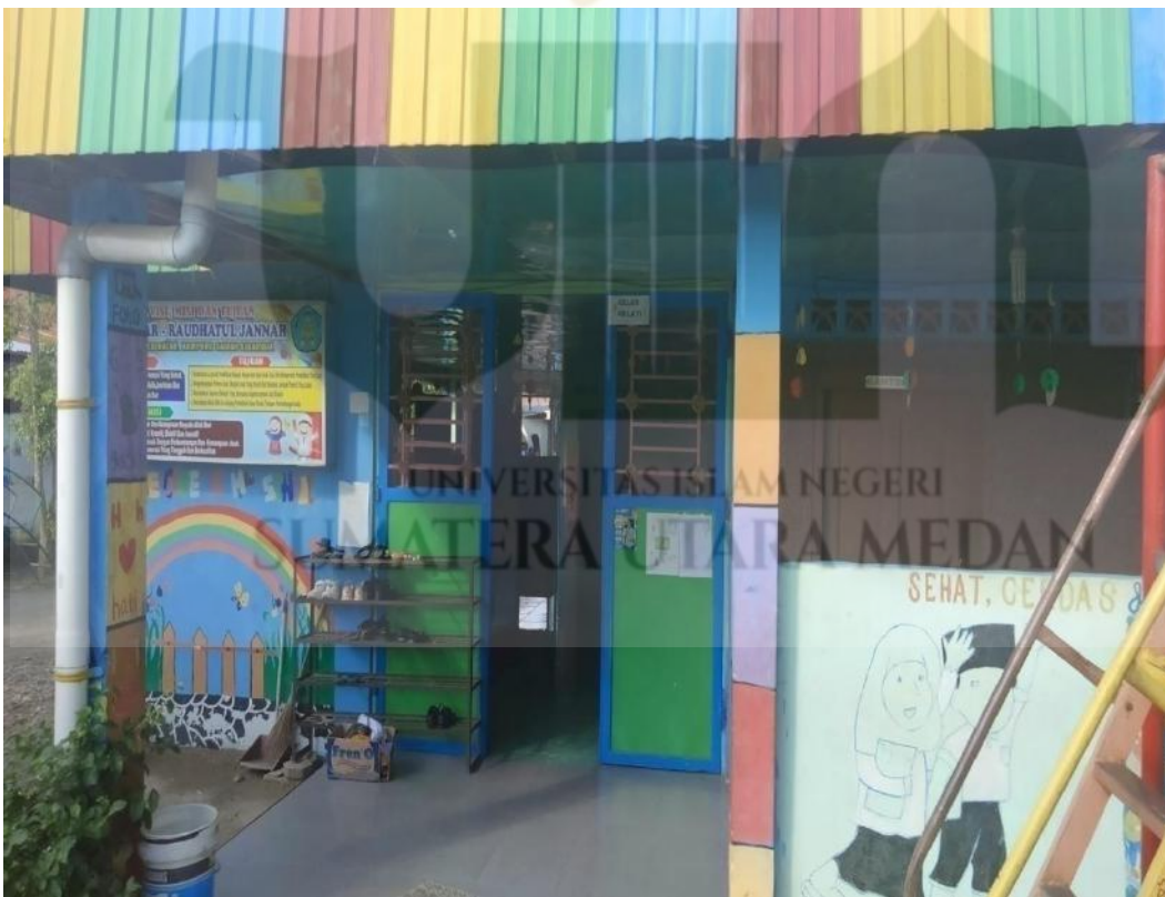
B. Foto Visi Misi dan Tujuan Sekolah