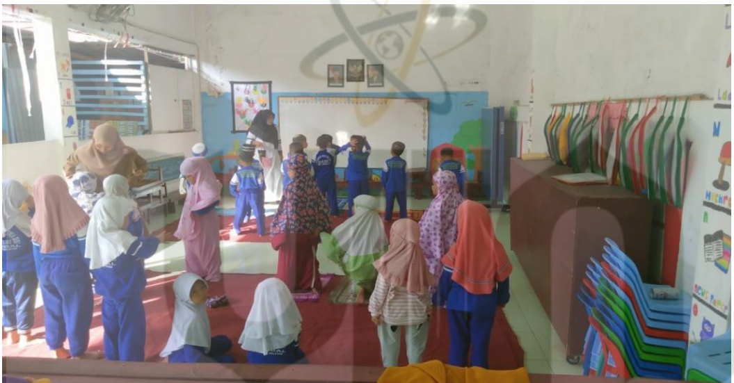
F. Foto Bersama Guru dan Siswa