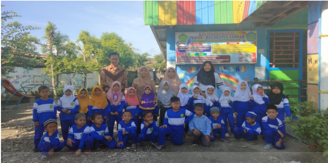
G. Gambar Wawancara