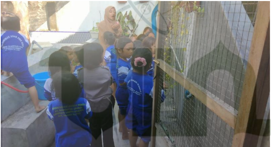
D. Foto Keadaan Kelas

UNIVERSITAS ISLAM NEGERI SUMATERA UTARA MEDAN