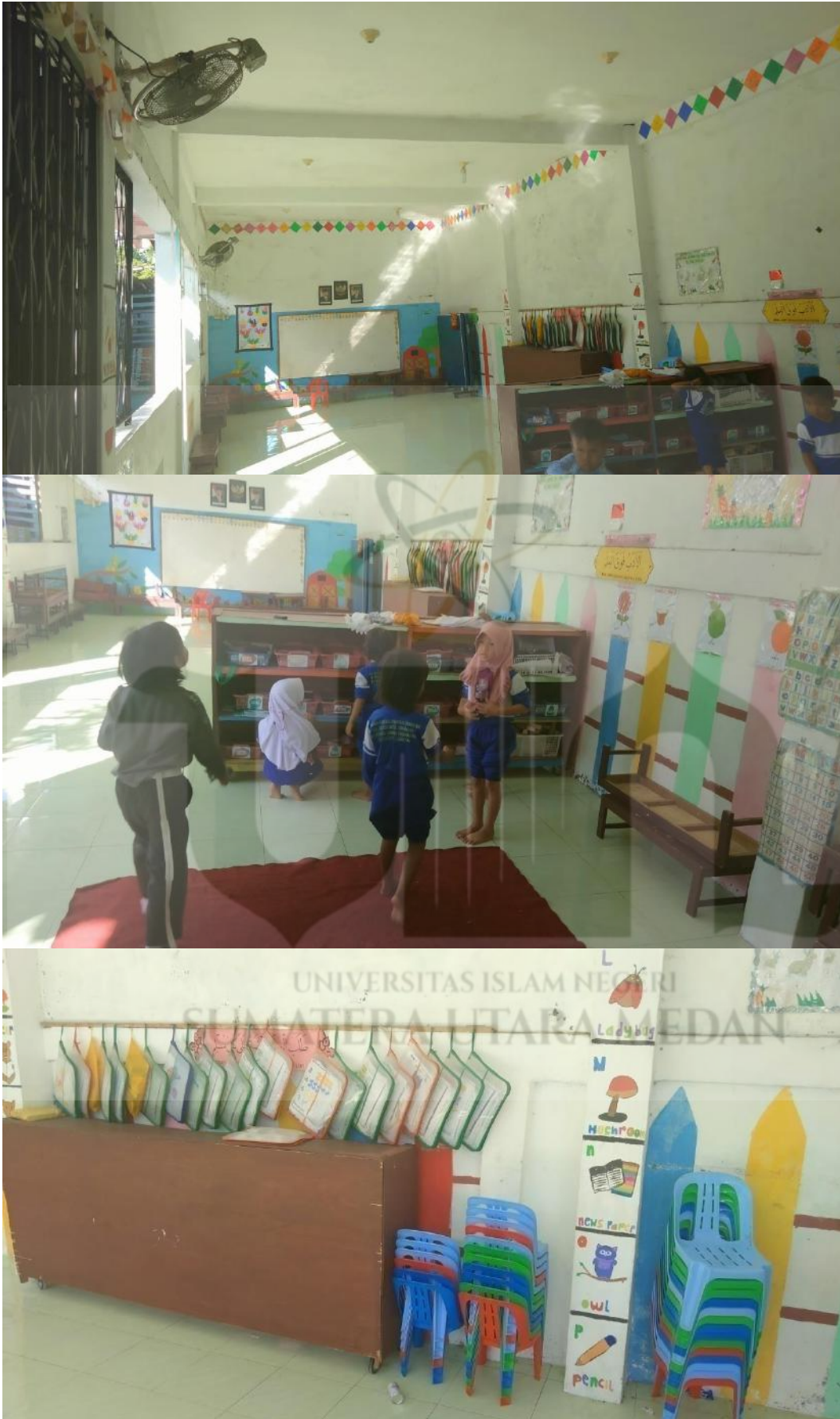
E. Foto Siswa Praktek Sholat