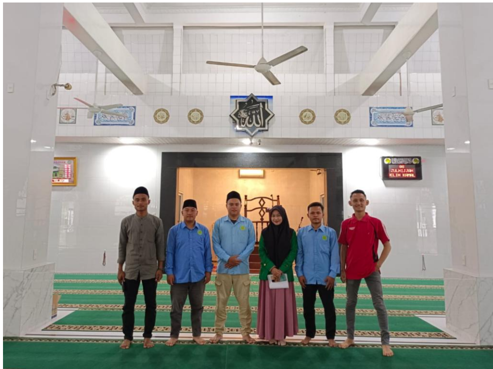
Gambar 3 Foto Bersama Pengurus BKPRMI