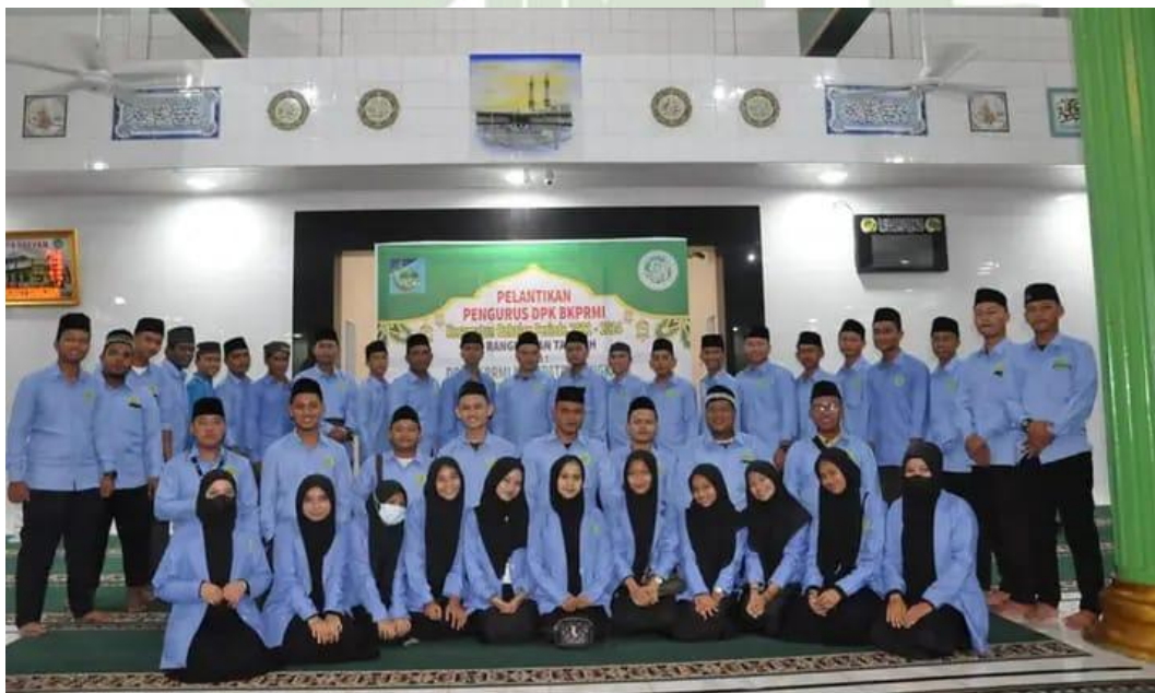
Gambar 4 Pengurus dan Anggota BKPRMI Kecamatan Babalan