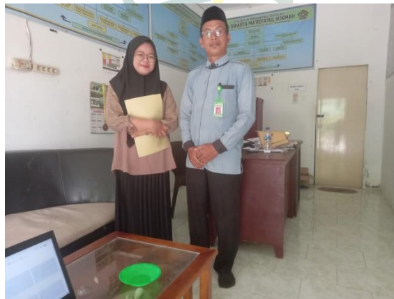
Foto Bersama Bapak Kepala Sekolah

UNIVERSITAS ISLAM NEGERI SUMATERA UTARA MEDAN