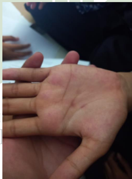
Santriwati yang mengalami scabies