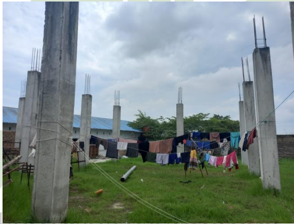
Tempat Jemur Baju Santriwati