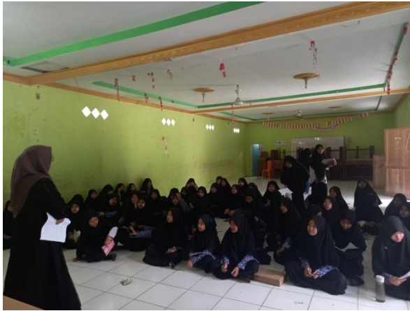
Pembagian dan Pengisian Kuisisioner