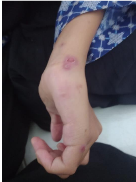
Santriwati yang mengalami scabies