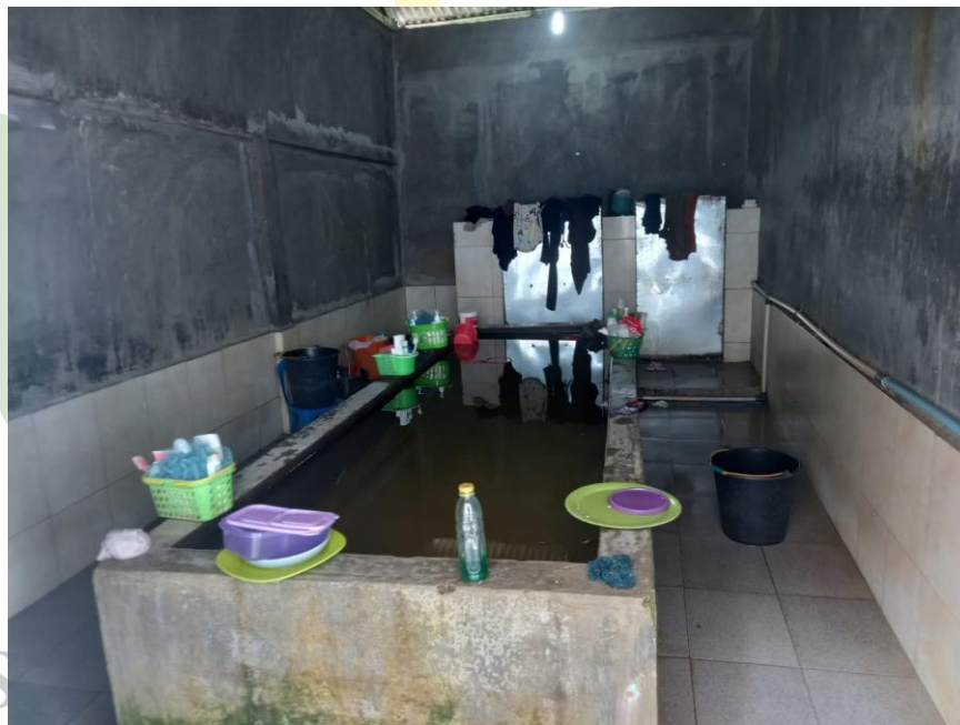
Sarana Air Bersih di Ponpes (Kamar Mandi Santriwati)