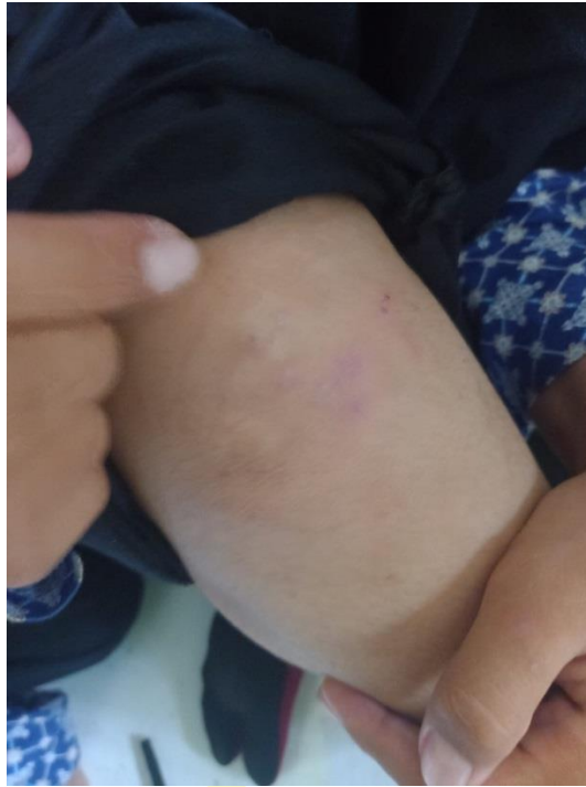
Santriwati yang mengalami scabies