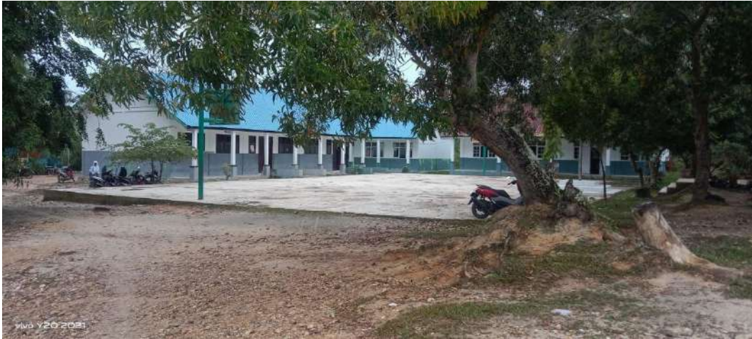
Gambar 5. Kondisi fisik SMA Negeri 1 Sei Lapan