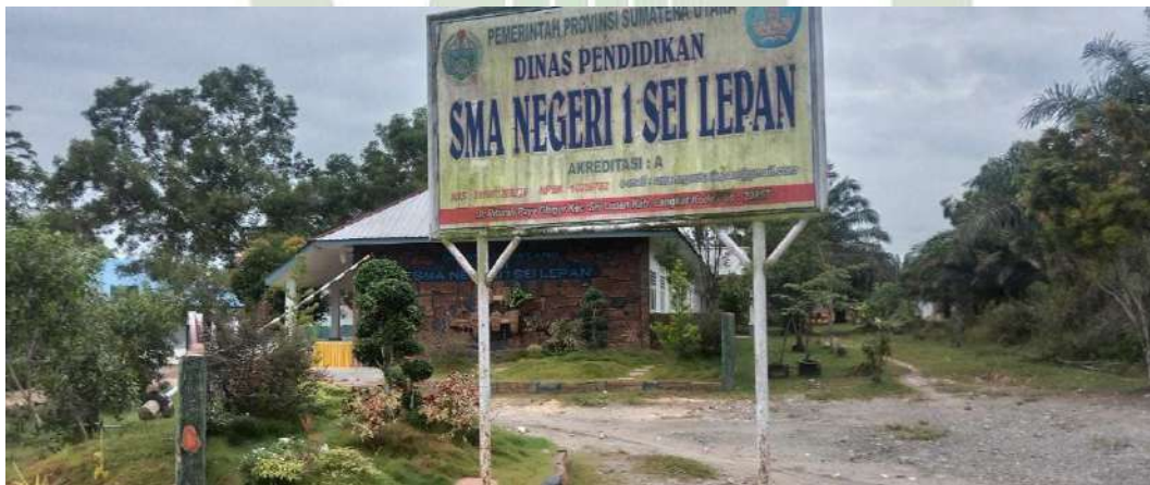
Gambar 4. Pintu masuk SMA Negeri 1 Sei Lapan