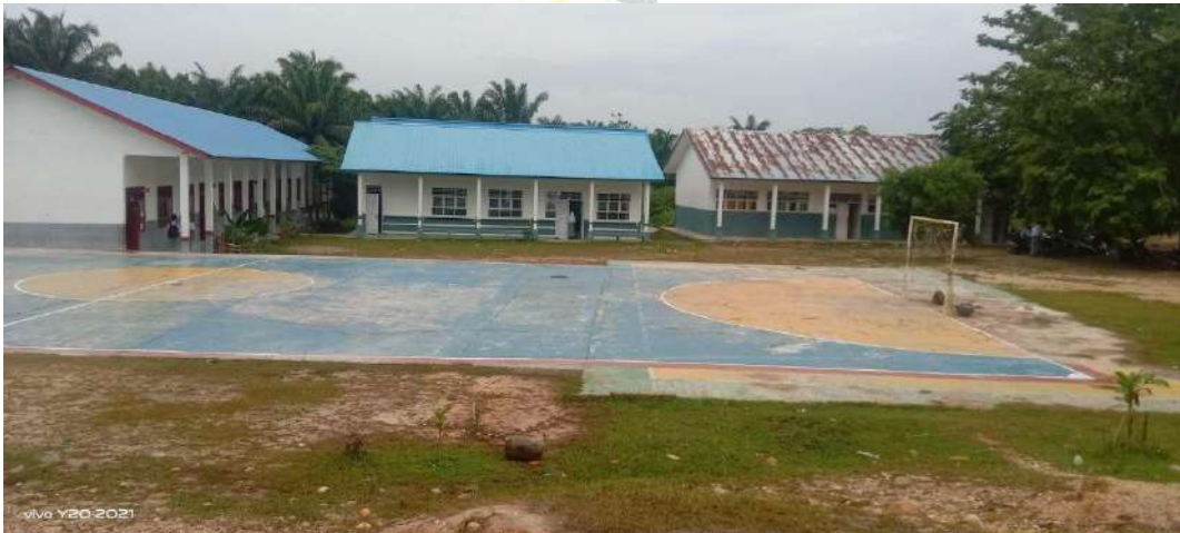
Gambar 6. Lapangan Futsal SMA Negeri 1 Sei Lapan