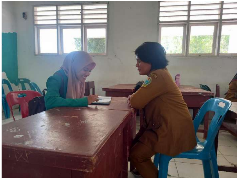
Gambar 2. Wawancara dengan Guru SMA Negeri 1 Sei Lapan