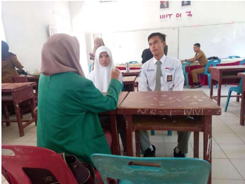
Gambar 3. Wawancara dengan Siswa/i SMA Negeri 1 Sei Lapan