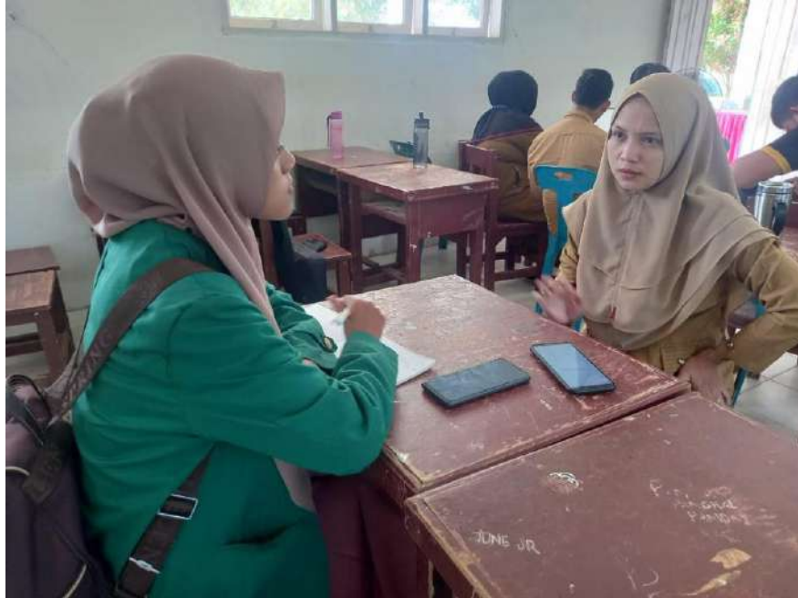
Gambar 1. Wawancara dengan ibu Sekretaris pelaksana PPD SMA Negeri 1 Sei Lapan UNIVERSITAS ISLAM NEGERI