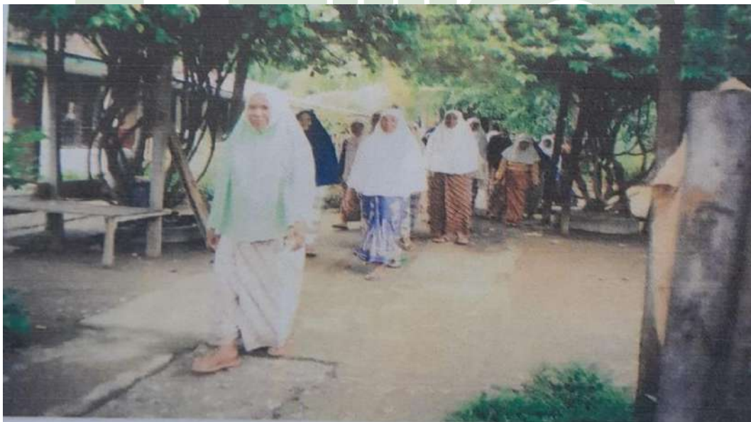
Latihan sport, berjalan kaki mengelilingi yayasan