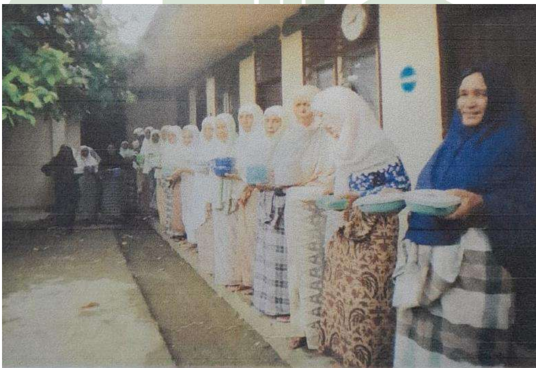
Persiapan siang hari untuk makan, dan sholat dzuhur