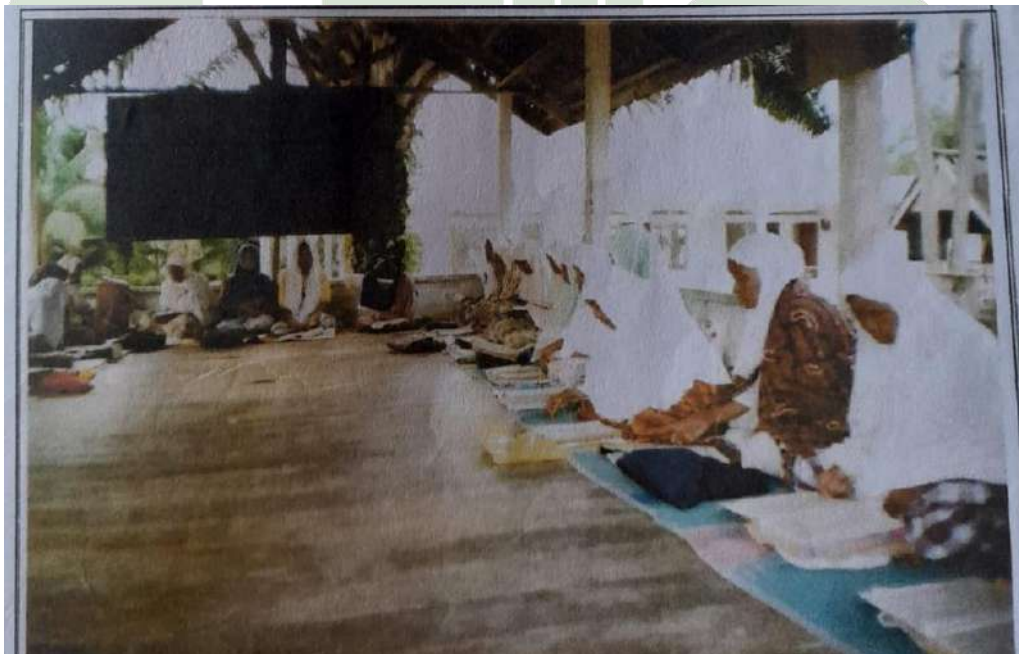
Bimbingan dari ustad/pengasuh