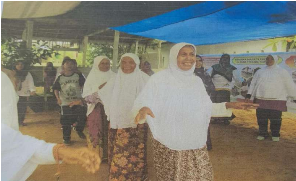
Kegiatan Olahraga (senam pagi)