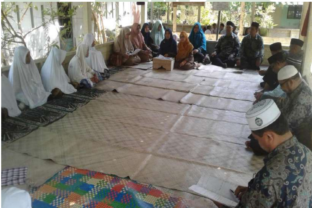
Pembinaan Penyuluh Agama Islam Di Panti Jompo Alhuda Syuhada Cot pliang