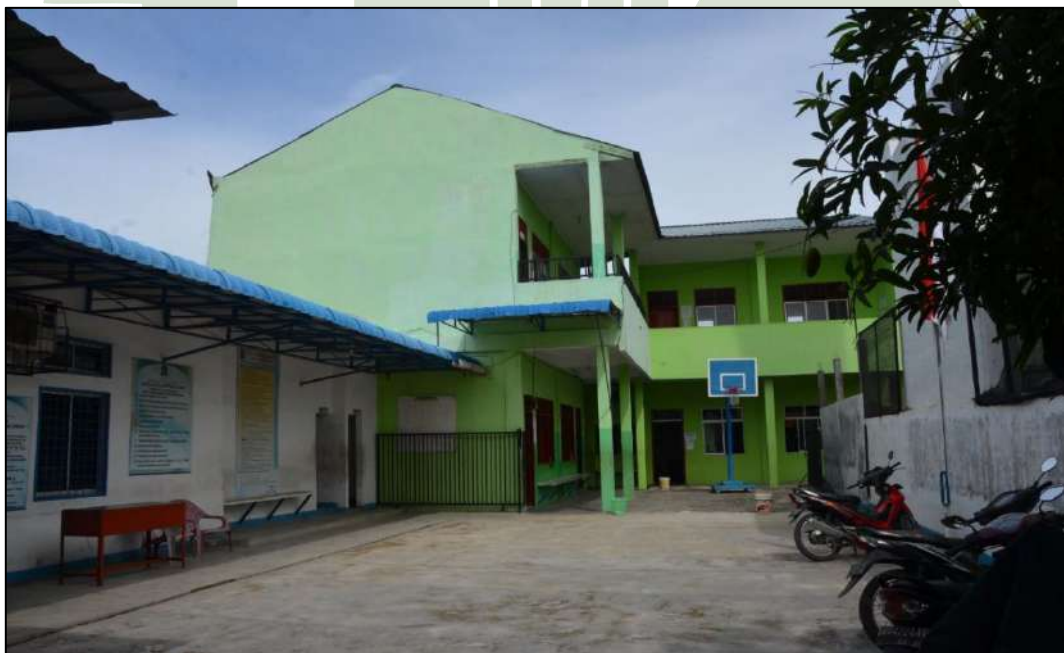
Gambar10. Halaman dan Gedung MTs. Swasta Al-Jihad Kota Medan