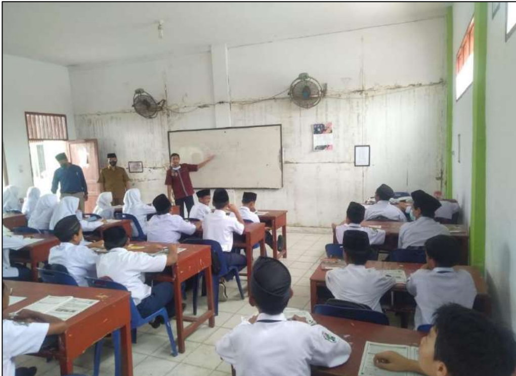
Gambar 15. Ruang Kelas MTs. Swasta Al-Jihad Kota Medan