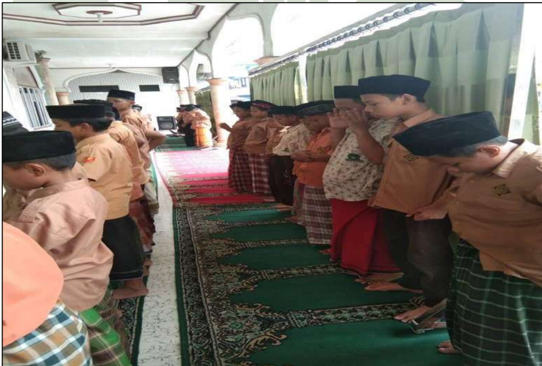
Gambar 22. Kegiatan ROHIS MTs. Swasta Al-Jihad Kota Medan