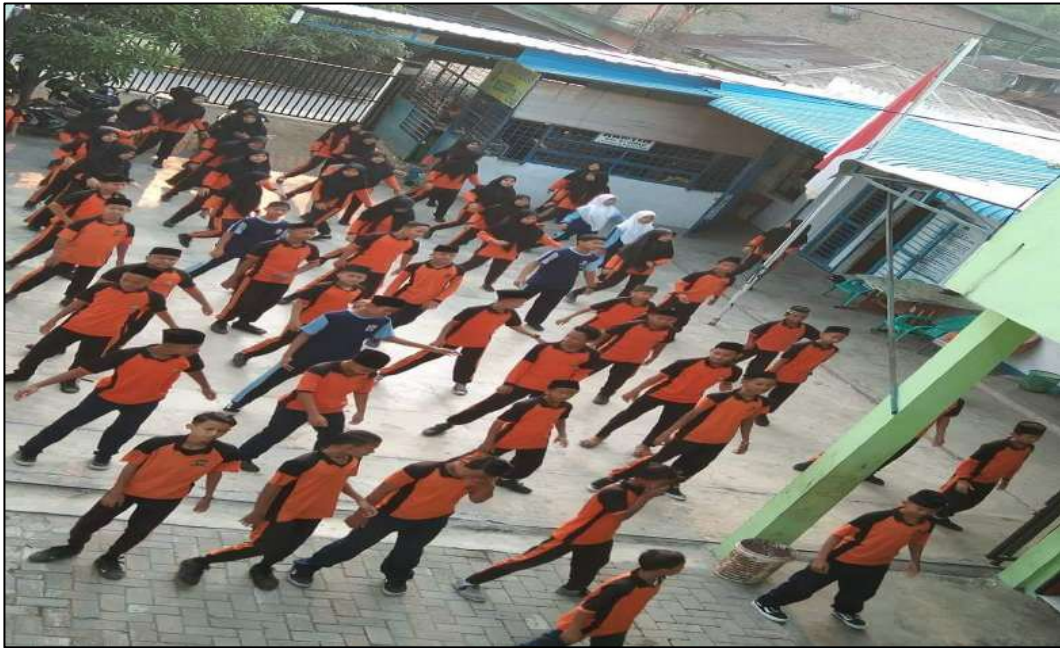
Gambar 21. Kegiatan Olahraga MTs. Swasta Al-Jihad Kota Medan