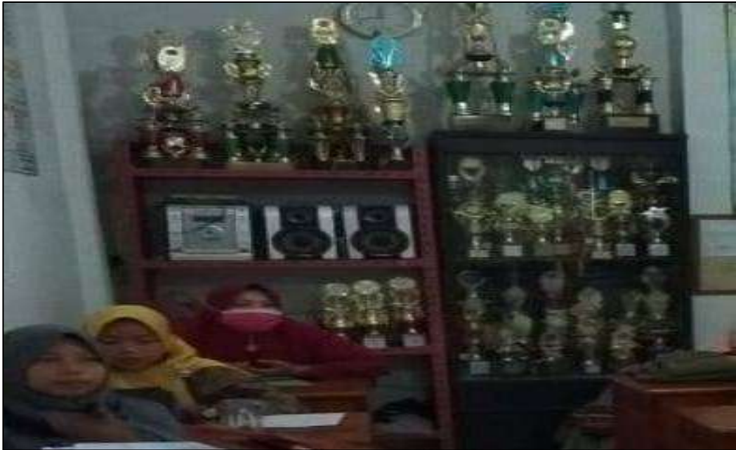
Gambar 17. Lemari Piala MTs. Swasta Al-Jihad Kota Medan