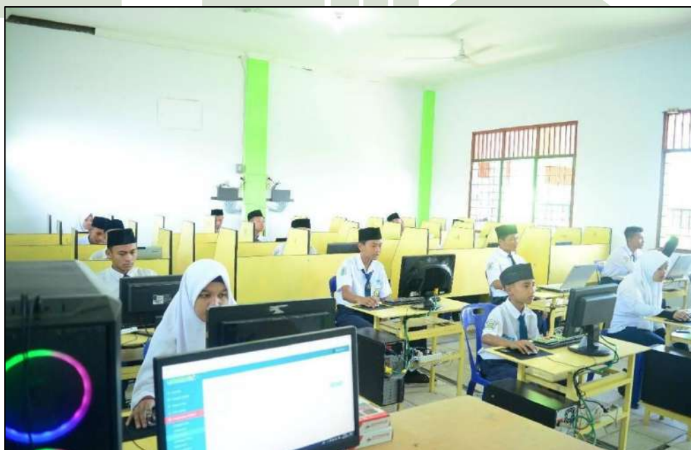
Gambar 14. Lab. Komputer MTs. Swasta Al-Jihad Kota Medan