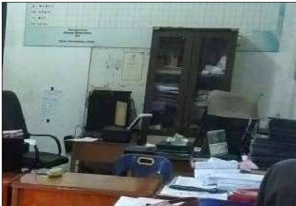
Gambar 13. Ruang Kepala Madrasah MTs. Swasta Al-Jihad Kota Medan