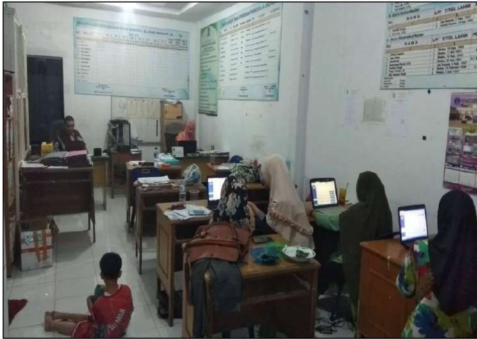
Gambar 25. Ruang Guru MTs. Swasta Al-Jihad Kota Medan