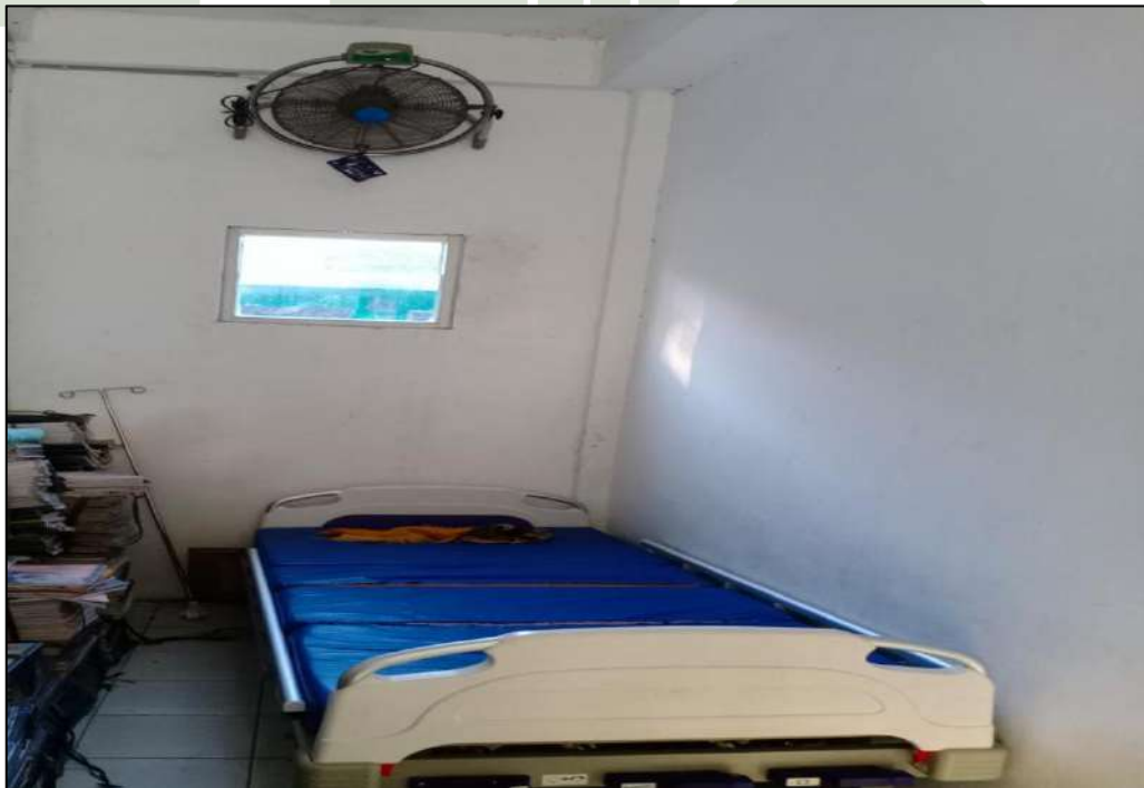
Gambar12. Ruang UKS MTs. Swasta Al-Jihad Kota Medan