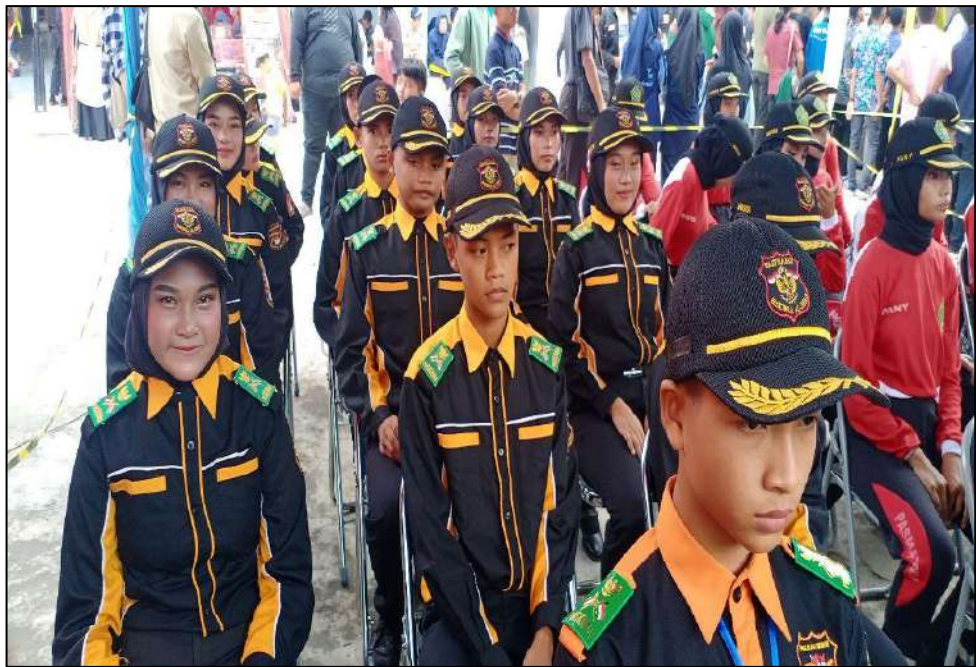
Gambar 23. Kegiatan PMR MTs. Swasta Al-Jihad Kota Medan