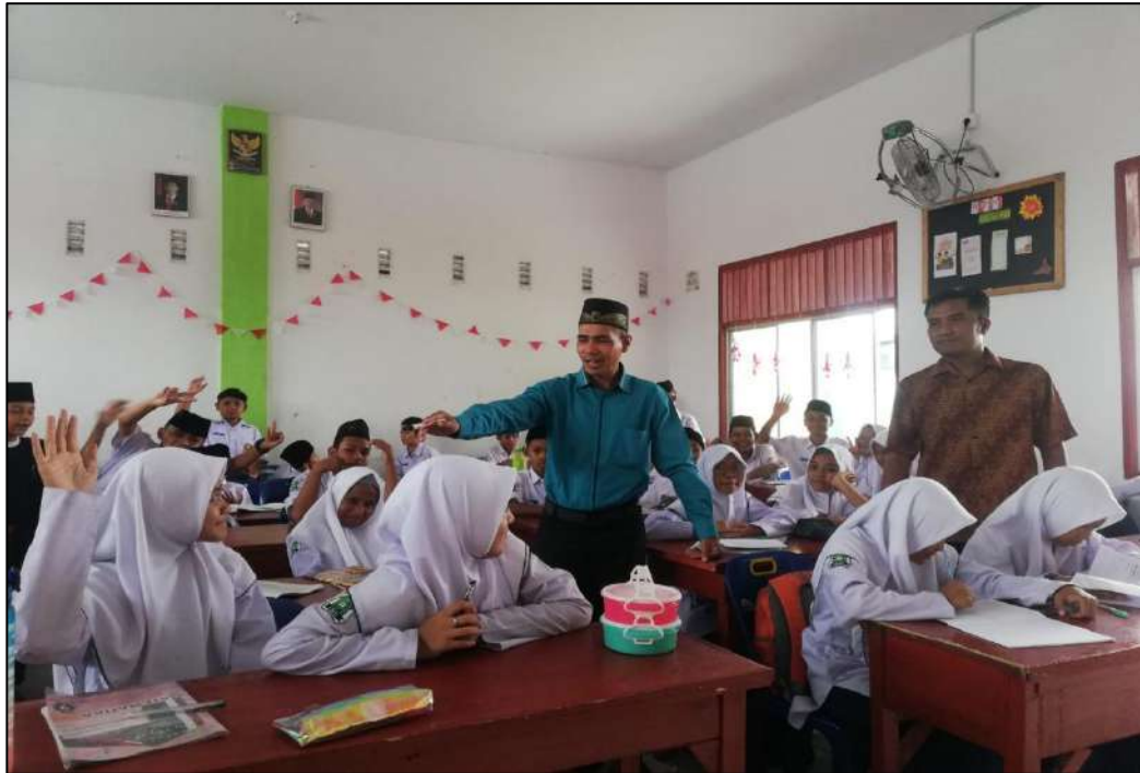
Gambar 3. Kegiatan Belajar di Kelas MTs. Swasta Al-Jihad Kota Medan