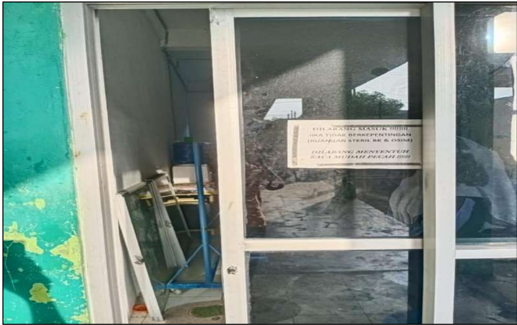
Gambar 11. Ruang Bimbingan Konseling MTs. Swasta Al-Jihad Kota Medan