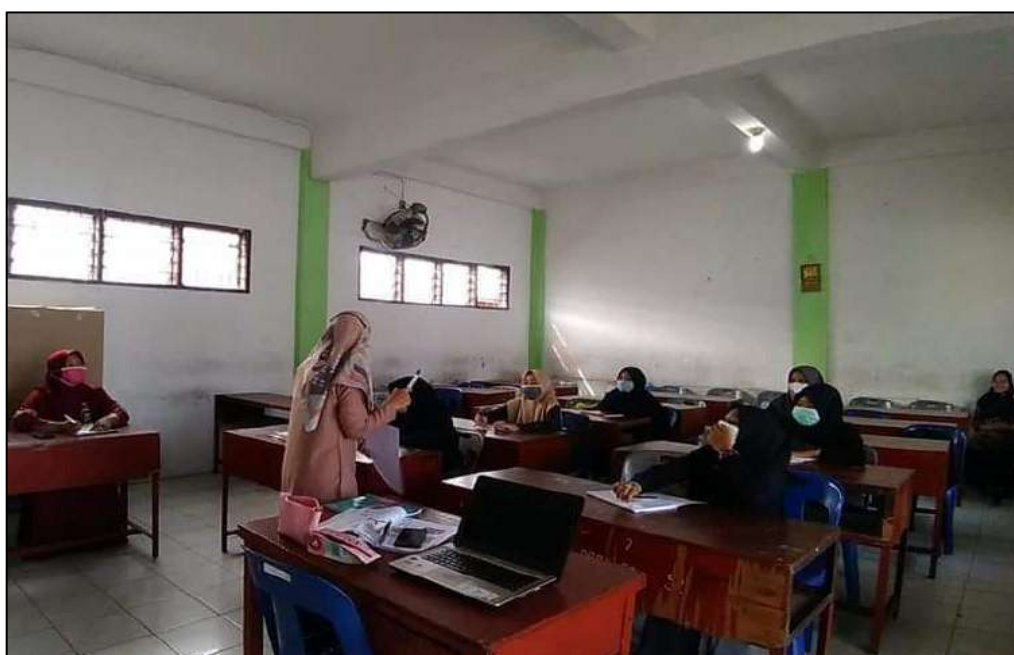
Gambar 19. Kegiatan Workshop MTs. Swasta Al-Jihad Kota Medan