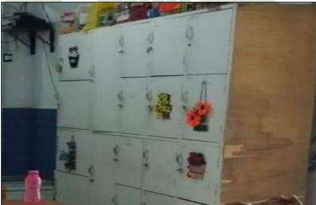
Gambar 18. Lemari Berkas MTs. Swasta Al-Jihad Kota Medan