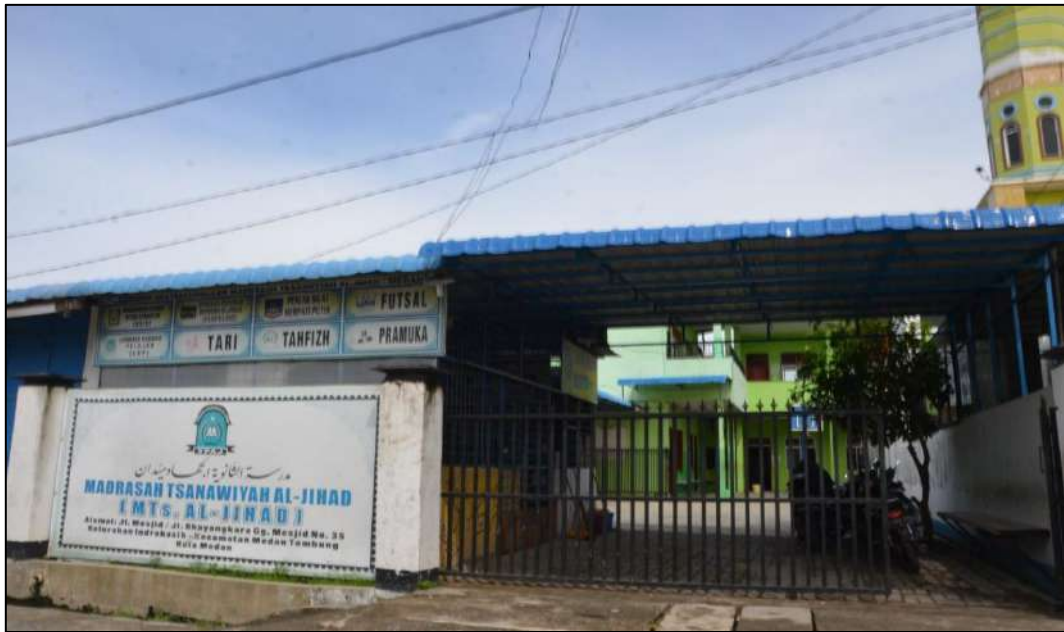
Gambar 9. Plank MTs. Swasta Al-Jihad Kota Medan