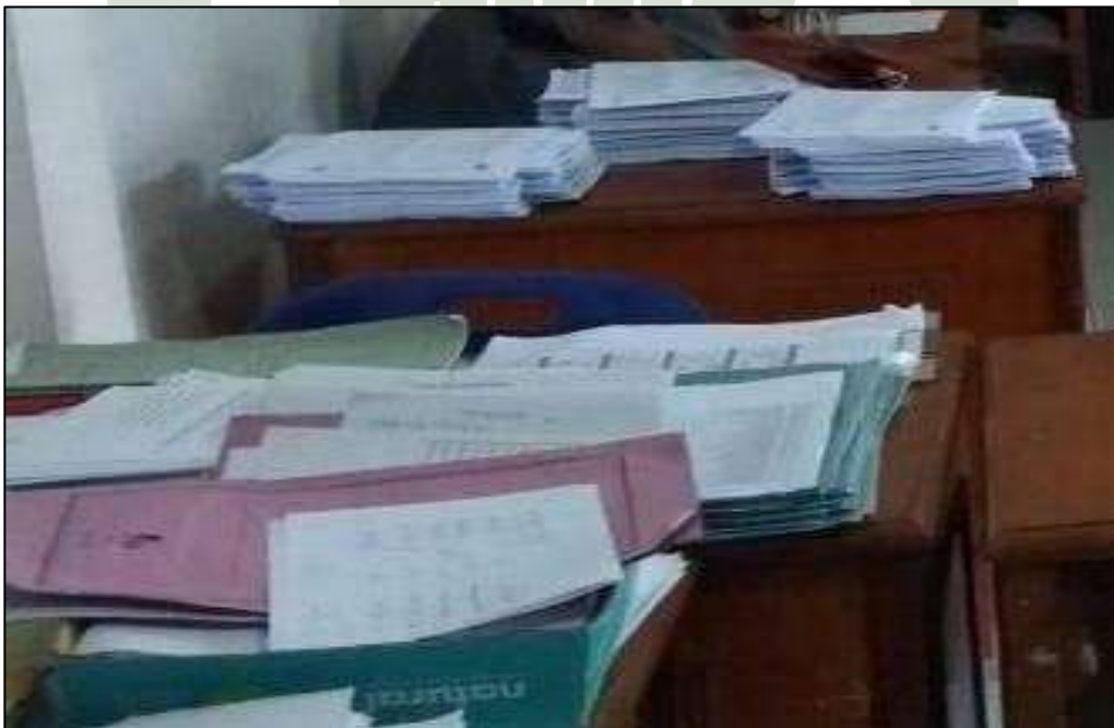
Gambar 16. Berkas Kurikulum MTs. Swasta Al-Jihad Kota Medan