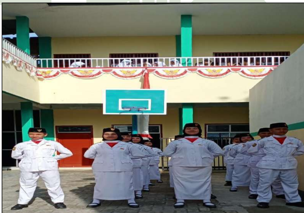
Gambar 20. Kegiatan Paskibra MTs. Swasta Al-Jihad Kota Medan