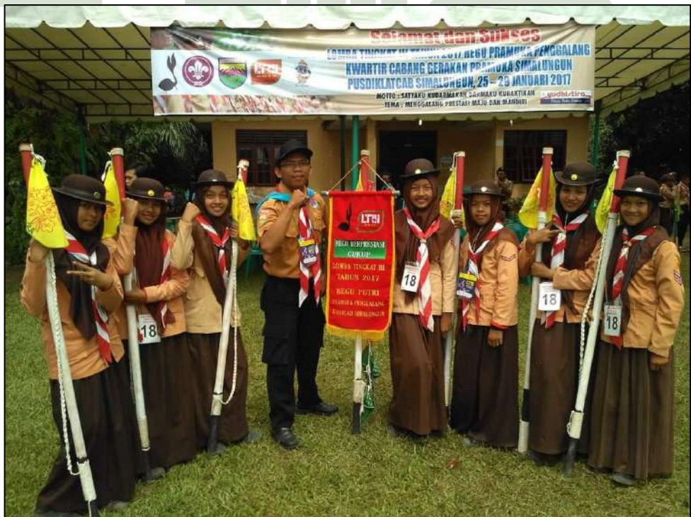
Gambar 24. Kegiatan Pramuka MTs. Swasta Al-Jihad Kota Medan