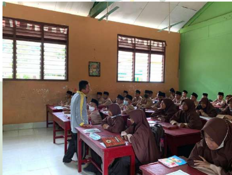
Gambar 8: Suasana Proses Belajar Mengajar MTs Al-Ihya Tanjung Gading

UNIVERSITAS ISLAM NEGERI SUMATERA UTARA MEDAN