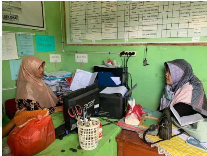
UNIVERSITAS ISLAM NEGERI Gambar 12: Operator MTs Surya Agung SUMATERA UTARA MEDAN