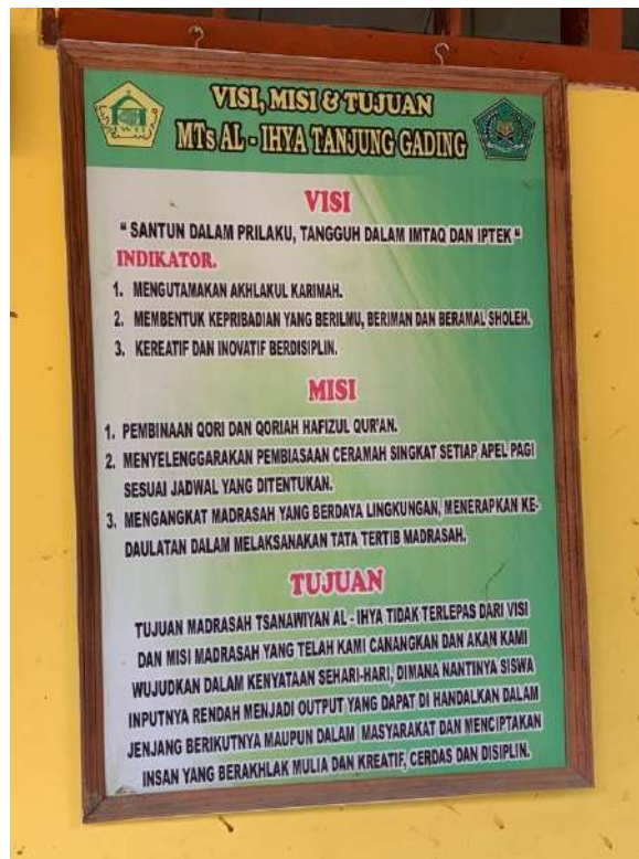
Gambar 13: Visi, Misi dan Tujuan MTs Al-Ihya Tanjung Gading