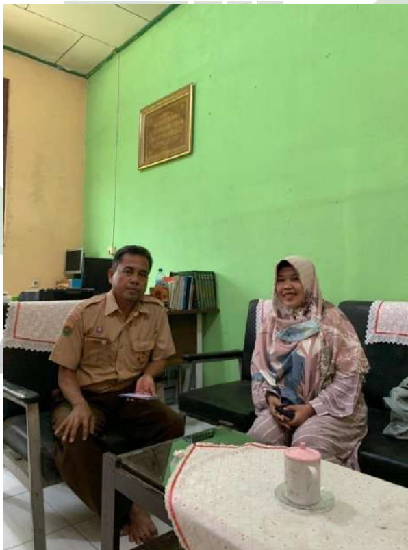
Gambar 4: Wawancara dengan Kepala Sekolah MTs Al-Ihya Tanjung Gading