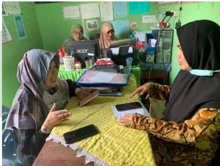
SUMATERA UTARA MEDAN Gambar 11: Wawancara dengan Wakil Kepala Sekolah Bidang Kurikulum MTs Surya Agung