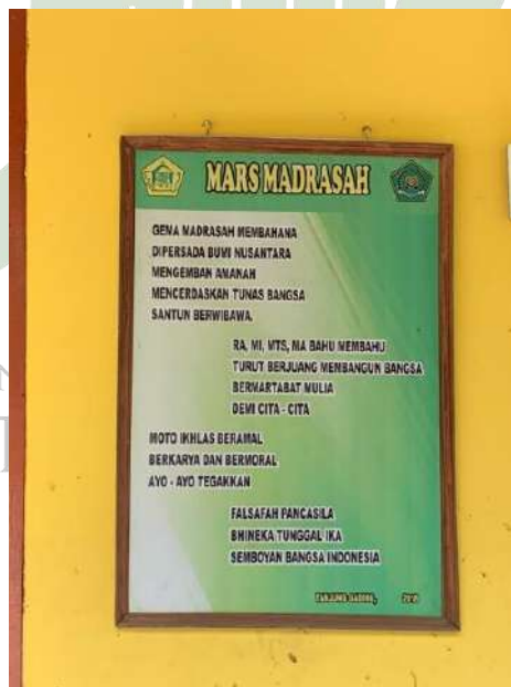
Gambar 14: Mars Madrasah Al-Ihya Tanjung Gading