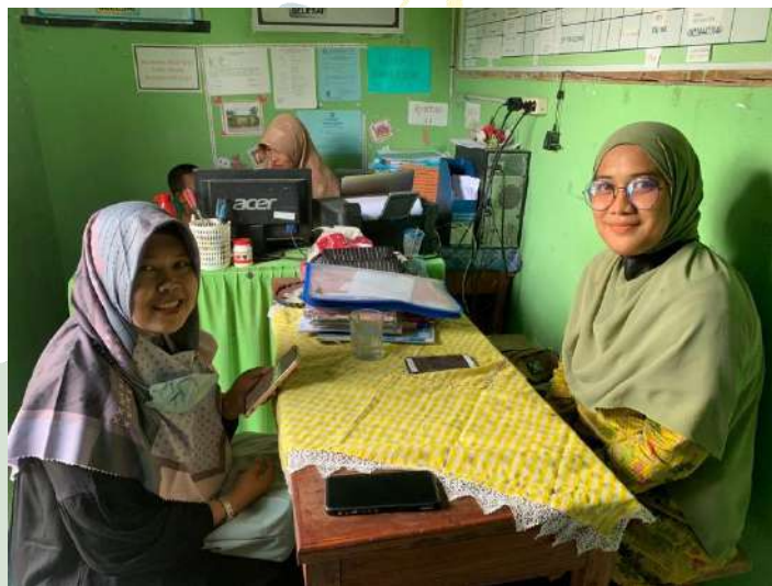
Gambar 10: Wawancara dengan Bendahara MTs Surya Agung

UNIVERSITAS ISLAM NEGERI SUMATERA UTARA MEDAN