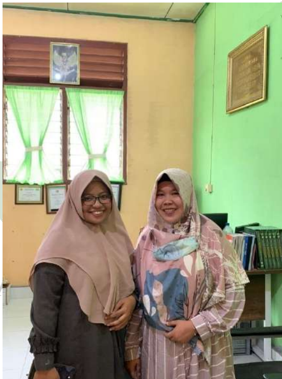
Gambar 6: Wawancara dengan Bendahara Sekolah MTs Al-Ihya Tanjung Gading