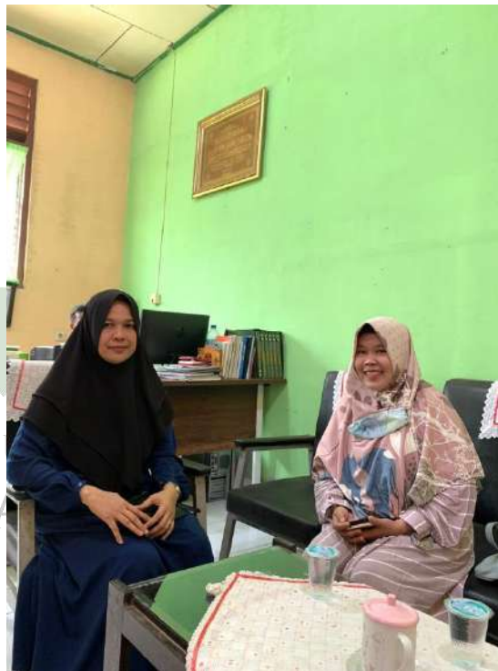
Gambar 5: Wawancara dengan Wakil Kepala Sekolah Bidang Kurikulum MTs Al-Ihya Tanjung Gading