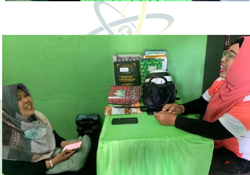
Gambar 9: Wawancara dengan Kepala Sekolah MTs Surya Agung

UNIVERSITAS ISLAM NEGERI SUMATERA UTARA MEDAN