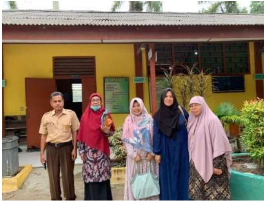
Gambar 7: Foto Bersama dengan Guru MTs Al-Ihya Tanjung Gading