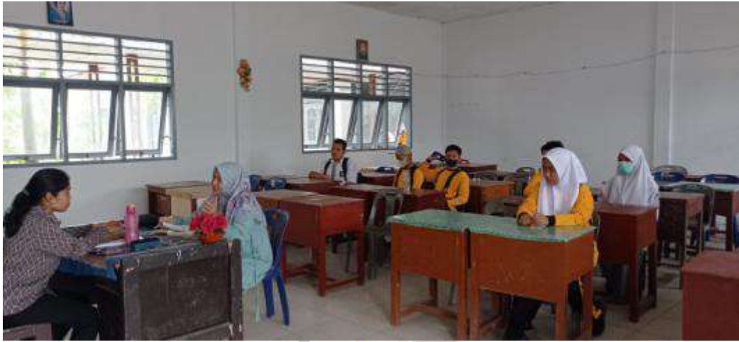
Gambar 6: Wawancara dengan guru