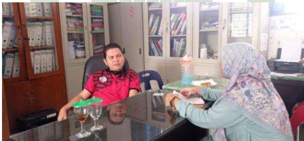
Gambar 2: Wawancara dengan Kepala Sekolah