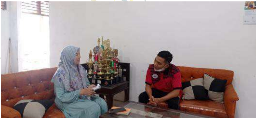
Gambar 7: Wawancara dengan Guru