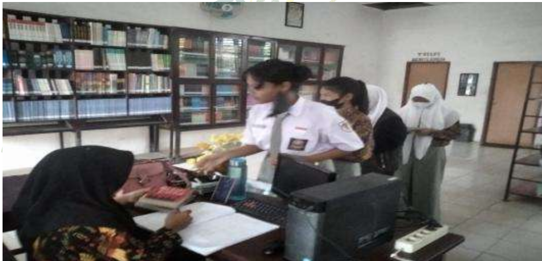
Gambar 10: Perpustakaan, menambah ilmu dan wawasan siswa