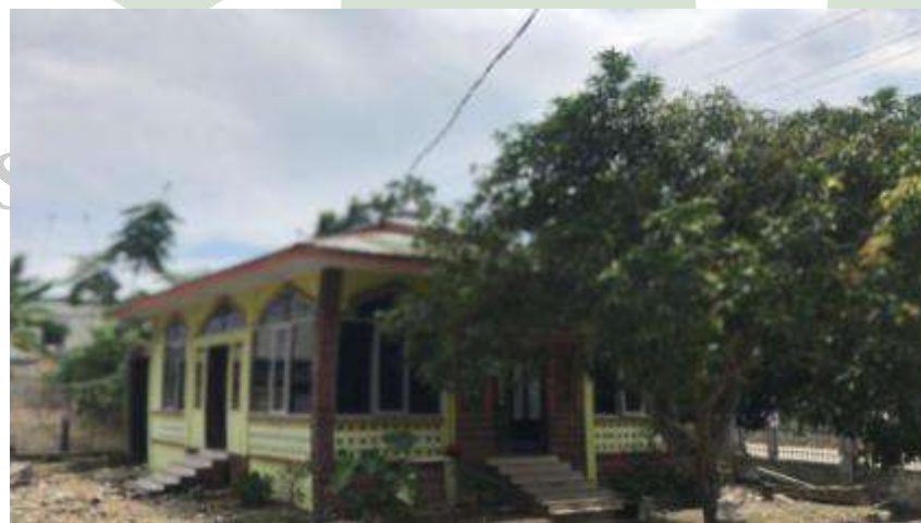
Gambar 13: Mushollah sekolah tempat ibadah siswa untuk meningkatkan pendidikan karakter yang religius