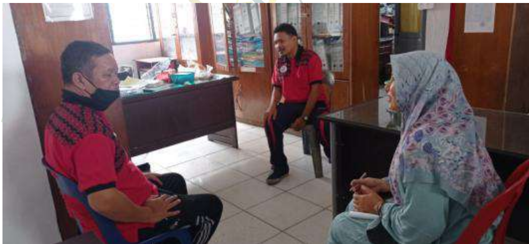
Gambar 4: wawancara dengan guru Bimbingan Konseling