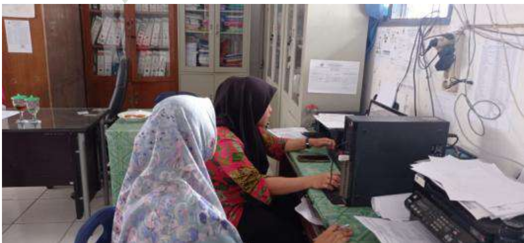
Gambar 8: Pengambilan data dengan operator