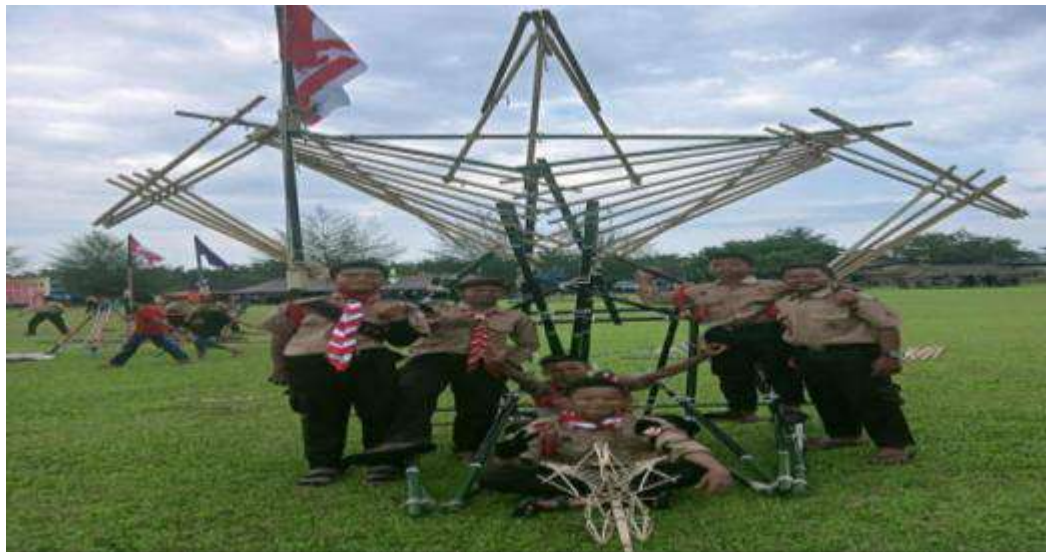
Gambar 12: Kegiatan pramuka salah satu wadah penguatan karakter siswa