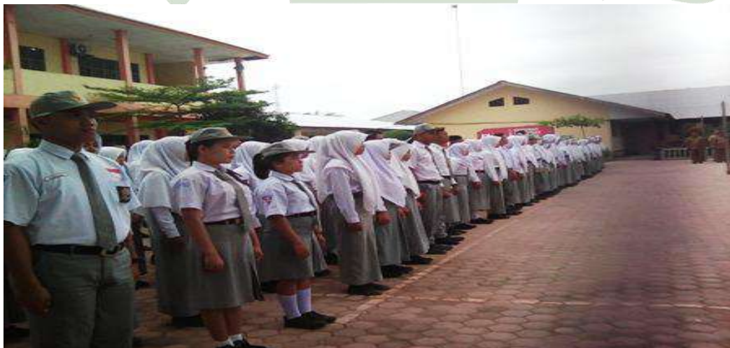
Gambar 11: Upacara Bendera salah satu wadah penguatan karakter siswa