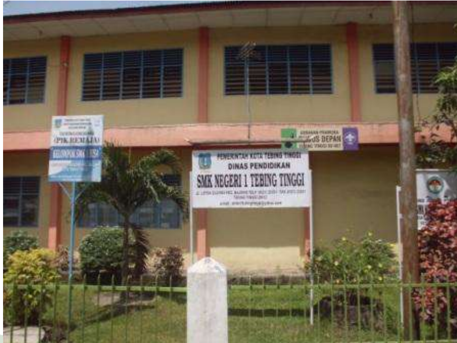
Gambar 1: Gedung SMK Negeri 1 Kota Tebing Tinggi