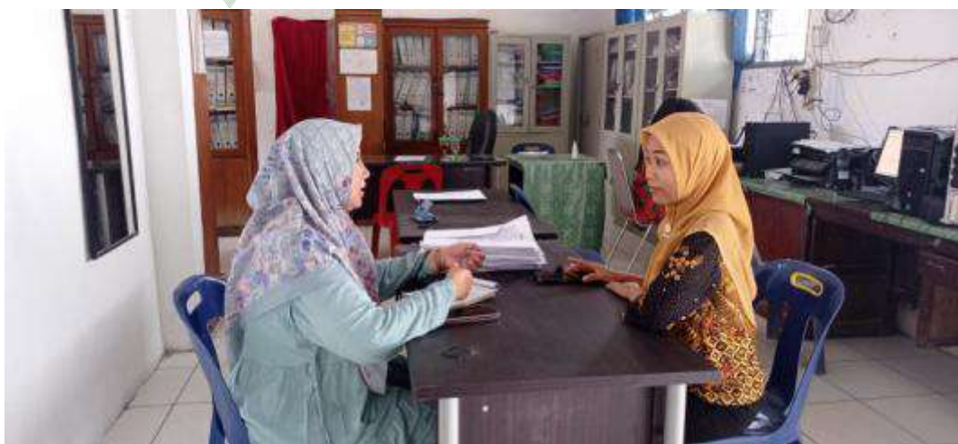
Gambar 5: wawancara dengan Guru Agama Islam