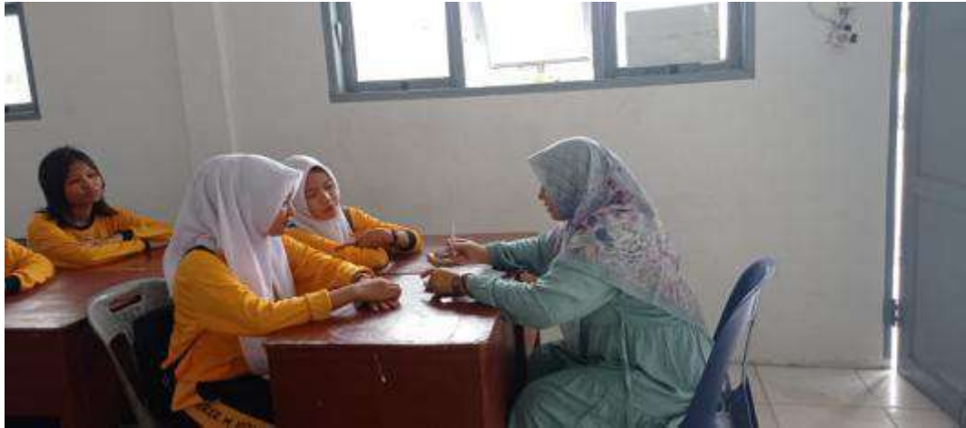
Gambar 9: wawancara dengan siswa tentang perencanaan Pendidikan Karakter