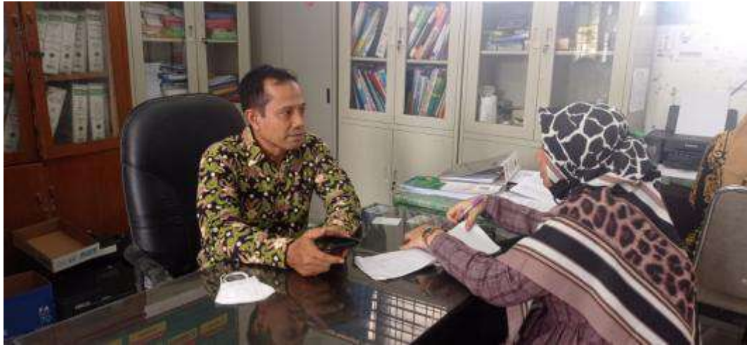
Gambar 3: Wawancara dengan Wakil Kepala Sekolah Bidang Kurikulum