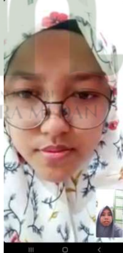
Keterangan 5 Foto Wawancara dengan Informan JNL