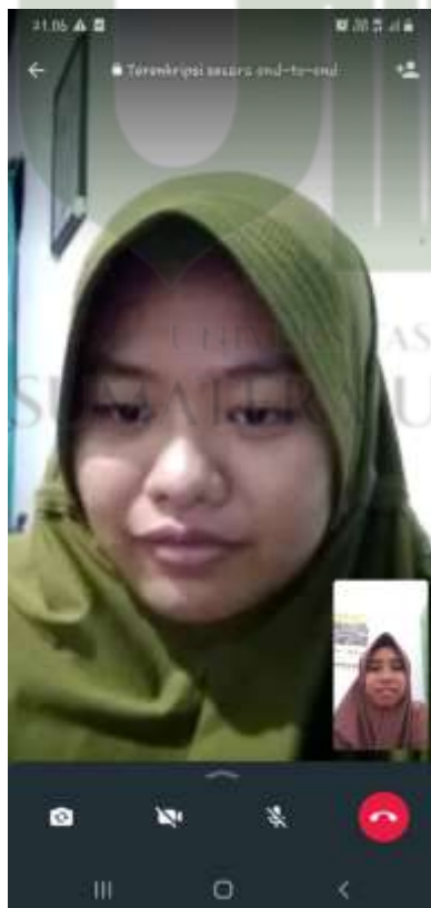
Keterangan 4 Foto Wawancara dengan Informan WM