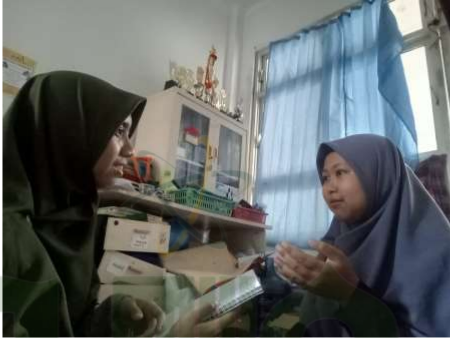
Keterangan 1 Foto Wawancara dengan Informan AA