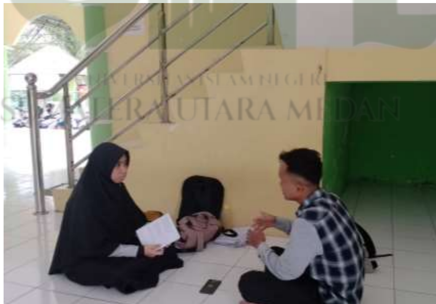
Keterangan 2 Foto Wawancara dengan Informan IWZ