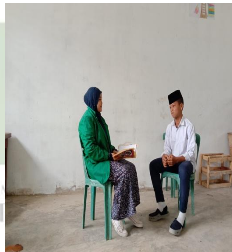
Gambar 1.6 wawancara siswa