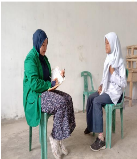
Gambar 1.5 wawancara siswi