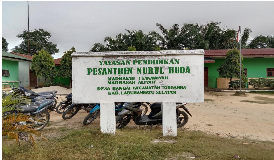
Gambar 1.1 Gerbang Sekolah