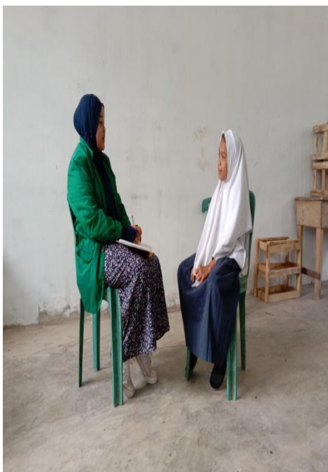
Gambar 1.9 Wawancara dengan siswi