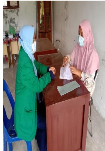
Gambar 1.4 Wawancara Guru BK