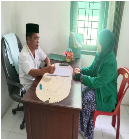
Gambar 1.3 Wawancara kepala sekolah