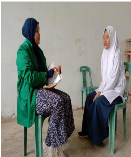
Gambar 1.7 wawancara siswi