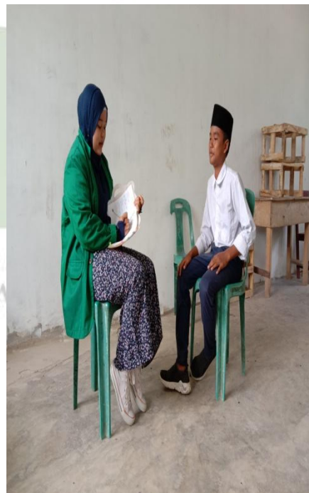
Gambar 1.10 Wawancara dengan siswa