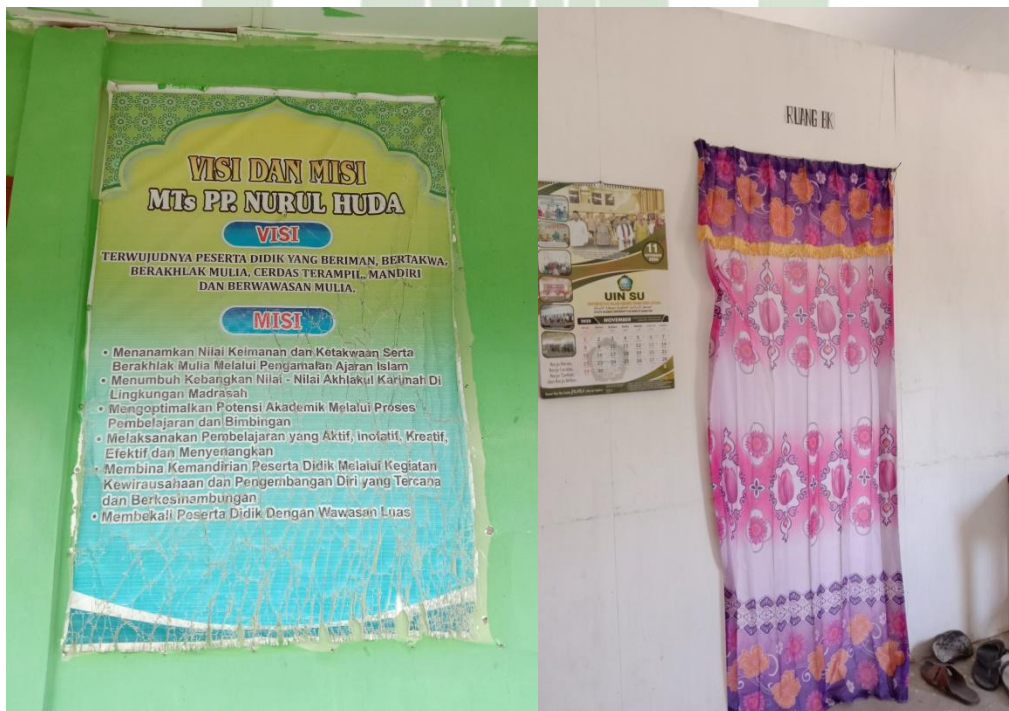
Gambar 1.2 Visi &amp; Misi