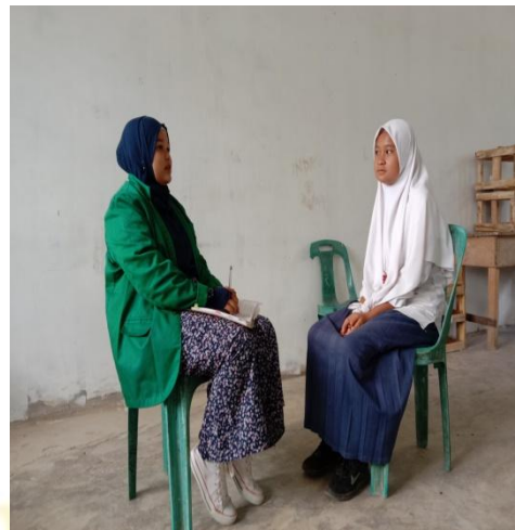
Gambar 1.8 wawancara dengan siswi