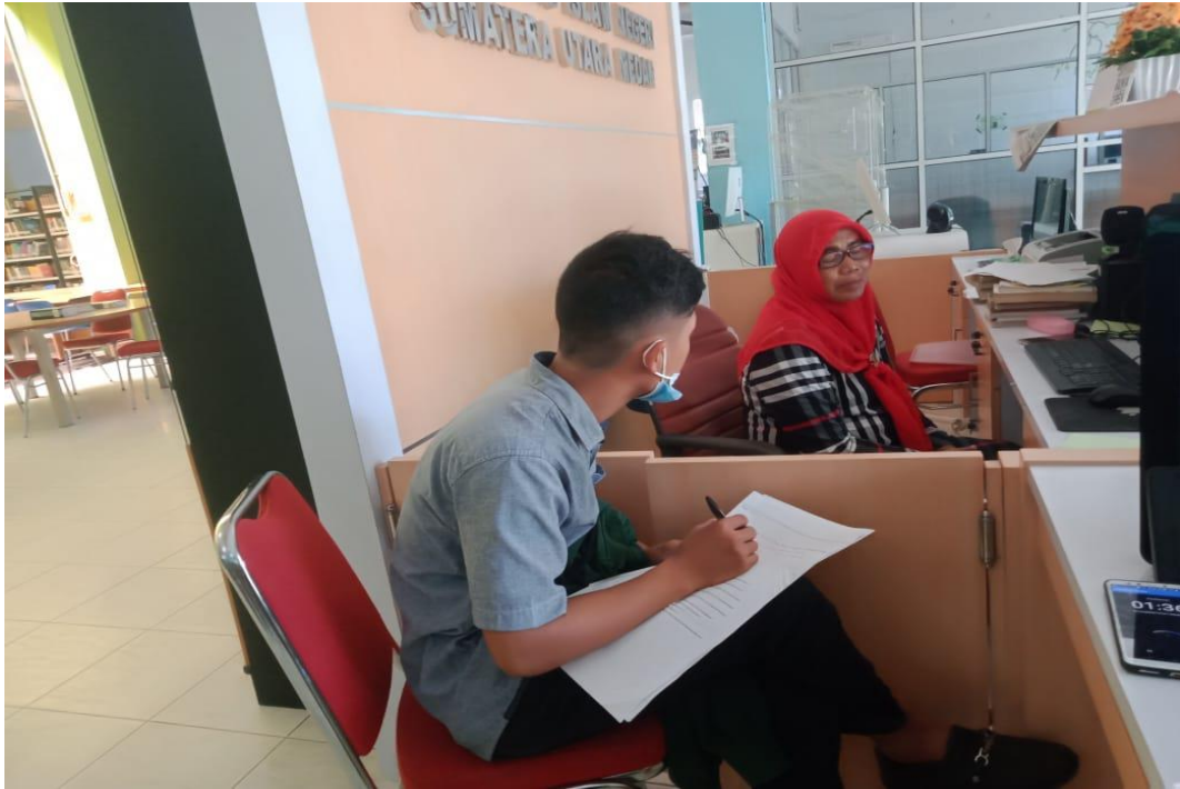
Gambar 5 wawancara dengan Staff Perpustakaan UINSU