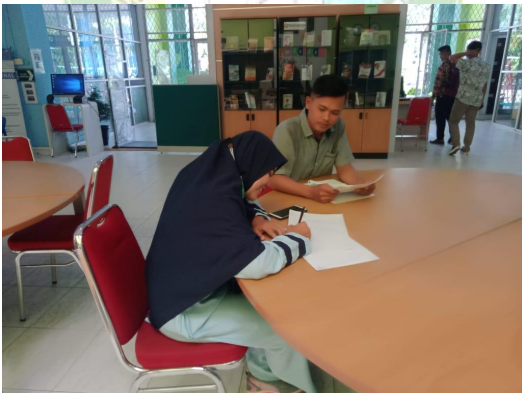
Gambar 4 wawancara dengan mahasiswa prodi IPS stambuk 2015