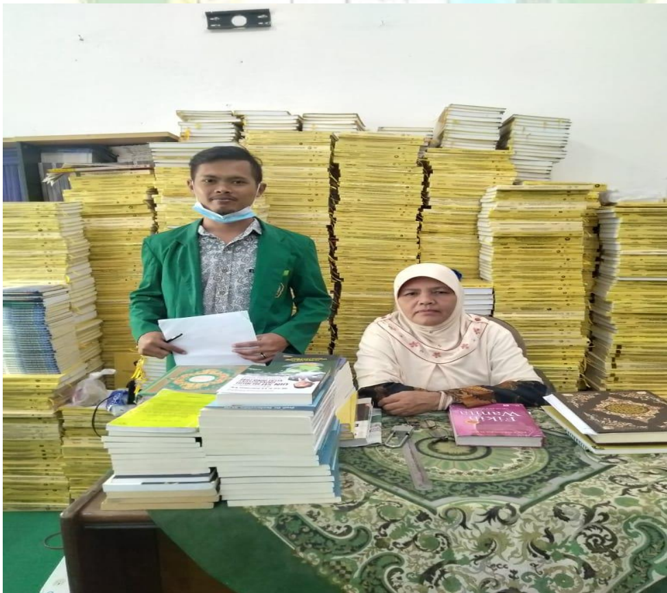
Gambar 6 wawancara dengan staaf Perpustakaan FITK UINSU\