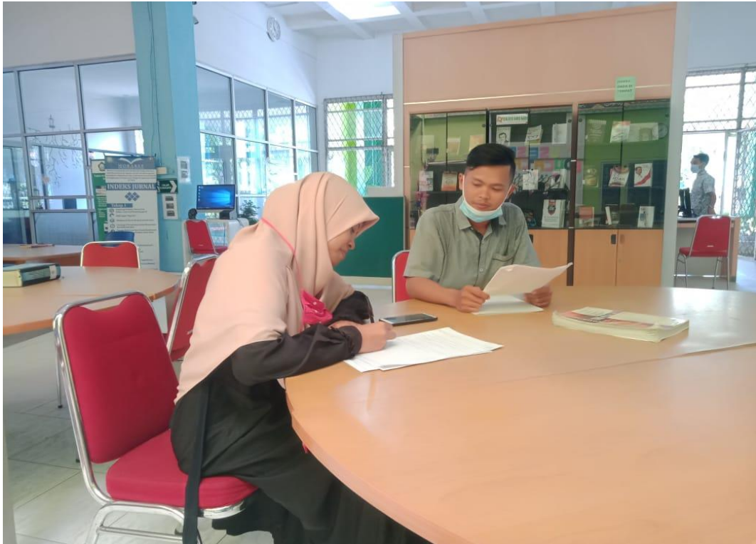
Gambar 3 Wawancara dengan mahasiswa prodi IPS stambuk 2015