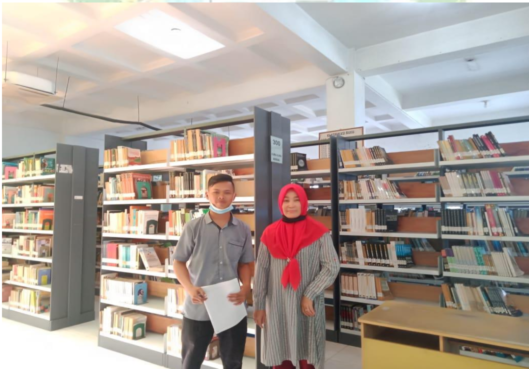
Gambar 2 wawancara dengan Kepala Perpustakaan UIN SU