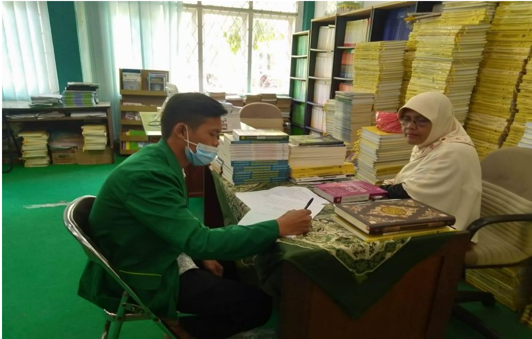
Gambar 1 wawancara dengan Staff Perpustakaan FITK UINSU