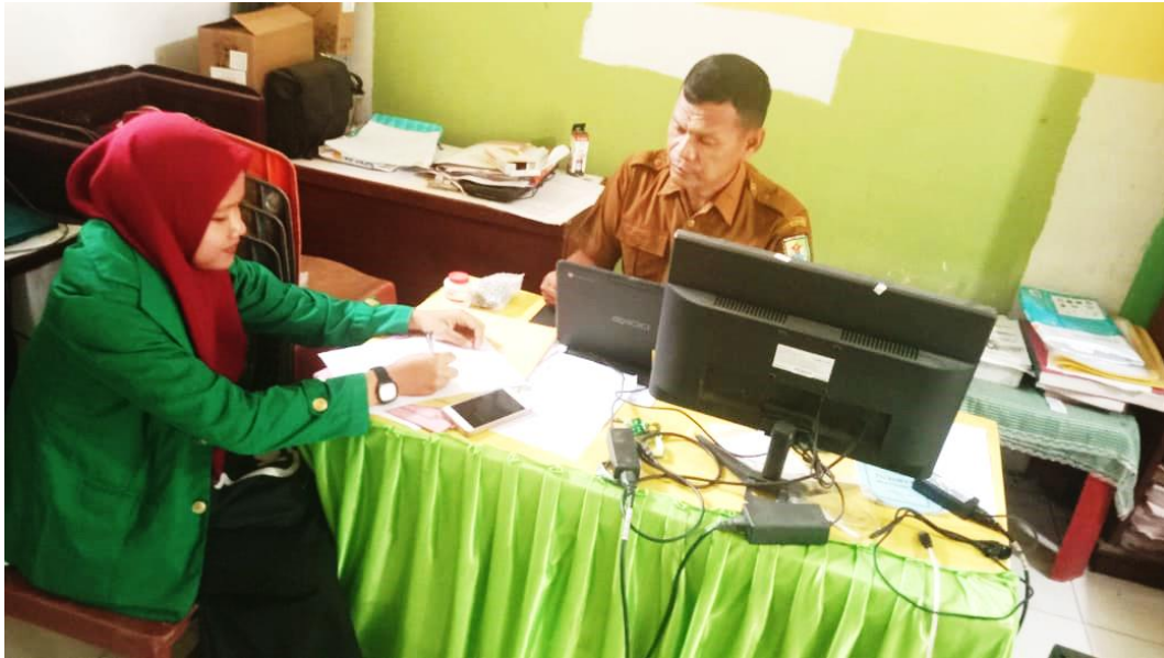
Foto Bersama dengan dewan Guru