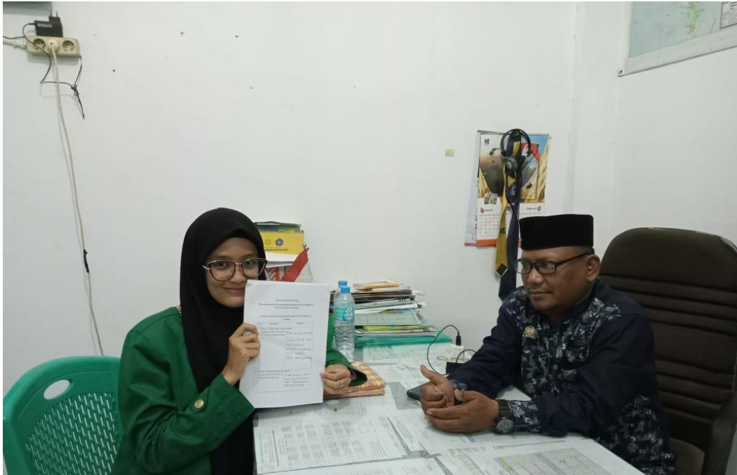
Gambar. 1.5. Wawancara kepada staff MAS Al Washliyah 22 Tembung Foto Bersama Bapak Kepala Tata usaha dan Guru MAS Al Washliyah 22 Tembung