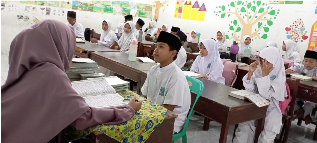
Pelaksanaan kegiatan menyeter hafalan al-Qur'an