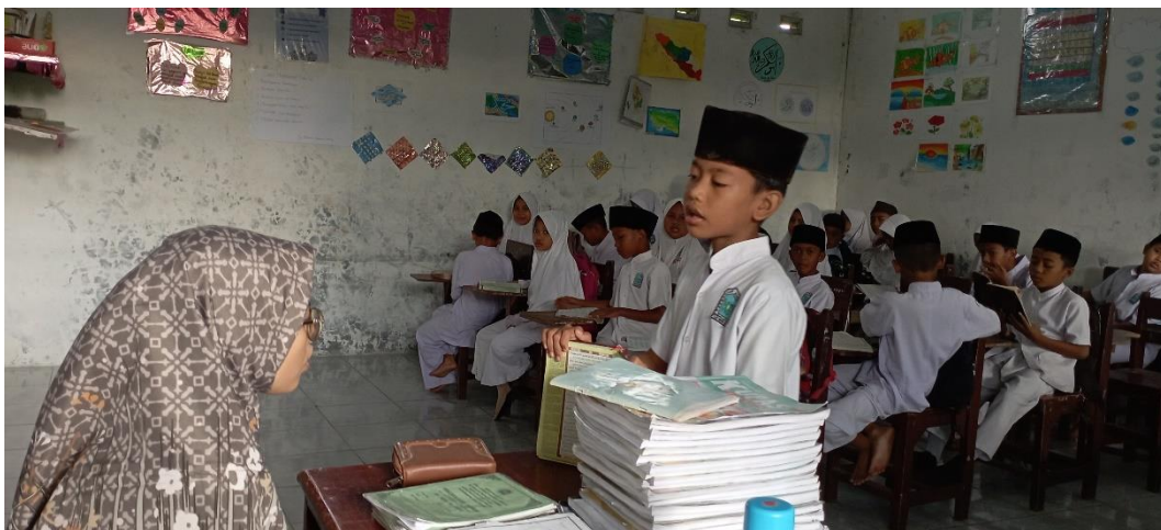
Pelaksanaan kegiatan muraja'ah