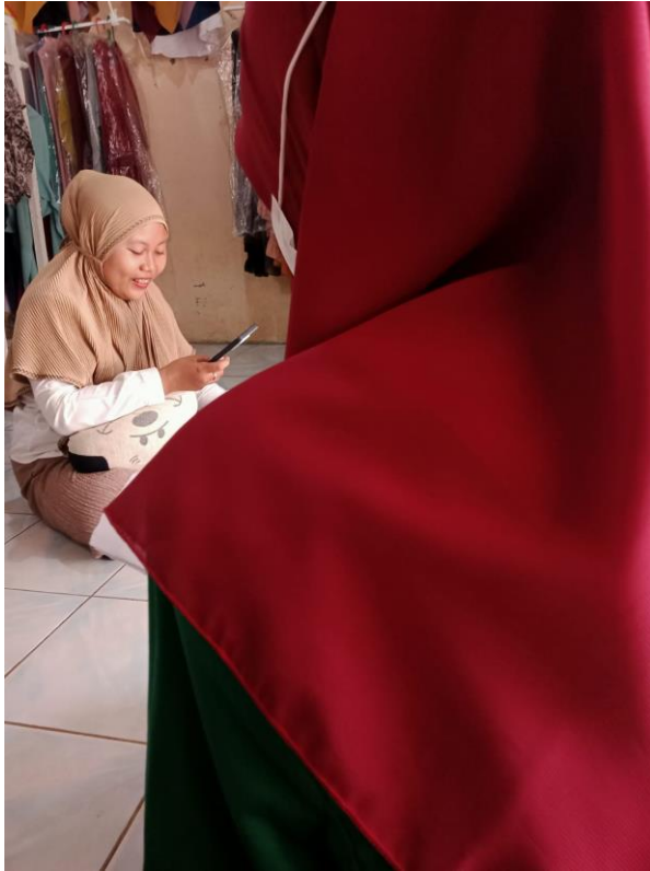
Gambar 4 : Wawancara dengan pedagang disekitar objek wisata religi