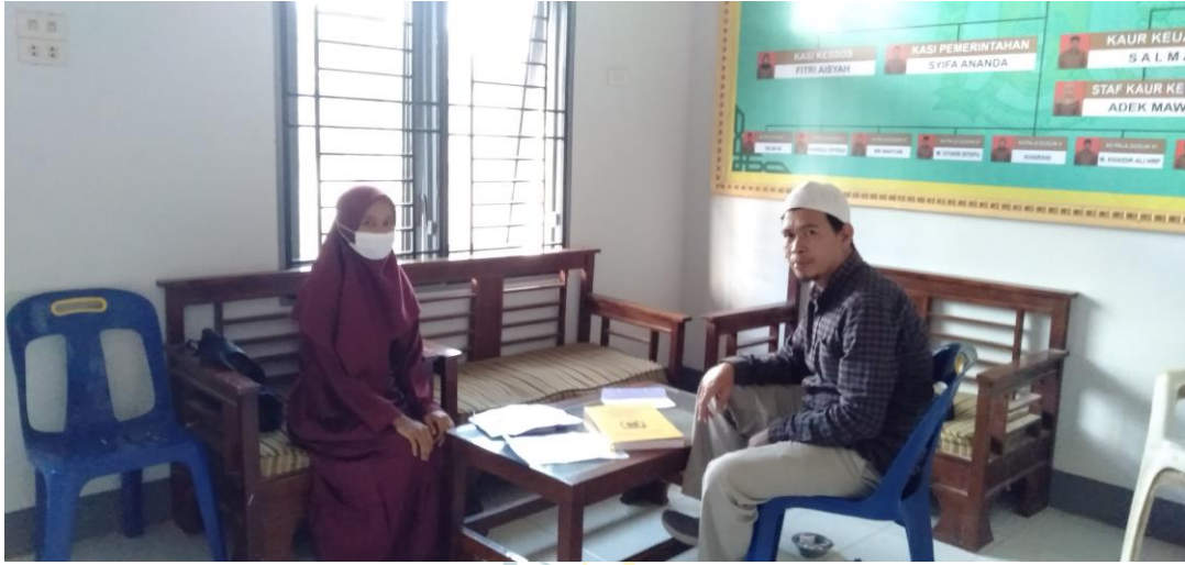
Gambar 5 : Wawancara dengan Sekretaris Desa Besilam