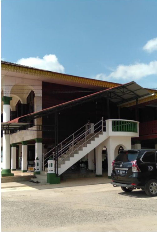
Gambar 2 : Masjid Kayu Desa Babussalam Besilam