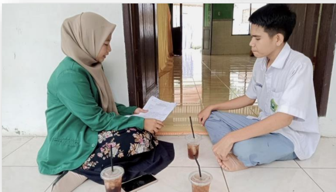
Gambar 6. Wawancara dengan siswa