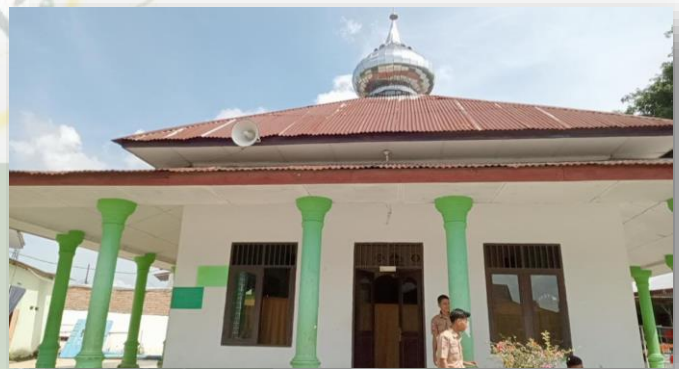
Gambar 3. Mushola MAN 3 Medan