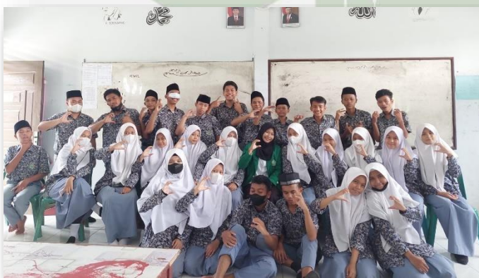
Gambar 4. Bersama Siswa Kelas XI IK 1 MAN 3 Medan