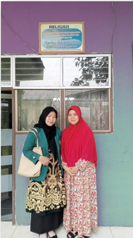
Gambar 8. Bersama Guru BK MAN 3 Medan