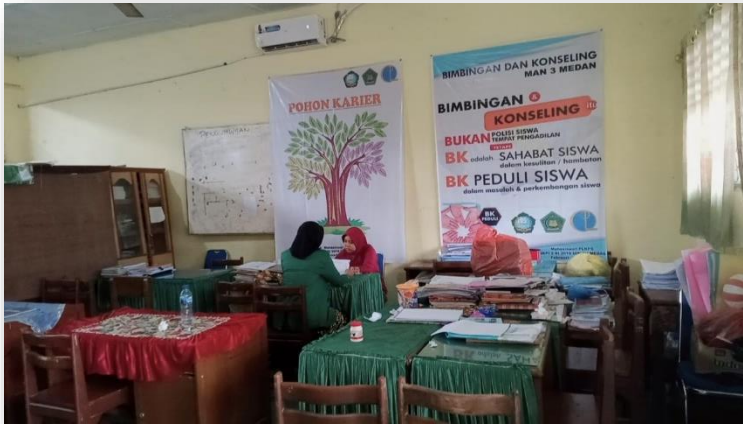
Gambar 7. Wawancara dengan guru BK Kelas XI MAN 3 Medan