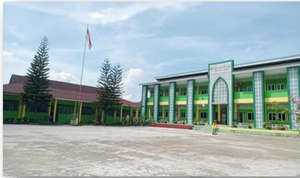
Gambar 2. Lapangan MAN 3 Medan