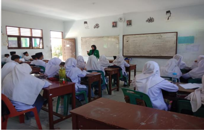
Gambar 5. Memperkenalkan diri dan maksud tujuan