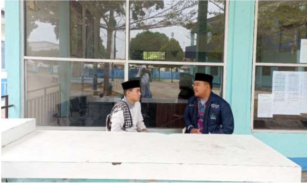
Gambar 9 Wawancara Dengan Pengasuh Asrama Pesantren Al Mukhlisin