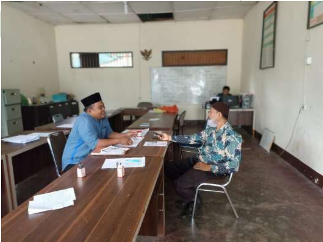
Gambar 10 Wawancara Dengan Bagian Pendidikan Pesantren Al Mukhlisin