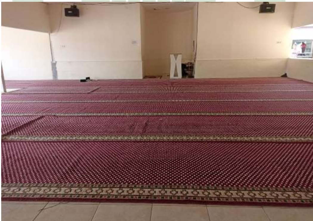
Gambar 16 Masjid Pondok Pesantren At Tibyan Deli Serdang