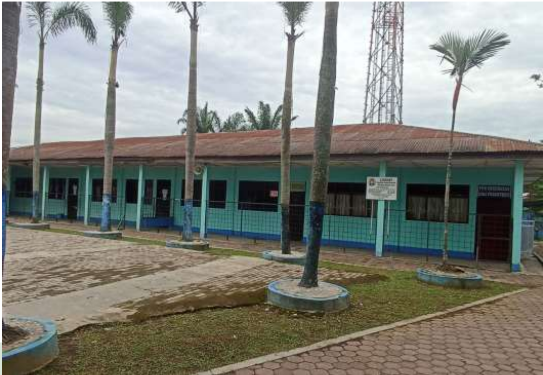
Gambar 1 Gedung Pondok Pesantren Al Mukhlishin Deli Serdang