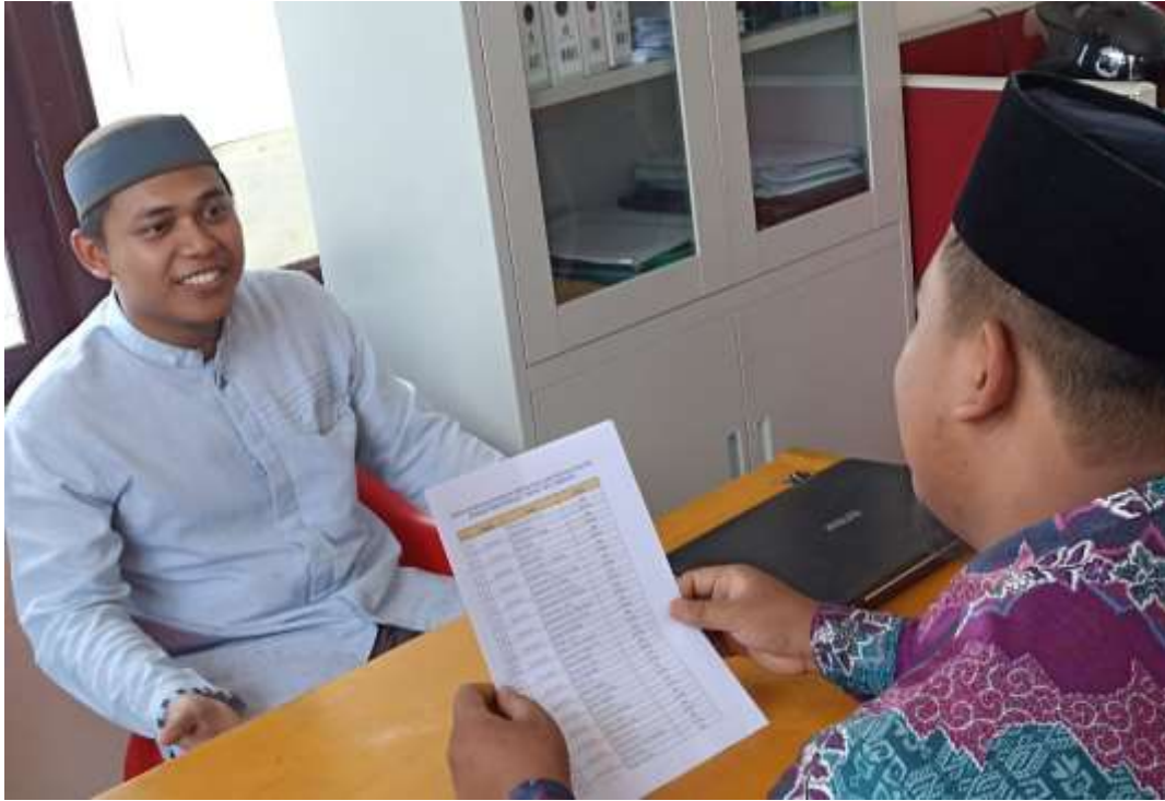
Gambar 22 Wawancara Dengan Guru Diniyyah Pondok Pesantren At Tibyan