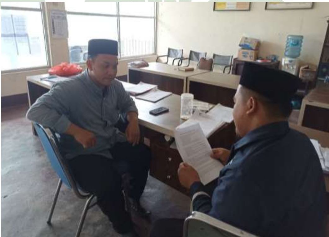
Gambar 8 Wawancara Dengan Pimpinan Pondok Pesantren Al Mukhlisin