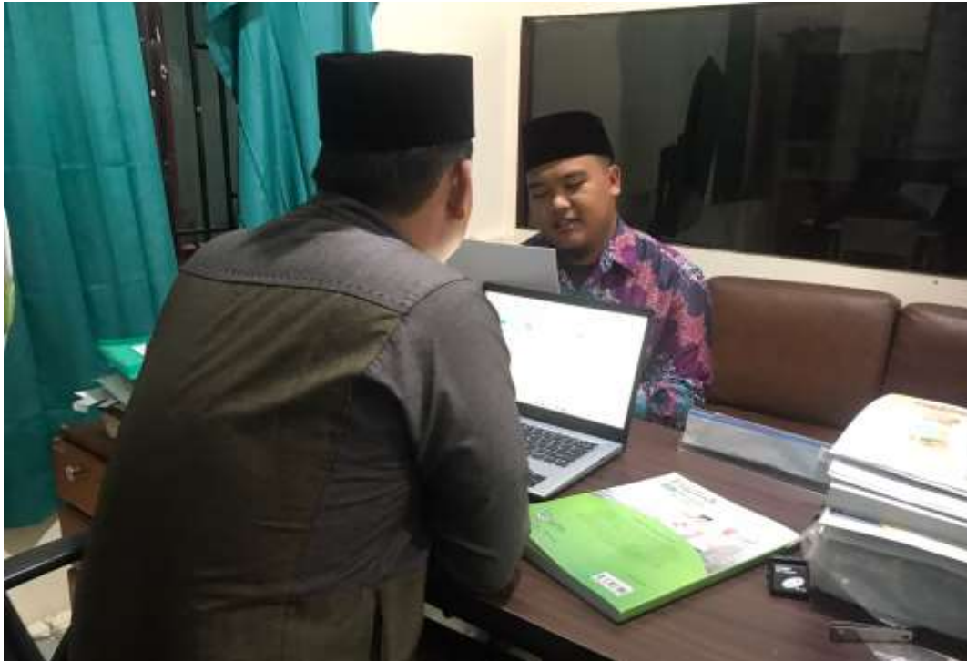
Gambar 18 Wawancara Dengan Pimpinan Pondok Pesantren At Tibyan