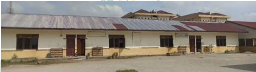
Gambar 15 Gedung Asrama Pondok Pesantren At Tibyan Deli Serdang