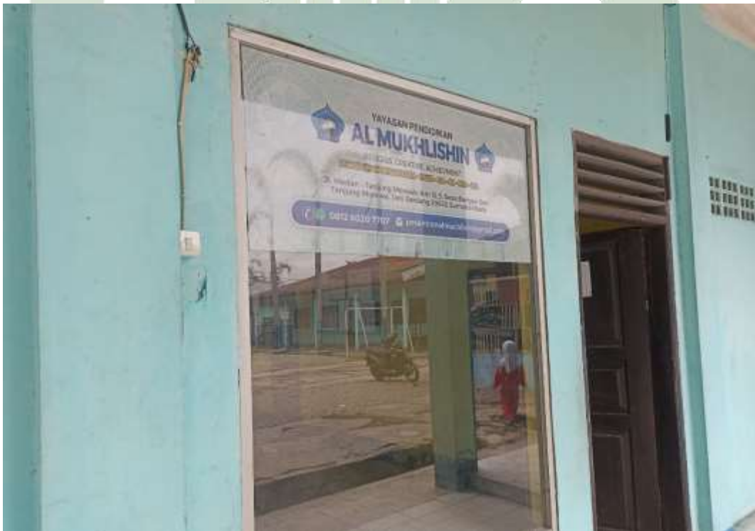
Gambar 6 Gedung Kantor Pesantren Pondok Pesantren Al Mukhlisin