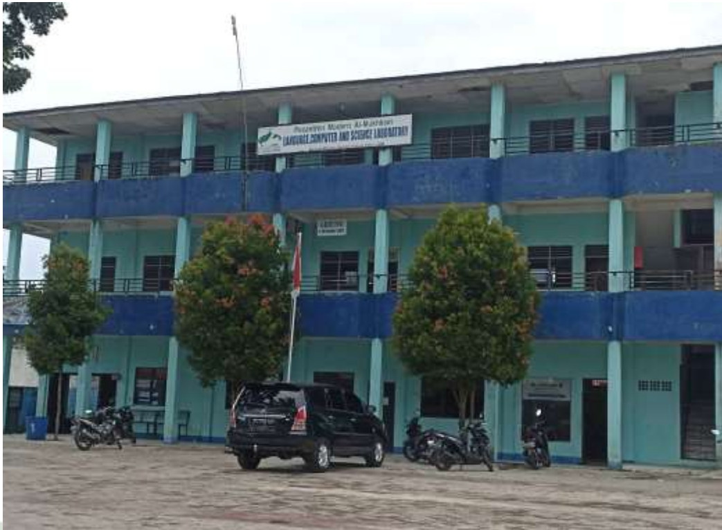
Gambar 3 Gedung II Pondok Pesantren Al Mukhlisin Deli Serdang