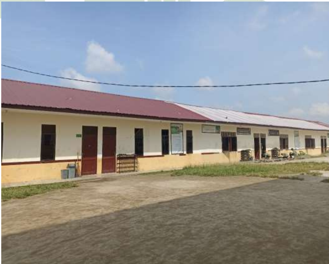
Gambar 14 Gedung Kelas Pondok Pesantren At Tibyan Deli Serdang