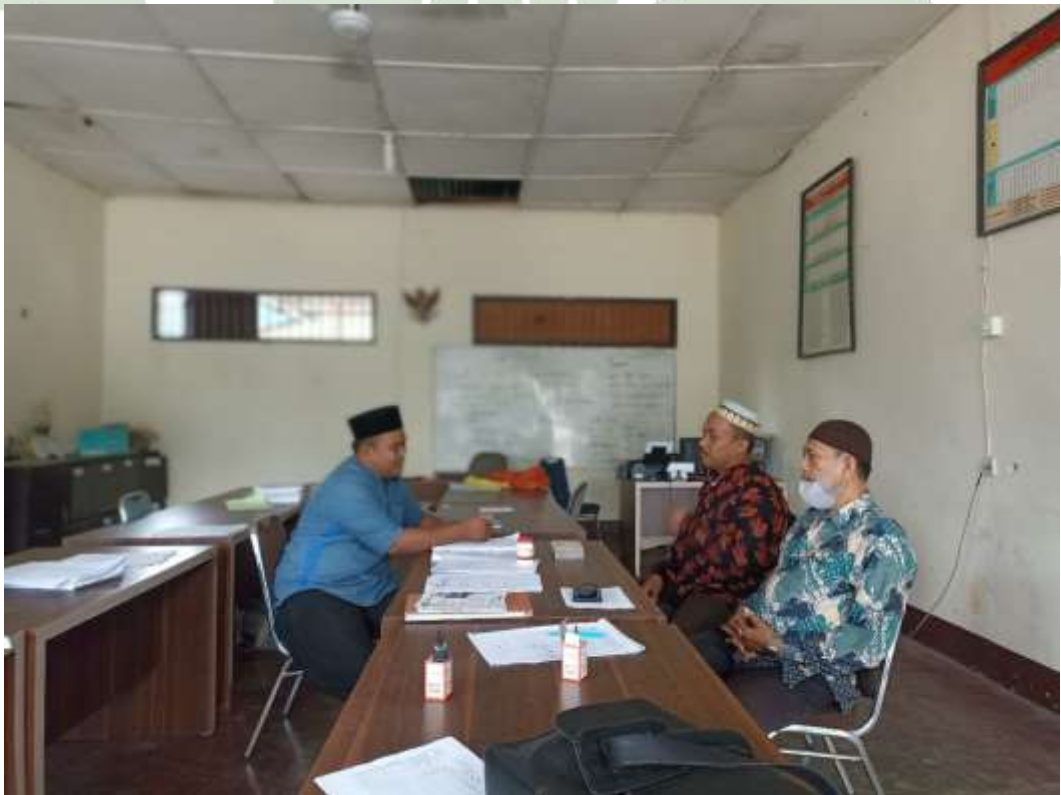
Gambar 12 Wawancara Dengan Guru Diniyyah Pondok Pesantren Al Mukhlishin