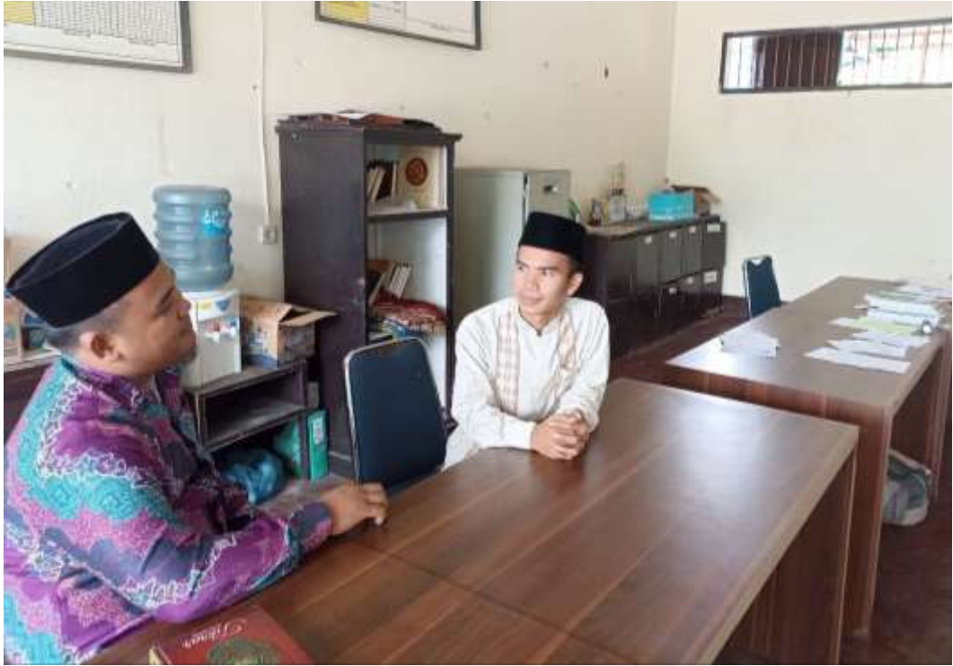
Gambar 11 Wawancara Dengan Guru Diniyyah Pondok Pesantren Al Mukhlishin