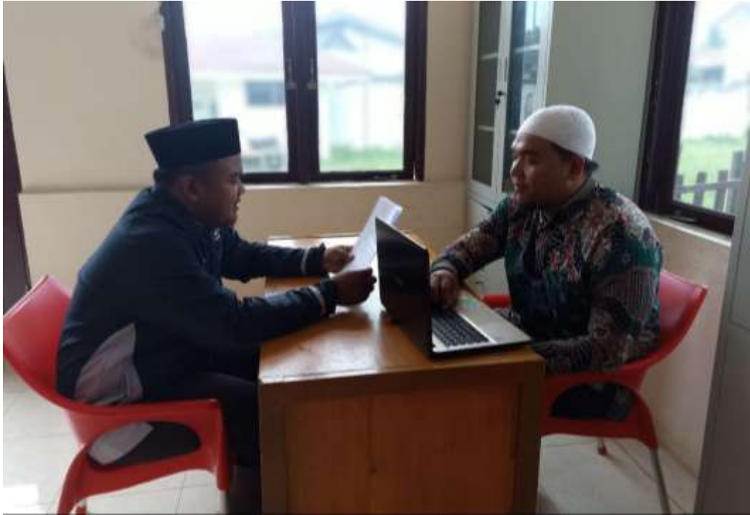
Gambar 20 Wawancara Dengan Pengasuh Asrama Pondok Pesantren At Tibyan