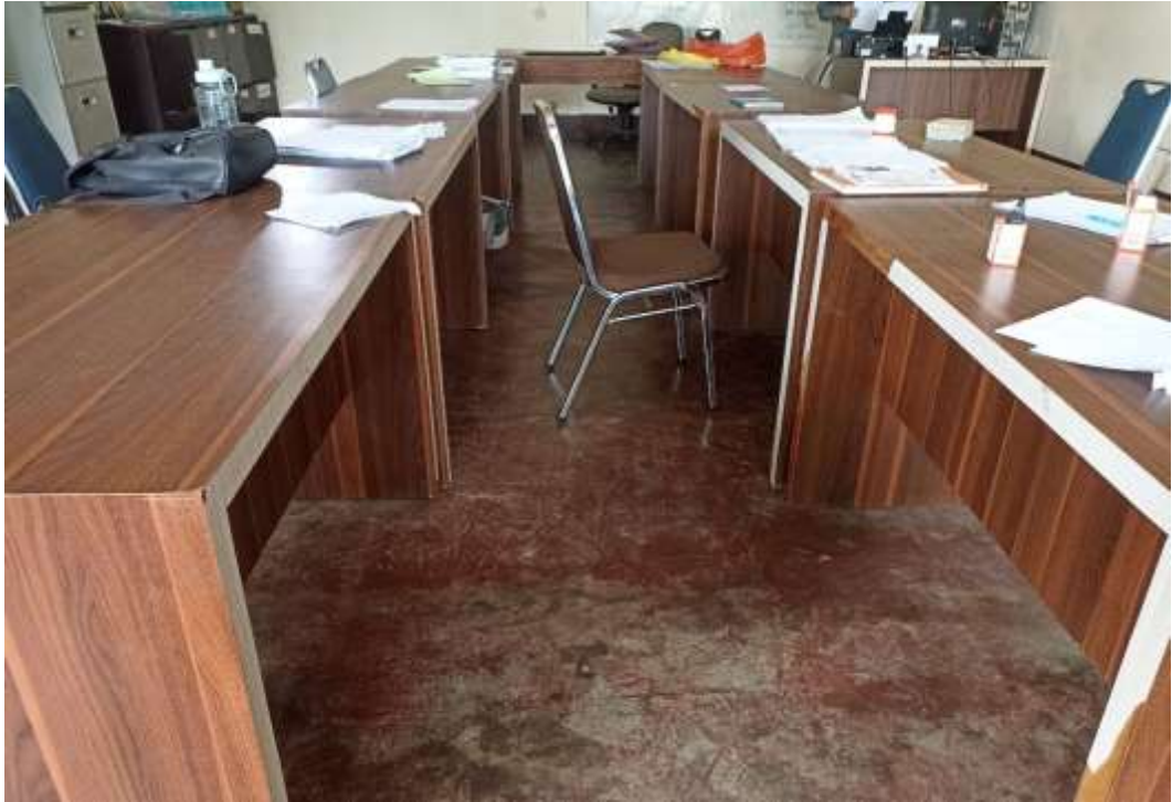
Gambar 7 Ruang Kantor Madrasah Pondok Pesantren Al Mukhlisin