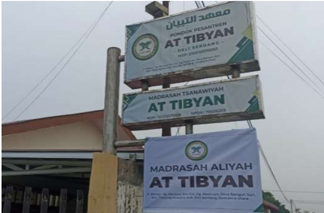
Gambar 13 Plank Pondok Pesantren At Tibyan Deli Serdang