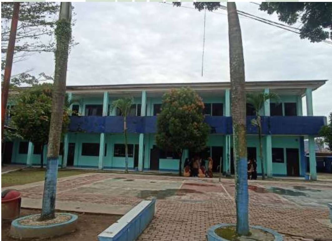
Gambar 4 Gedung Kelas Pondok Pesantren Al Mukhlisin Deli Serdang