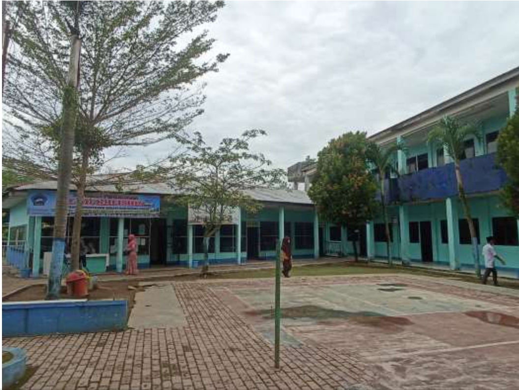
Gambar 5 Gedung Kantor Madrasah Pondok Pesantren Al Mukhlisin