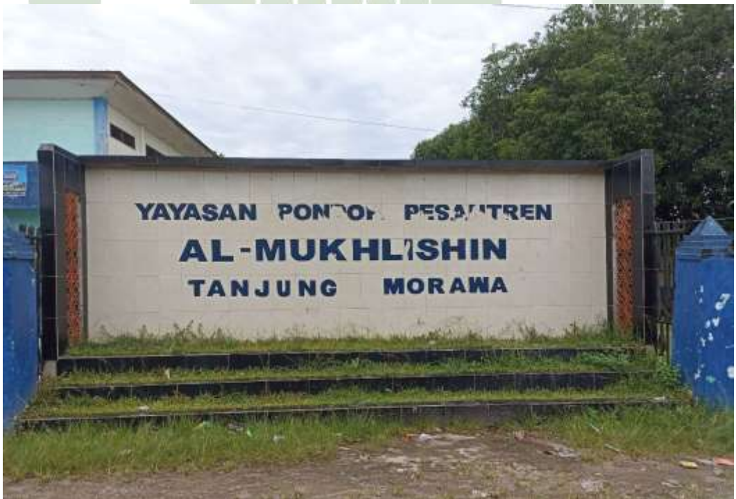
Gambar 2 Plank Pondok Pesantren Al Mukhlishin Deli Serdang