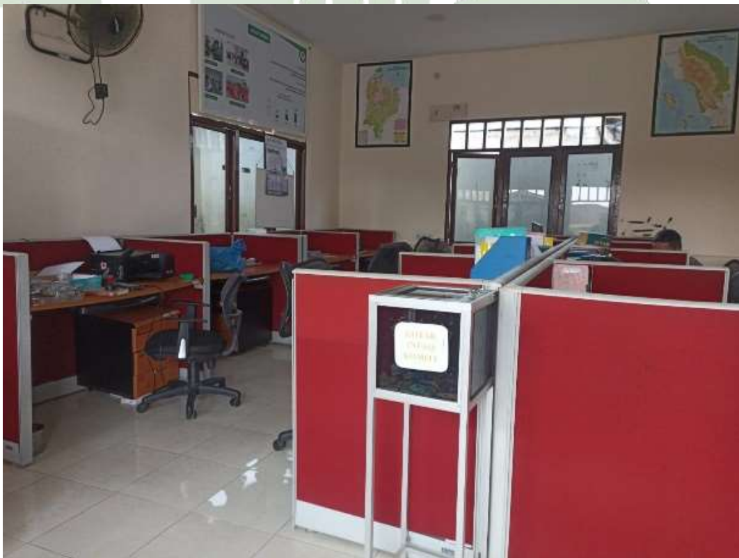
Gambar 17 Gedung Kantor Pondok Pesantren At Tibyan Deli Serdang