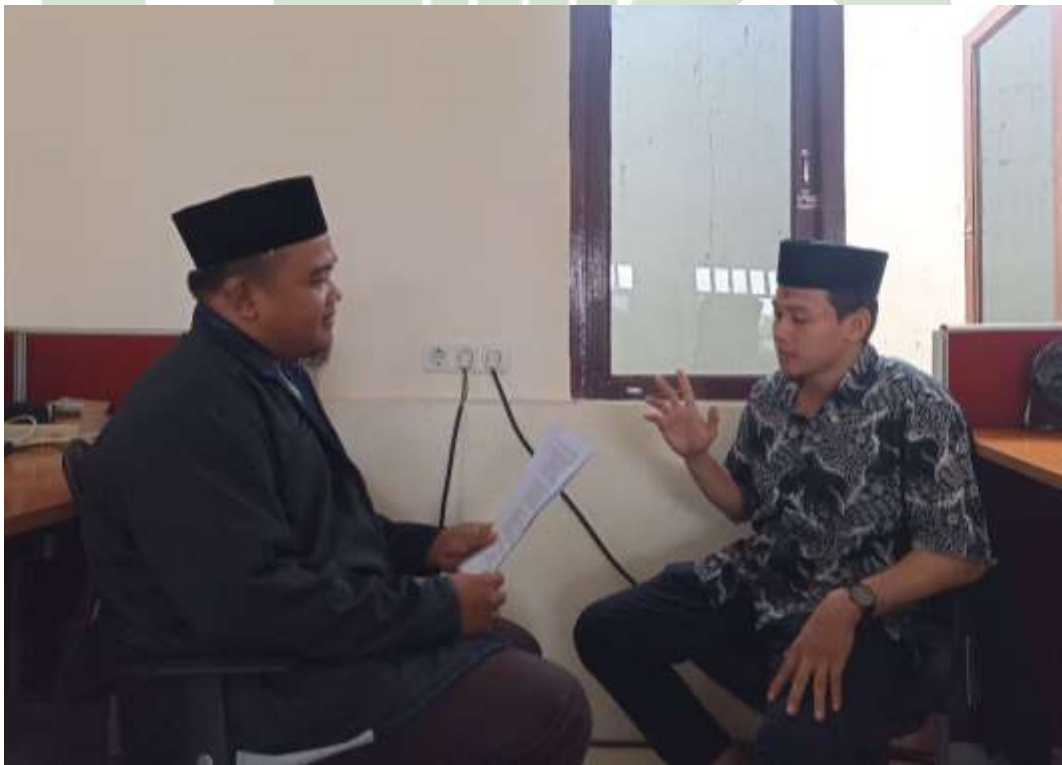
Gambar 19 Wawancara Dengan Bag. Pendidikan Pondok Pesantren At Tibyan