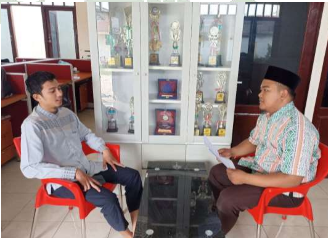
Gambar 23 Wawancara Dengan Guru Diniyyah Pondok Pesantren At Tibyan