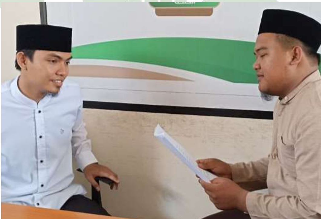
Gambar 21 Wawancara Dengan Bag. Kegiatan Pondok Pesantren At Tibyan