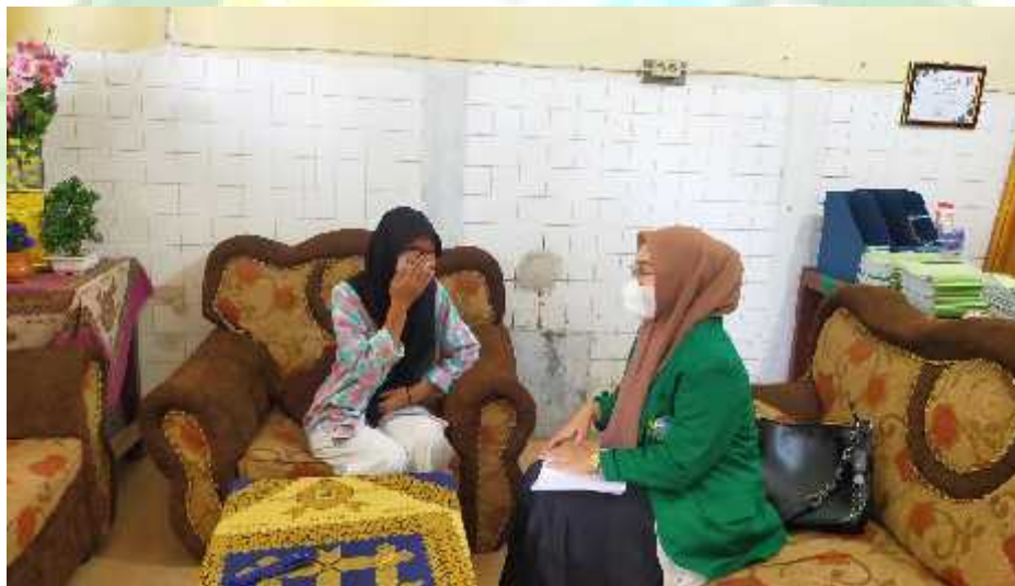
Wawancara dengan AA selaku siswa XII IPA-2