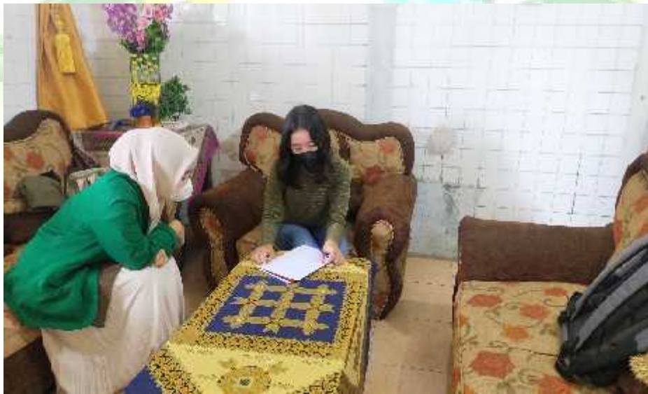
Wawancara dengan DS selaku siswa XII IPA-1