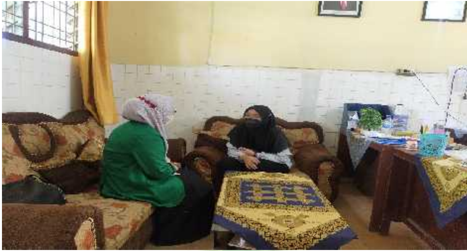
Wawancara dengan Ibu RM selaku Guru BK