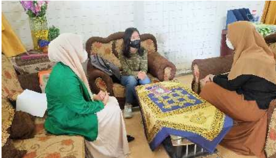
Wawancara dengan Guru BK dan Siswa DS