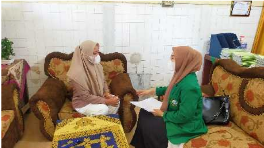
Wawancara dengan LPS selaku siswa XII IPA-2