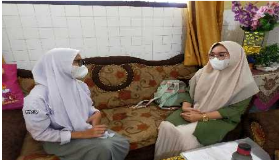
Wawancara dengan AA selaku siswa XII IPA-1