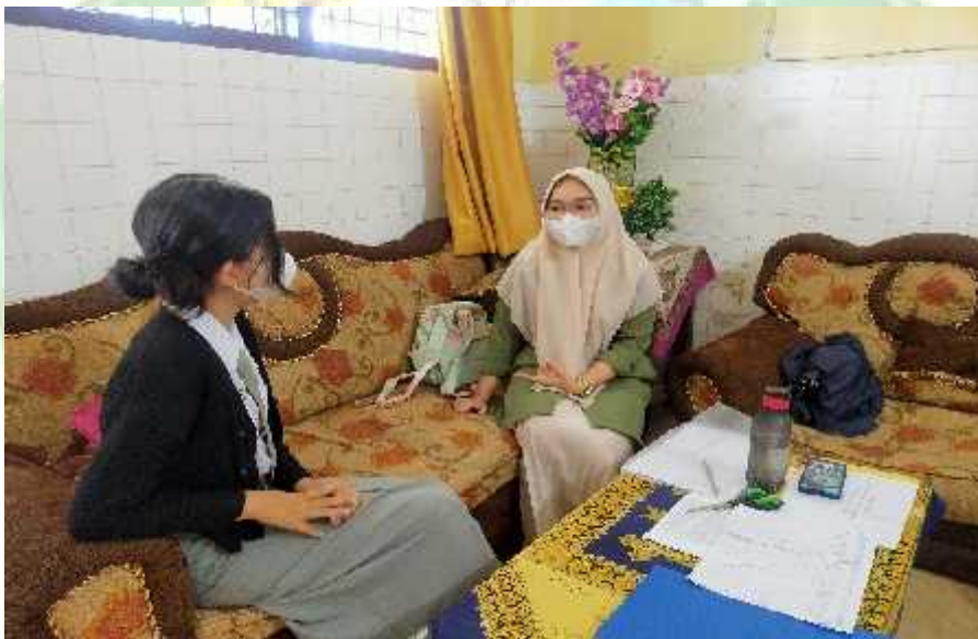
Wawancara dengan DS selaku siswa XII IPA-1