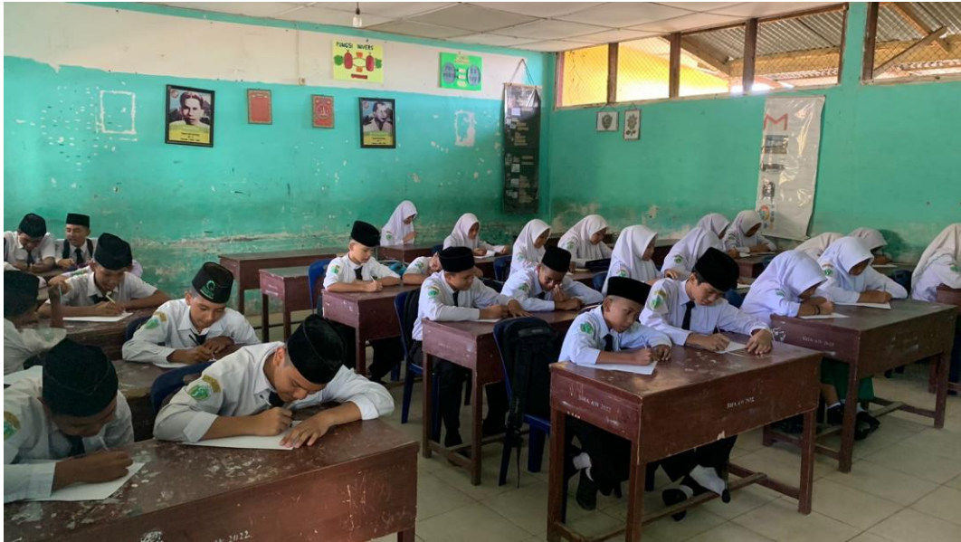
Pemberian Angket Perilaku Sopan Santun Setelah Layanan Bimbingan Kelompok dengan Teknik Modelling