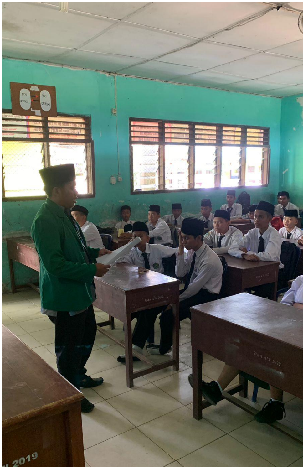
Pelaksanaan Layanan Bimbingan Kelompok dengan Teknik Modelling