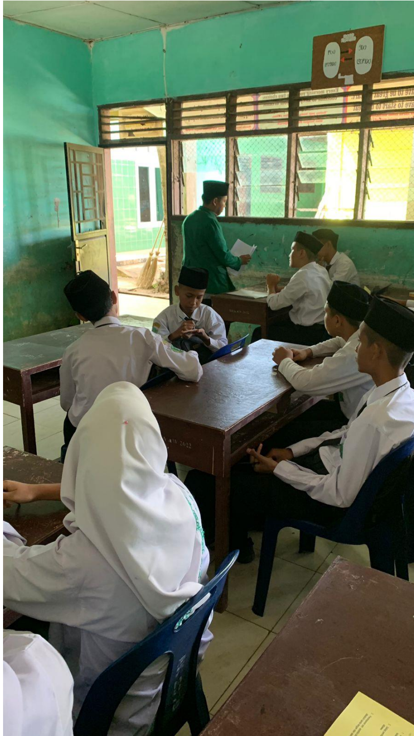
Pemberian Angket Perilaku Sopan Santun Sebelum Layanan Bimbingan Kelompok dengan Teknik Modelling