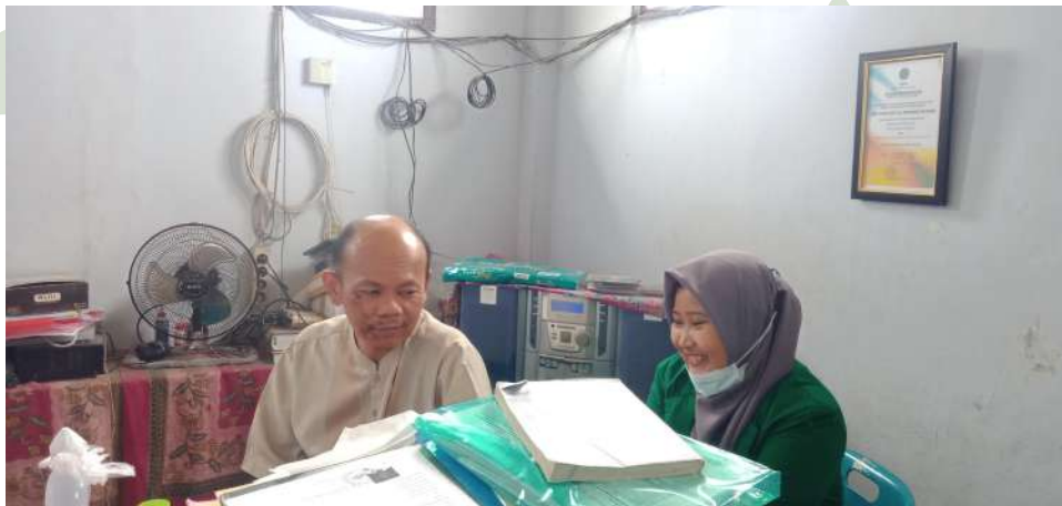
Wawancara dengan Kepala Sekolah SMP Terpadu Albukhari Muslim Medan

UNIVERSITAS ISLAM NEGERI SUMATERA UTARA MEDAN