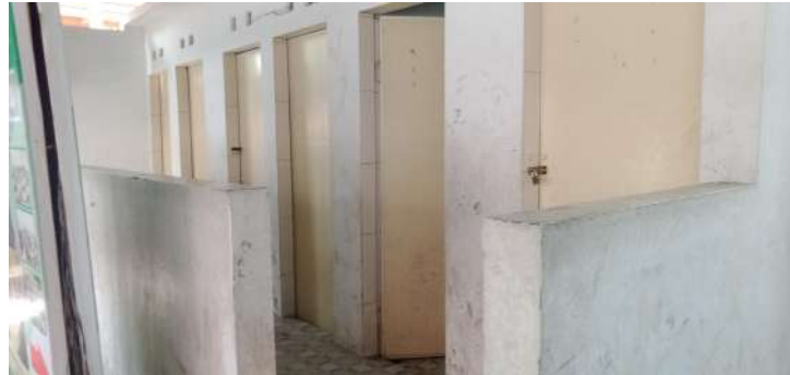
Kamar Mandi Siswa SMP Terpadu Albukhari Muslim Medan