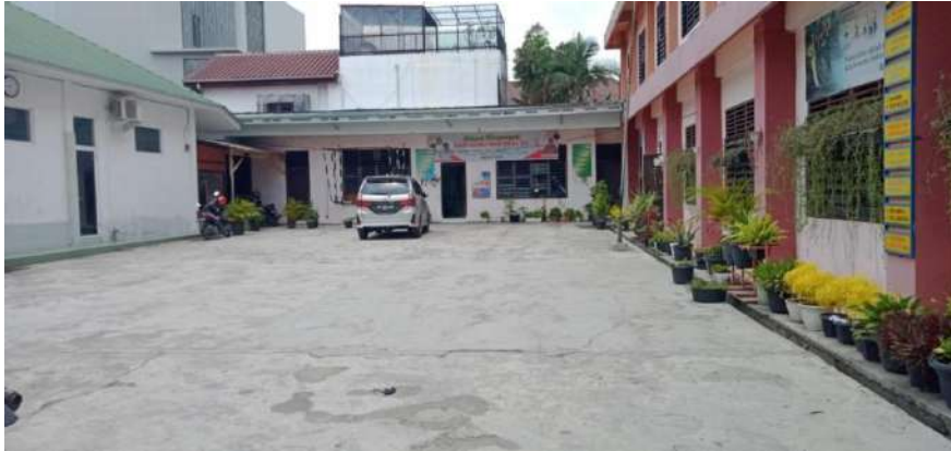
Lapangan/halaman SMP Terpadu Albukhari Muslim Medan