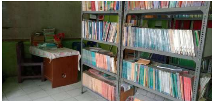
Perpustakaan SMP Terpadu Albukhari Muslim Medan