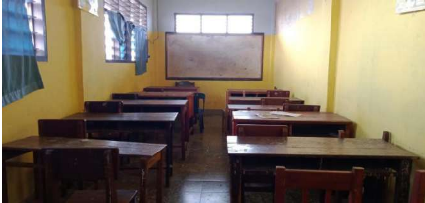
Ruang kelas SMP Terpadu Albukhari Muslim Medan