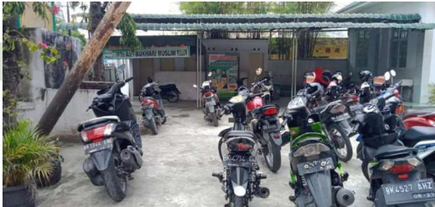
Parkiran SMP Terpadu Albukhari Muslim Medan

UNIVERSITAS ISLAM NEGERI SUMATERA UTARA MEDAN