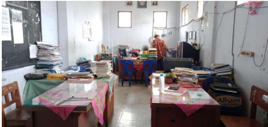
Ruang kepala sekolah dan ruang guru SMP Terpadu Albukhari Muslim Medan