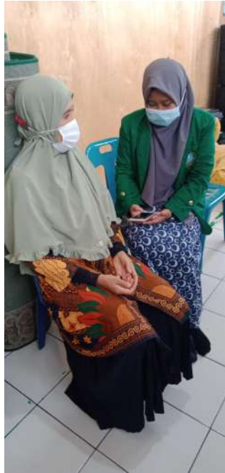
Wawancara dengan Guru BK SMP Terpadu Albukhari Muslim Medan