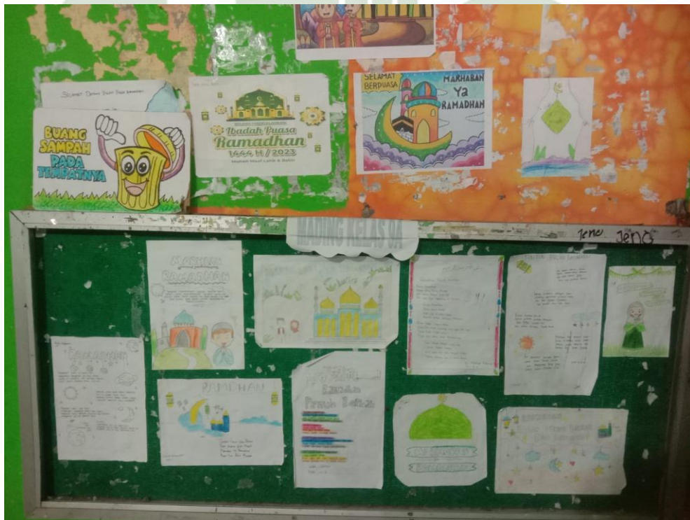
SMP GENERASI BANGSA MEDAN LABUHAN