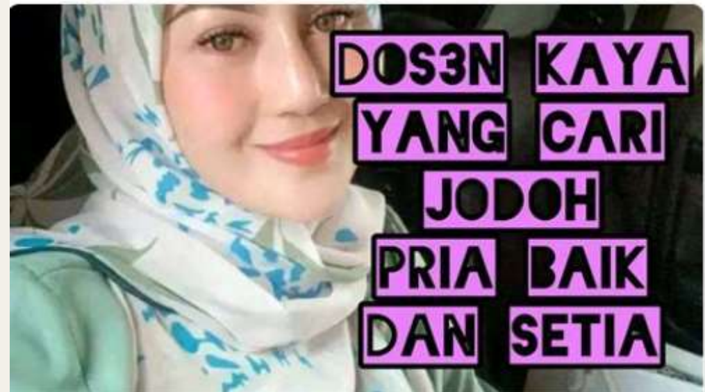
Dosen Kaya Yang Cari Jodoh Pria Baik Dan Setia_Janda Pirang Remix - YouTube