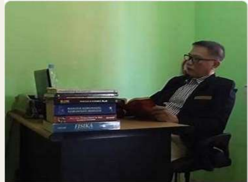
Profesi Dosen Membuat "KAYA"