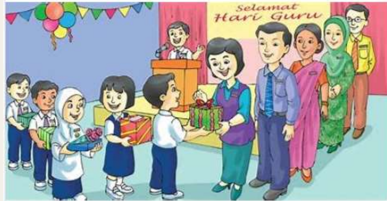
Kerjaya Guru Dan Cabaran Menuju TN50 « MYNEWSHUB