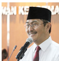
Jimly Asshiddiqie.

Menurut Jimly, sebaiknya Ketua MK Anwar Usman --adik ipar Presiden Jokowi-- tidak ikut memutus permohonan tersebut untuk menghindari tuduhan tersebut.