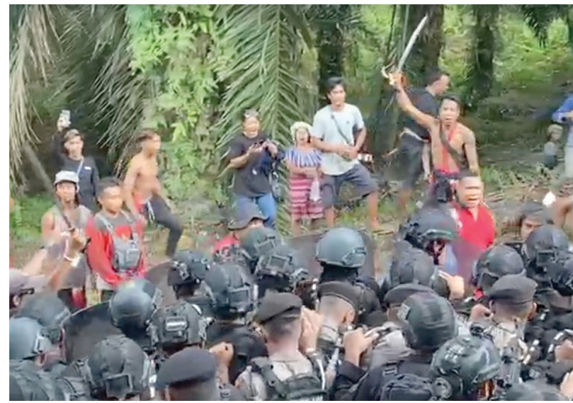
Bentrok antara warga Bangkal, Seruyan, Kalimantan Tengah dengan aparat.