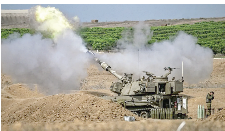
Unit artileri bergerak Israel menembakkan peluru dari Israel selatan menuju Jalur Gaza.

Pemerintah Israel resmi mengeluarkan pernyataan perang