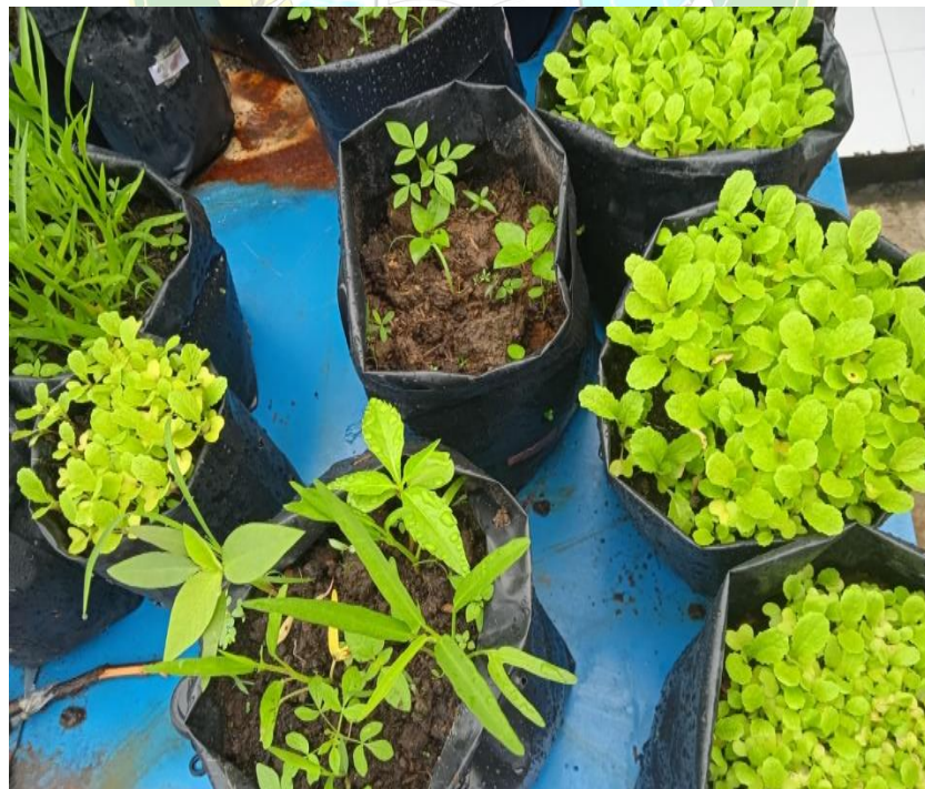
Hasil dari penanaman bibit sayur bayam,kangkung dan sawi