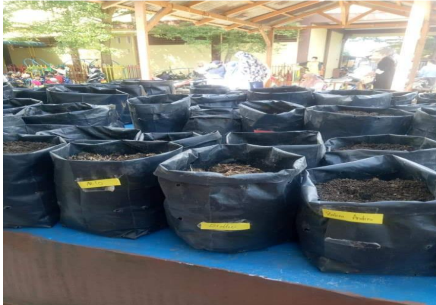
Proses dalam pembibitan sayur kangkung, bayam dan sawi kelas Zubair bin Awwam