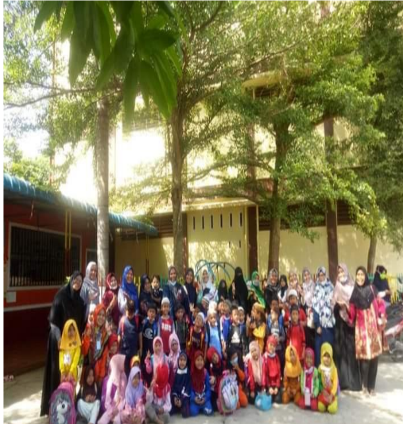
Foto bersama peserta didik kelas Zubair bin Awwam dan Wali Kelas Zubair bin Awwam