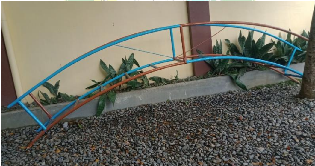
Alat Permainan Outdoor TK IT Al Fatih