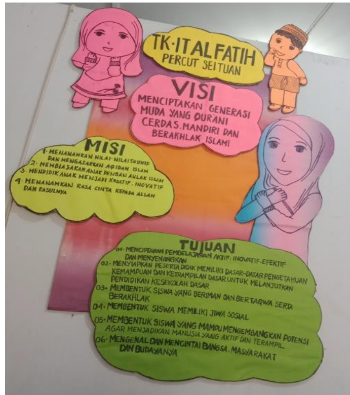
Visi dan Tujuan TK IT Al-Fatih