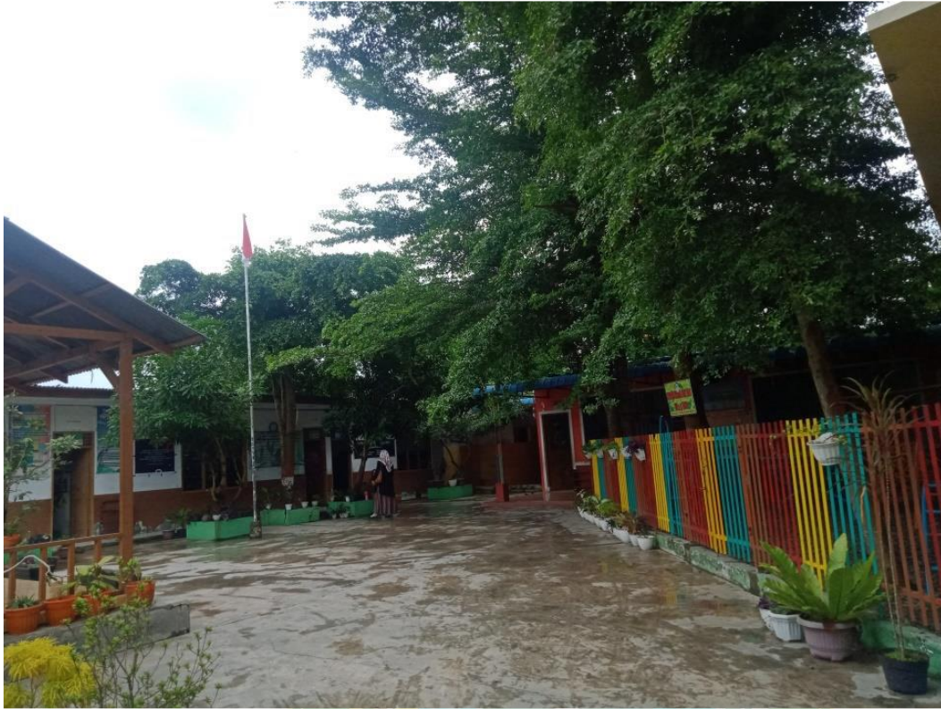
Foto Sekolah TK IT Al-Fatih