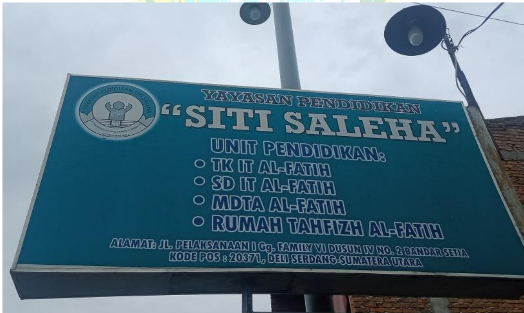
Foto Plakat TK IT Al-Fatih