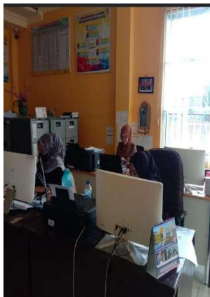
Gambar 6. Ruang Tata Usaha