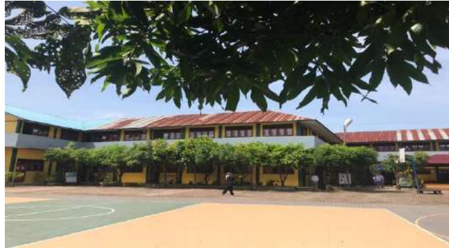
Gambar 11. Lapangan Olahraga SMK AKP Galang