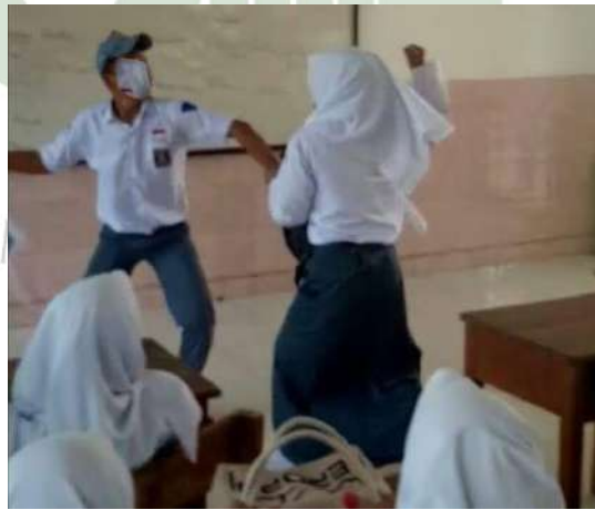
Gambar 25. Siswa dan Siswi yang sedang berkelahi