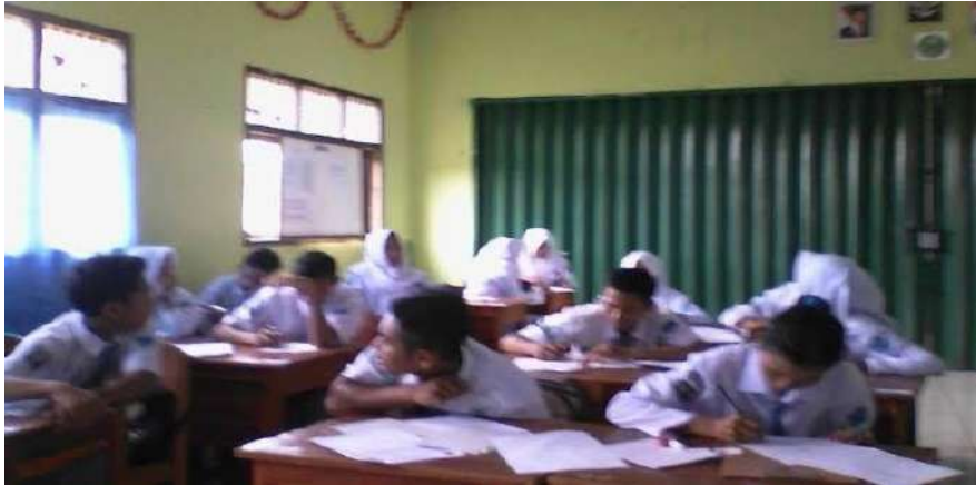
Gambar 26. Siswa saling tanya jawab dan mencontek saat ujian