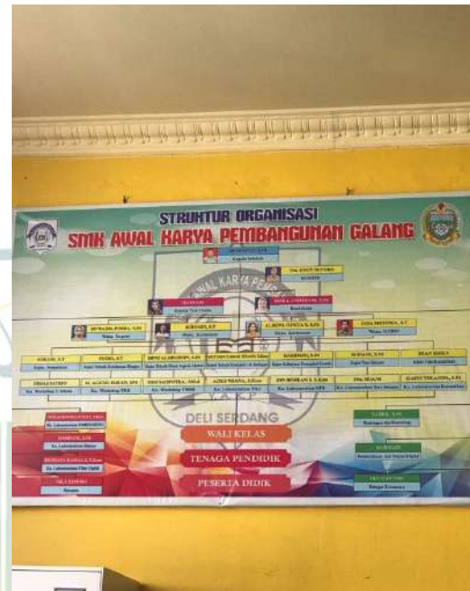
Gambar 5. Struktur Organisasi Sekolah