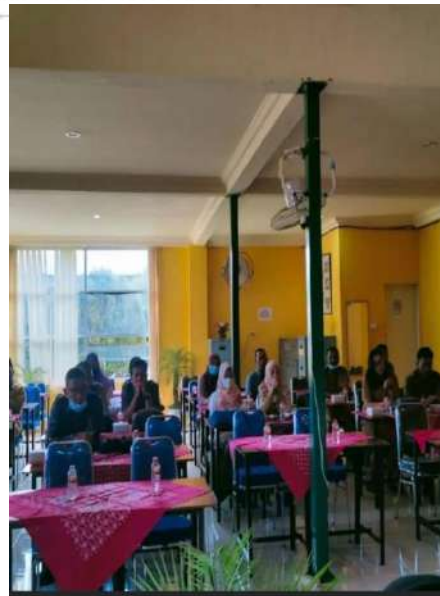
Gambar 7. Ruang Guru