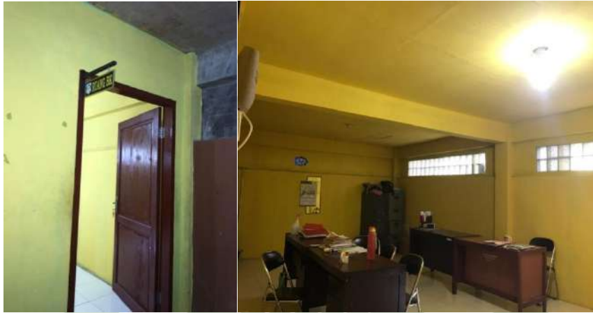
Gambar 8. Ruang BK SMK AKP Galang