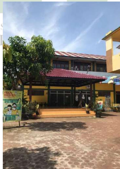
Gambar 10. Ruang Ekstrakurikuler