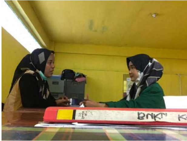
Gambar 16. Wawancara dengan Guru BK 1