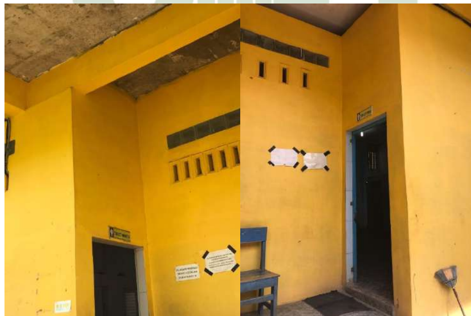
Gambar 13. Toilet SMK AKP Galang