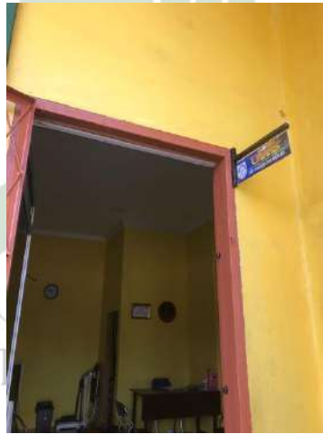
Gambar 12. Ruang UKS