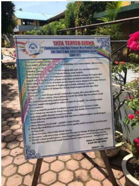
Gambar 2. Tata Tertib Siswa