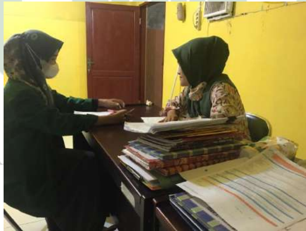
Gambar 17. Wawancara dengan Guru BK 2