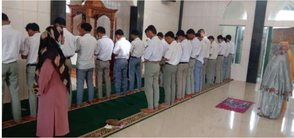
Gambar 24. Siswa SMK AKP Galang sedang sholat dzuhur berjamaah di Musholla