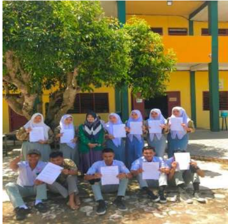
Gambar 18, 19, 20, 21, 22 Wawancara dengan Siswa dan Siswi SMK AKP Galang