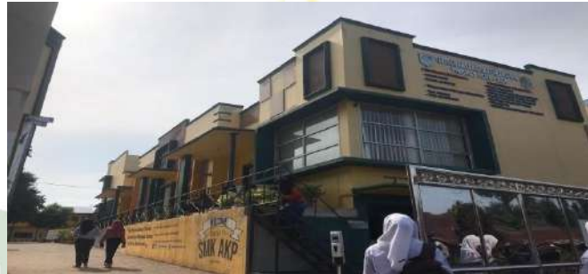
Gambar 1. Gedung Sekolah SMK AKP Galang