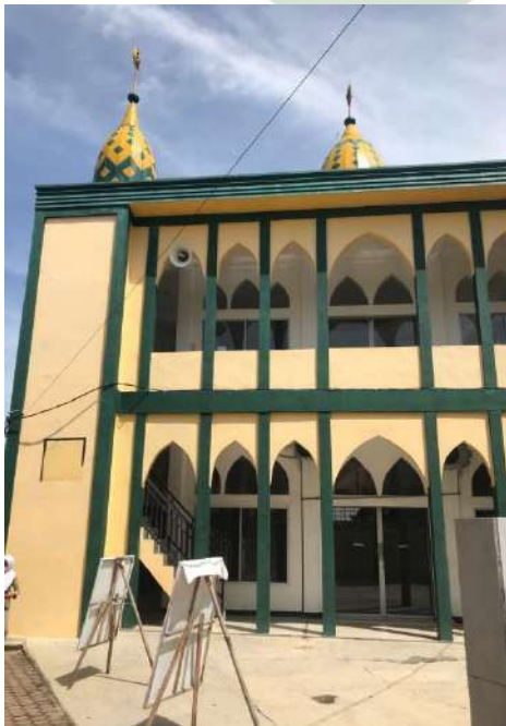
Gambar 9. Musholla Sekolah