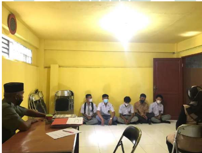
Gambar 23. Siswa yang bolos saat jam pelajaran sedang berlangsung