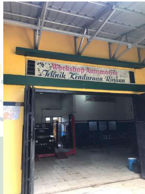
Gambar 15. Lab TKR

UNIVERSITAS ISLAM NEGERI SUMATERA UTARA MEDAN