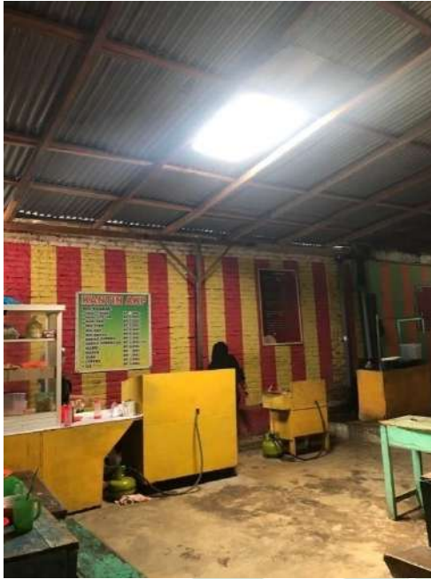
Gambar 14. Kantin SMK AKP Galang