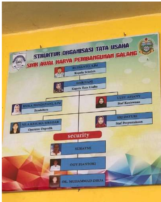
Gambar 4. Struktur Organisasi Tata Usaha