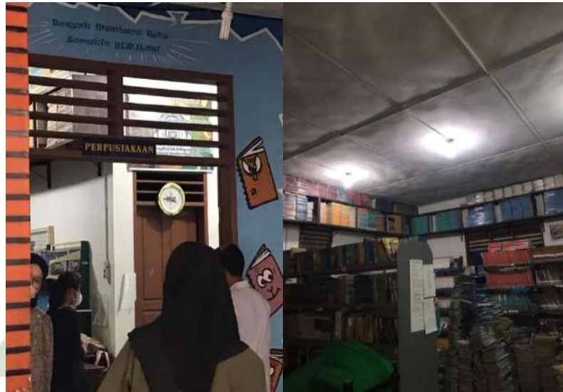
Gambar 12. Perpustakaan SMK AKP Galang