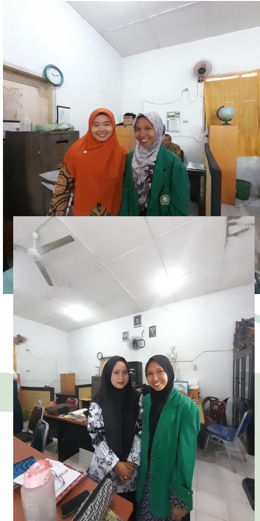
UNIVERSITAS ISLAM NEGERI Gambar 5. Kegiatan Pembelajaran SUMATERA UTARA MEDAN