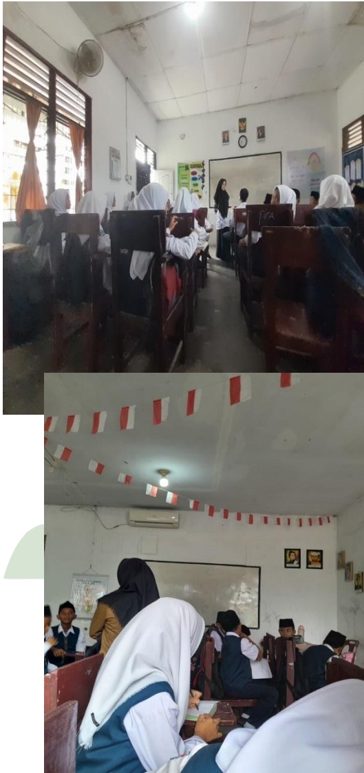
Gambar 6. Penghargaan Hasil Prestasi Siswa

UNIVERSITAS ISLAM NEGERI SUMATERA UTARA MEDAN