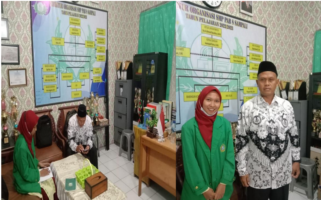
Gambar 4. Foto dengan Kesiswaan dan Guru IPS