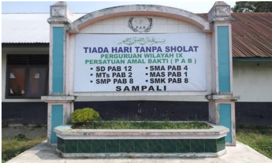
Gambar 2. Lapangan Sekolah SMP PAB 8 SAMPALI